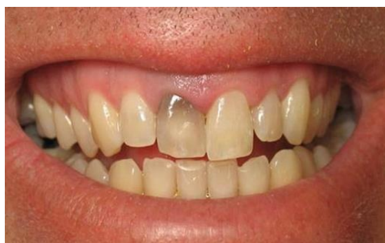
Slika 1. Visoko položena linija osmijeha.

Kod visokog položaja usnice pri jakom osmijehu potpuno su vidljive kliničke krune sjekutića s većim dijelom pripadajuće gingive (4 – 5 mm), zbog čega je ovakva situacija najveći izazov za terapeuta (Slika 1.). Pacijenti koji pripadaju ovoj kategoriji imaju povećan estetski rizik jer moramo očuvati mikrogingivnu simetriju zuba i implantata pa su potrebni detaljno kirurško planiranje i provođenje terapijskoga protokola, oblikovanje izlaznog profila, kao i odabir estetske, bijele implantatne nadogradnje i protetske suprastrukture sa svrhom postizanja adekvatnih estetskih rezultata. Ako je uz visoko položenu liniju osmijeha, tzv. gummy smile , prisutan i tanki biotip gingive, situacija postaje terapijski još zahtjevnija i estetski rizičnija. Posljedično tomu, može doći od prosijavanja sive boje titanske implantatne nadogradnje pa u takvim slučajevima prednost treba dati potpuno cirkonijoksidnim ili kombinirano cirkonijoksidnim nadogradnjama s titanskom bazom kako bi se umanjio estetski rizik. Osim toga, tanki biotip gingive pokazuje veću sklonost recesijama koje u ovoj skupini pacijenata ne mogu biti zamaskirane i prekrivene usnicom.