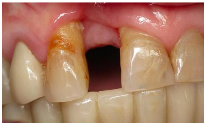
Slika 3. Restaurativni status susjednih zuba.