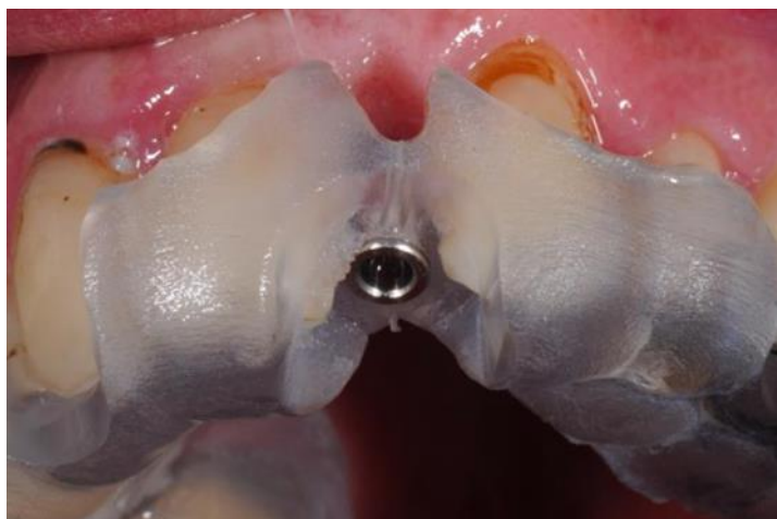
Slika 5. Digitalno izrađena kirurška šablona.