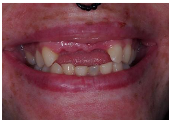
Slika 2. Produžen bezubi prostor u estetskoj zoni.

Pri nedostatku dvaju ili više zuba u fronti povećava se estetski rizik ponajprije zbog nepredvidljivosti ponašanja mekog i koštanog tkiva, ali i otežanog uspostavljanja simetričnih odnosa (Slika 2.). Odlučujući čimbenik u odabiru broja implantata jest širina bezubog prostora, pri čemu je potrebno poštovati razmak koji između dvaju implantata mora biti 3 mm, a između implantata i prirodnog zuba 1,5 mm. Ako, primjerice, u bezubom prostoru u kojemu nedostaju tri zuba nije moguće poštovati navedene razmake, ne mogu se izraditi zasebne krunice na implantatima, nego prednost valja dati mostu. To u estetskoj zoni može značiti da se, u slučaju nedostatka očnjaka i bočnoga sjekutića, implantat ugrađuje na položaj očnjaka te se izrađuje privjesni most kojim se nadomješta sjekutić (3). U takvoj se situaciji međučlanom, u pravilu, jednostavnije postiže estetski rezultat nego implantatom. Ako se u navedenoj situaciji ugrade dva implantata, zbog nepoštovanja zadanih razmaka između dvaju implantata te implantata i zuba, nastaje gubitak potporne interproksimalne kosti i interdentalne papile uz narušenu crveno-bijelu estetiku.