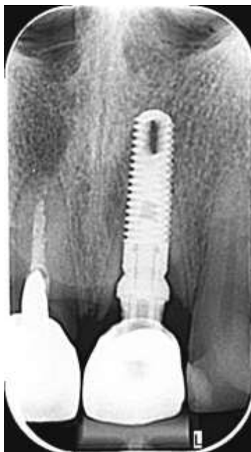
Slika 4. Kontrolna rendgenska snimka nakon zahvata s uredno postavljenim implantatom.