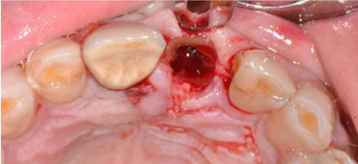
Slika 1. Izgled alveole zuba 21 nakon ekstrakcije palatinalnog segmenta uz očuvanje i oblikovanje bukalnog štita.

Čista alveola omogućit će bolji pogled na bukalni štit čiju je stabilnost potrebno provjeriti kako bismo bili sigurni da je ostao neozlijeđen. Štit se okruglim svrdlom stanjuje na debljinu od 2 milimetara te mu se daje konkavni oblik za ugradnju titanskog implantata. Bukalni segment potrebno je koronarno skratiti pomoću velikog okruglog svrdla do ruba krestalne kosti kako bi se omogućilo mekom tkivu stvaranje prikladnog izlaznog profila, što je od iznimne važnosti u estetskoj zoni. Tako učinjena preparacija bukalnog štita završava ponovnim ispitivanjem stabilnosti, nakon čega se može pristupiti imedijatnoj ugradnji implantata (31, 33).