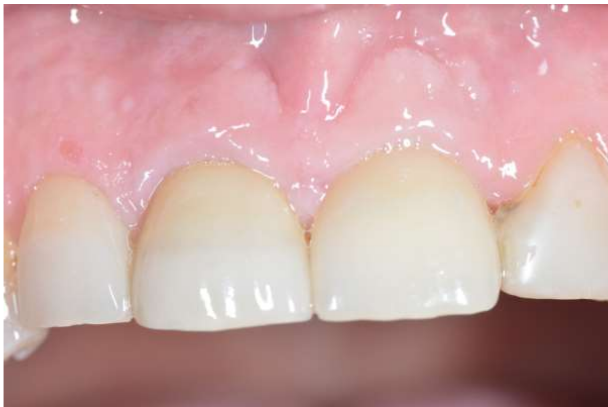
Slika 5. Izgled konačnog protetskog rada. Vidljiv je uredan izgled periimplantatnog tkiva i zacijeljena sluznica.