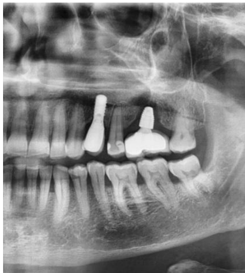
Slika 10. RTG prikaz implantata s koštanim gubitkom u obliku kratera u području 26.

Ukoliko je PPD > 5 mm potrebno je napraviti RTG sliku. Ako je BOP pozitivan i nema kratera (koštani gubitak oko implantata), provodi se postupak pod točkom A. Ako je BOP pozitivan i krater < 2 mm provodi se postupak pod točkom C ili D, a ako je BOP pozitivan i krater > 2 mm provodi se postupak pod točkom D (52).