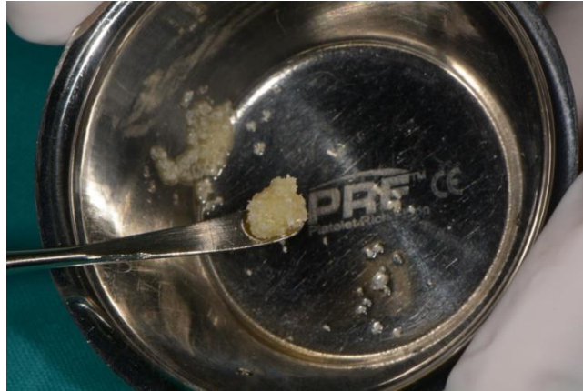
Slika 3. Augmentat ksenogenog koštanog materijala.