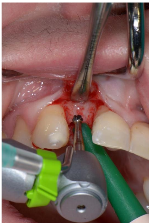
Slika 9. Početna preparacija ležišta implantata.

Nakon postave implantata, mukoperiostalni režanj vraća se u početni položaj i šiva bez tenzije kako bi se omogućilo što brže i lakše cijeljenje per primam . Što se tiče neuspjeha implantata, najznačajniji je biološki čimbenik koji uzrokuje rani (ili primarni) i kasni (ili sekundarni) neuspjeh. Razlozi ranih neuspjeha pripisuju se prevelikoj kirurškoj traumi, usporenom zacjeljivanju, bakterijskoj kontaminaciji i preranom preopterećenju. Kasni neuspjesi implantacije povezani su s periimplantitisom i okluzalnim preopterećenjem. Na taj se način rani neuspjeh implantacije može opisati kao neuspjeh u postizanju oseintegracije, dok kasni predstavlja neuspjeh u održavanju oseintegracije. Mehanički neuspjesi uključuju lom implantata i suprastruktura, dok jatrogeni neuspjesi podrazumijevaju krivi položaj, odnosno angulaciju implantata pri čemu se narušava anatomija okolnih struktura. Implantiranje u mandibularni kanal ili maksilarni sinus predstavljaju jatrogeni neuspjeh (39, 41).