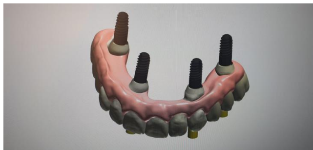
Slika 7. Prikaz virtualnog položaja implantata prije same ugradnje.