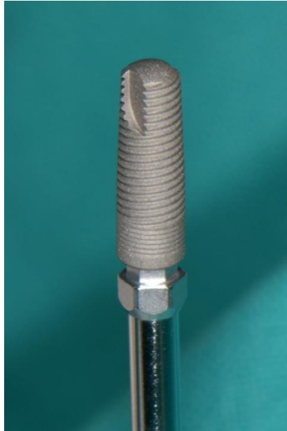
Slika 11. Prikaz titanskog implantata. Preuzeto uz dopuštenje autora dr.sc. Marka Vuletića.