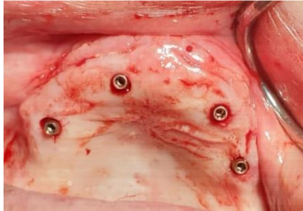
Slika 2. Prikaz ugradnje implantata flapless tehnikom.

Prednosti ove metode su kraće trajanje kirurškog postupka, minimalno krvarenje, manje postoperativne nelagode za pacijenta, mogućnosti trenutnog opterećenja ugrađenog implantata te manje vremena potrebnog za kompletnu implantoprotetsku restauraciju. Zbog smanjene preglednosti, postoji opasnost od fenestracije kortikalne kosti i oštećenja anatomskih struktura. Zbog navedenog danas se rijetko koristi (34, 36).