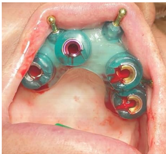
Slika 8. Kirurška šablona fiksirana u ustima s pinovima. Preuzeto uz dopuštenje autora dr.sc. Marka Vuletića.