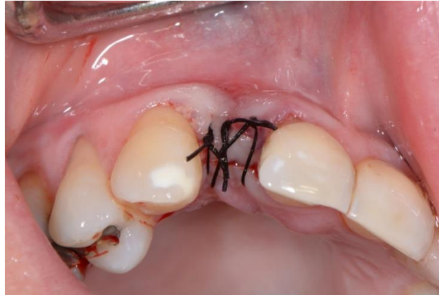
Slika 5. Zašivena implantirana regija per primam . Preuzeto uz dopuštenje autora dr.sc. Marka Vuletića.