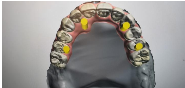
Slika 6. Prikaz virtualnog planiranja fiksno protetskog rada na 4 implantata.

objedinjuje posebne softvere za kirurško planiranje, 3D snimke dobivene CBCT-om te precizne kirurške šablone koje će virtualni plan prenijeti u stvarnost. Posebni softveri omogućuju vizualizaciju anatomskih struktura, virtualno protetsko planiranje i implantaciju. Kirurške šablone, koje su napravljene za svakog pacijenta individualno, omogućuju prijenos virtualnog plana u stvarnost. Pri implantiranju one nas navode gdje i kako postaviti implantat, čime je olakšan rad stomatologa te smanjena mogućnost pogrešaka i komplikacija (37, 38).