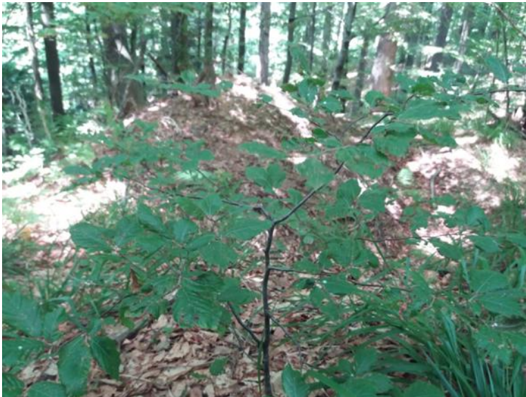
Slika 5: Plagiotropni efekt na mladoj biljci obične bukve

Nema posebne zahtjeve prema reljefnim obilježjima. Razvija se na različitim stranama svijeta, različitim nagibima i nadmorskim visinama. Na sjevernim ekspozicijama nalazi optimalne ekološke uvjete za razvoj jer tamo ima i najveću vertikalnu amplitudu rasprostranjenja. Velike količine snijega i strmi nagibi na većim nadmorskim visinama utječu na nastanak deformiranih donjih dijelova debla i pridanka – pokazatelj velike prilagodljivosti bukve na ekstremne ekološke uvjete.