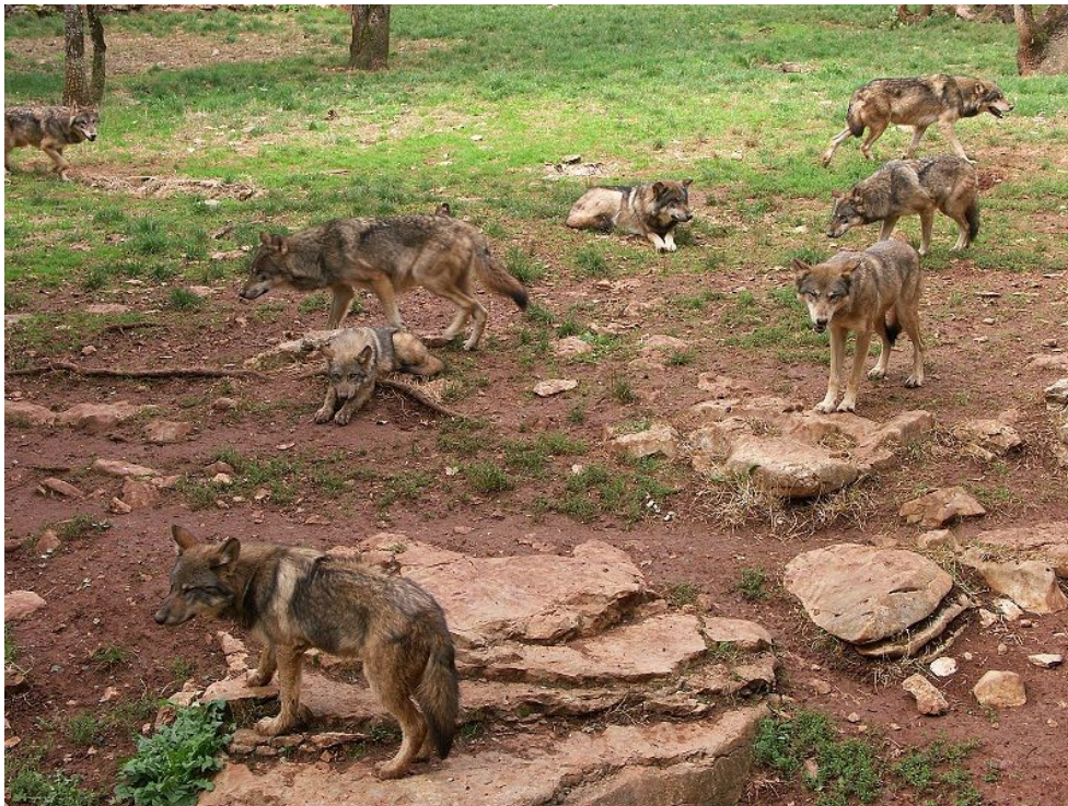
Slika 2 Čopor vukova

Sivi vuk je vrsta koja živi u manjem ili većem čoporu. Čopor je obiteljska zajednica, hijerarhijski ustrojena, koju čini jedan reproduktivni (dominantni) par vukova, štenad i njihova starija braća i sestre. Dakle, roditeljski par vukova ima dominantan položaj, dok ostali međusobno grade nadređeni i podređeni odnos. Ovaj način života smatra se evolucijskim napretkom jer vukovi love poglavito krupni plijen (jelene, srne i divlje svinje) te živeći u skupini mogu lakše uhvatiti plijen i odmah ga pojesti, tj. posve iskoristiti (Poklar, 2013.) Veličina čopora ovisi o količini hrane na tom prostoru. O tome kada će se ići u lov i gdje će biti brlog odlučuje dominantan vuk ili vučica. Samo dominantna vučica u čoporu može imati mlade, što je jedan od mehanizama samoregulacije veličine populacije vuka, a time je spriječeno i parenje u srodstvu. Može se reći da vodstvo čopora u vrijeme parenja preuzme vučica jer ona odlučuje gdje će se okotiti, što znači da o njezinoj odluci ovisi na kojem će području čopor živjeti i loviti dok je štenad još premalena za praćenje čopora (Kusak, 2002.). Položaj dominantnog para se zadržava sve do smrti jednog člana tada, da ne bi došlo do raspada čopora, potrebno je da čopor prihvati stranog vuka istog spola kao nastradala jedinka te taj vuk postaje novi član reproduktivnog para.