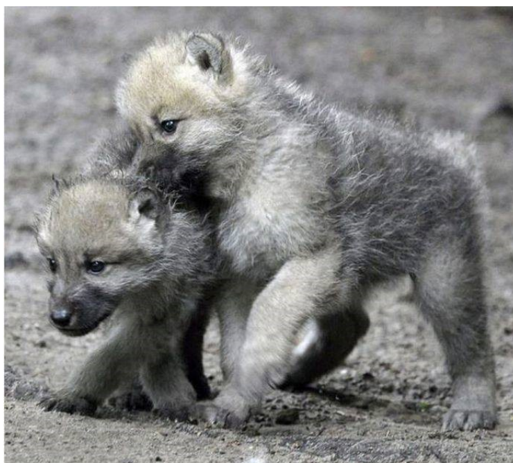
Slika 4 Štenad vukova

U čoporu se pari samo dominantna ženka te samo ona ima pravo na potomstvo, dok su ostali vukovi u čoporu vezani rodbinskim vezama. Vučica se tjera jednom godišnje u razdoblju od kraja siječnja do travnja što ovisi o teritorijalnoj raspoređenosti. Tako tjeranje u sjevernijim predjelima počinje kasnije nego u južnijim predjelima. U trećem tjednu tjeranja događa se parenje, a skotnost traje 63 dana. Vučići se rađaju u brlogu kojeg je vučica sama odabrala i iskopala. Najčešće ima 4 do 7 mladih u leglu, koji su gluhi i slijepi do 11. – 15. dana života. Brojnost štenadi ovisi o dostupnosti hrane i o gustoći vučje populacije na određenom području. Naime, ako na nekom području ima više vukova, njihova su legla manja i obrnuto. Na hranu, koju im donose drugi članovi čopora, postupno prelaze u dobi od šest do osam mjeseci, do tada sišu majčino mlijeko. Okupljalište je naziv za mjesto na kojem vučići odrastaju i na kojem se odrasli vukovi svaki dan okupljaju. Kada mladi vukovi postignu veličinu odraslog vuka počinju putovati i sudjelovati u lovu zajedno s ostatkom čopora. Do tad lovna aktivnost se obavljala samo u blizini brloga, kako bi mladunčad bila maksimalno zaštićena. Spolnu zrelost postižu u dobi od 22 mjeseca, nakon čega mogu napustiti čopor te osnovati svoj vlastiti.