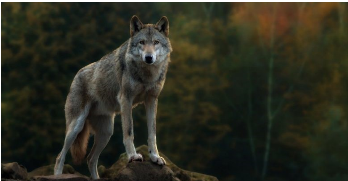
Slika 1 Sivi vuk ( Canis lupus L. )

Veličina tijela i boja dlake su različite te variraju s obzirom na stanišne uvjete i prilike, stoga se u literaturi spominje više podvrsta sivog vuka. Osim sivog vuka, poznate su još dvije živuće vrste vukova, to su crveni vuk ( C. rufus ) i abesenski vuk ( C. simensis ).