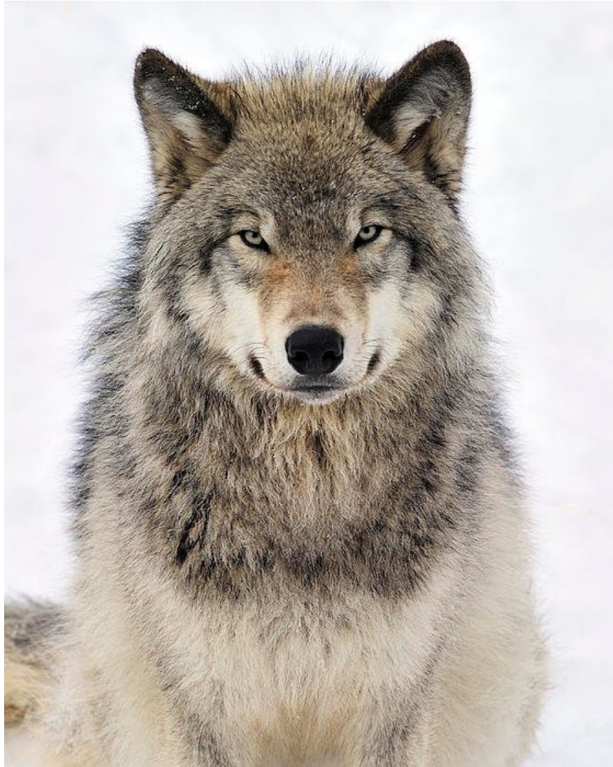
Slika 7 Sivi vuk ( Canis lupus L.)

Brane koje su sagradili pružili su stanište patkama, vidrama, ribama reptilima i vodozemcima. Razvojem šume promijenili su se i vodotoci rijeka, smanjile su se erozije, suzila su se korita, formiralo se više bazena i više slapova što je pogodovalo bujanju vegetacije i životinjskog svijeta. Istraživanje navodi kako je samo 14 vukova uspjelo u svega 21 godinu transformirati ne samo ekosustav parka već i fizički, njegovu geografiju. Osigurati hranu i mjesto za život brojnim životinjskim vrstama koje je čovjek protjerao ubijajući vukove kao grabežljivce.