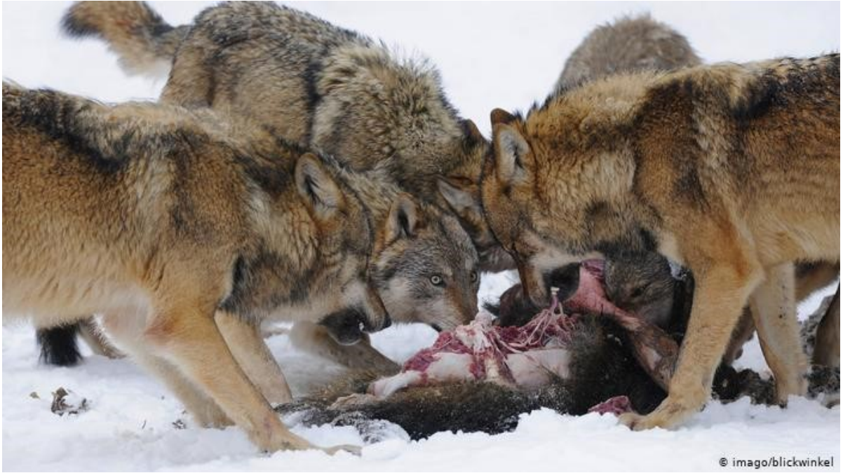
Slika 3 Čopor vukova se hrani ulovljenim plijenom