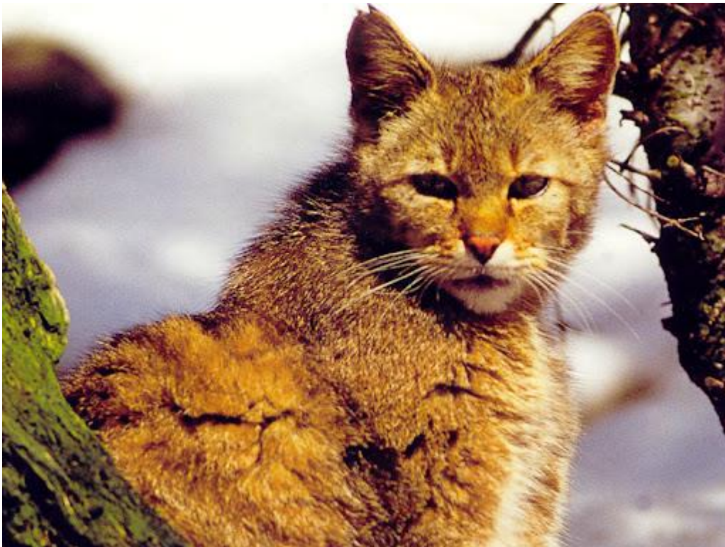
Slika 4. Divlja mačka u svom prirodnom okruženju; NP Krka

Starije visoke šume najpogodnije su stanište za divlju mačku. Nalazimo ju u bjelogoričnim šumama po čemu se razlikuje od ostalih podvrsta divlje mačke koje nalazimo u stepama. Najčešće ju nalazimo u gorskim i planinskim područjima, mediteranskoj makiji (Ragni, 1981), u obalnim, poplavnim šumama velikih rijeka kao i u nekim priobalnim područjima (Scott i sur., 1992). Zimzelene šume za divlju se mačku smatraju marginalnim staništem zbog nedostatka resursa za prehranu i skloništa. Sječom šuma dolazi do gubitka potencijalnih skloništa za divlju mačku, pogotovo u vidu uklanjanja suhih stabala. Divlja mačka smatra se krovnom vrstom (umbrella species) zbog odabira staništa i velikog životnog prostora. Od zaštite staništa divlje mačke s ciljem očuvanja potencijalnih skloništa može profitirati ris i ostale vrste iz porodice Mustelidae (Jerosch i sur., 2010).