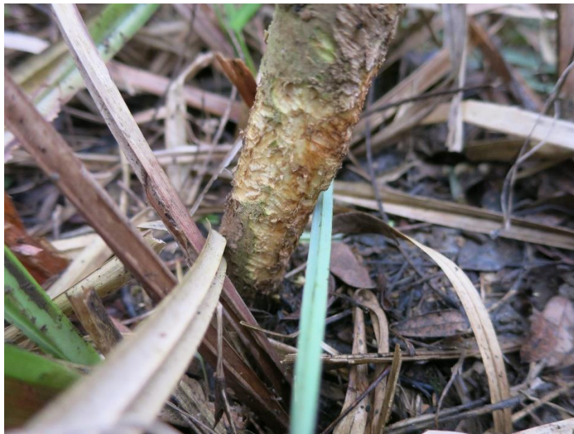
Slika 1. Štete od glodavaca na kori pomlatka

U šumama Hrvatske tipične štete od glodavaca jesu one na šumskom sjemenu, stabljici, kori i korijenu biljaka. U godinama masovne pojave glodavaca ove štete mogu imati vrlo ozbiljne posljedice vidljive kroz otežanu prirodnu obnovu, i to osobito u nizinskim šumskim zajednicama u fazi obnove, gdje može doći do gotovo potpunog uništenja uroda žira. Štete na sjemenu su posebno izražene u godinama obilnog uroda sjemena (Bjedov et al., 2017), koje prati i porast brojnosti populacija glodavaca.