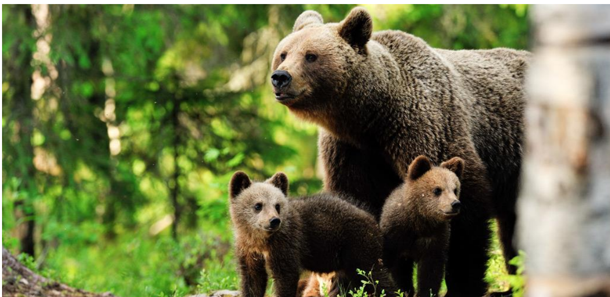
Slika 3. Ženka smeđeg medvjeda s mladuncima

Schwartz i sur. (2003.) navode da spolna aktivnost smeđeg medvjeda počinje relativno kasno, obično nakon četvrte godine života. Naši smeđi medvjedi spolno su zreli u dobi od 3 do 4 godine. Smeđi medvjed u prirodi može doživjeti 10 do 20 godina (Huber i sur., 2008.). Potraga za hranom je glavni pokretač kretanja kao i odabira staništa smeđeg medvjeda (Herrero, 1985.; Swenson, 2000.). U proljeće, smeđi medvjed svake noći traži hranu, u pravilu u područjima manje nadmorske visine i veće otvorenosti prostora s ranijom vegetacijom i proteinskom hranom, odnosno bliže ljudima, a danju se povlači u mirna i gusto obrasla područja (Huber i sur., 2008.).