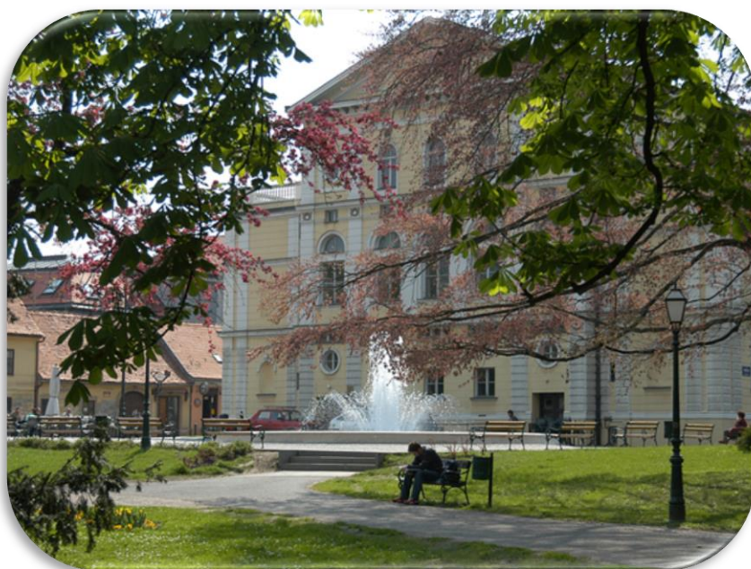
Slika 12: Hrvatsko narodno kazalište u Varaždinu zajedno s kružnom fontanom