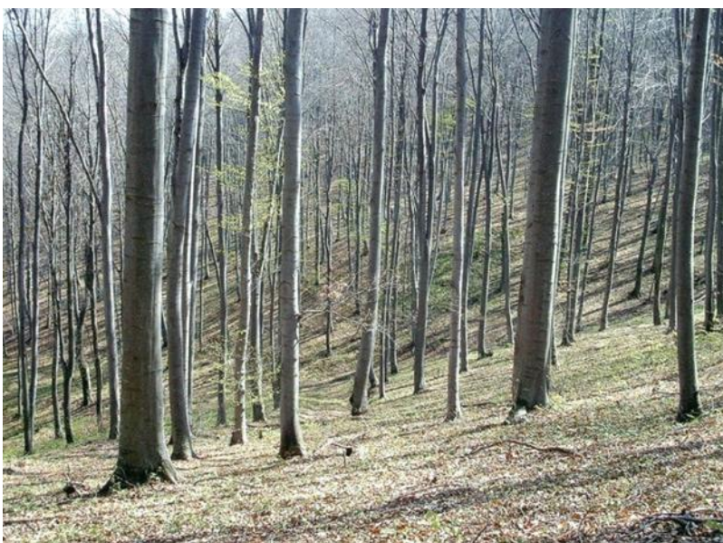
Slika 3: Obična bukva na Papuku

(56% površine šuma). Najznačajnije su mješovite bukove šume sa kitnjakom (700000 ha), čiste bukove šume (250000 ha) i šume bukve i jele (165000 ha). U Republici Hrvatskoj najzastupljenija je vrsta drveća. dominantna je u brdskim i planinskim područjima (Papuk, Pšunj, Bilogora, Kalnik, Medvednica, Ivanščica, Macelj, Gorski Kotar, Lika). Susrećemo je i u submediteranskom području. Gornja granica rasprostranjenja je oko 1500 m.n.v na Velebitu, Dinari, Risnjaku, a u submediteranu se spušta do 600 m.n.v. u šumama lužnjaka i graba na gredama nizinske Hrvatske spustila se na oko 100 – 120 m.n.v (Opeke, Česma, Veliki Jantak i Žutica, Rečica).