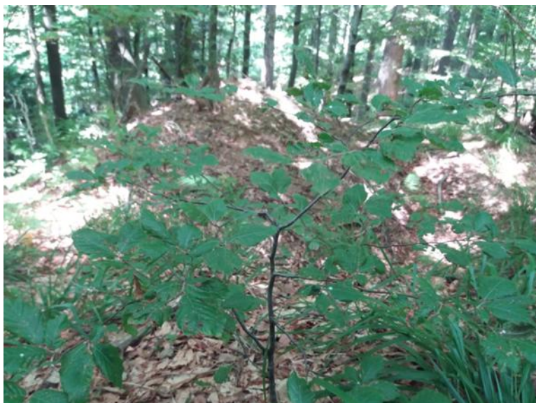
Slika 5: Plagiotropni efekt na mladoj biljci obične bukve

Nema posebne zahtjeve prema reljefnim obilježjima. Razvija se na različitim stranama svijeta, različitim nagibima i nadmorskim visinama. Na sjevernim ekspozicijama nalazi optimalne ekološke uvjete za razvoj jer tamo ima i najveću vertikalnu amplitudu rasprostranjenja. Velike količine snijega i strmi nagibi na većim nadmorskim visinama utječu na nastanak deformiranih donjih dijelova debla i pridanka – pokazatelj velike prilagodljivosti bukve na ekstremne ekološke uvjete.