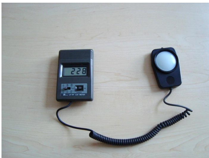
Slika 1: Instrument za mjerenje osvijetljenosti (lx)