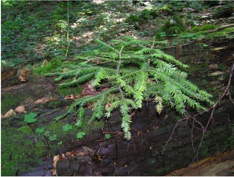
Slika 2: Mlada obična jela u zasjenjenim uvjetima

Na slici 2 prikazana je mlada obična jela u zasjenjenim uvjetima s obzirom na intenzitet svjetla u sastojini. Postrani izbojci su dulji od vršnog izbojka.