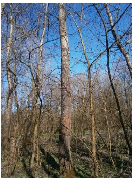
Slika 1. Stabla bijele topole s lokaliteta na području Osijeka.

Za prethodno istraživanje odabrano je pet zdravih i ravnih stabala bijele topole iz prirodne populacije (Slika 1.). Uzorci su prikupljeni u travnju 2013. godine. Iz svakog oborenog stabla na prsnoj visini uzet je kolut debljine 50mm. Na izrezanim radijalnim segmentima iz koluta odabran je 2., 4., 6., 8. i 10. god od srčike. Iz uzorka svakog goda izrađeni su histološki preparati poprečnog presjeka na kojima je izmjerena dvostruka debljina stijenke drvnih vlakana i promjera lumena drvnih vlakana. Dvostruka debljina stijenki izmjerena je na svjetlosnom mikroskopu, pod ukupnim povećanjem 960 x. Iz svakog goda izmjereno je 30 tangencijalnih dvostrukih debljina stijenki drvnih vlakana. Podaci o dvostrukoj debljini stijenki i promjeru lumena drvnih vlakana korišteni su u ovom radu za izračun Runkelovog omjera.