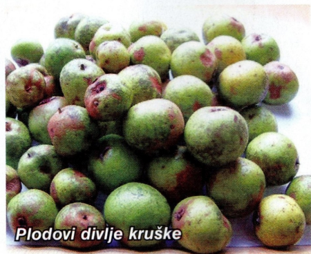
Plodovi divlje kruške

150 godina. Spada u skupinu ugroženih vrsta drveća i u budućnosti bi joj trebalo posvetiti što veću pozornost, kako u temama znanstvenih istraživanja, tako i u operativi kako ne bi nestala iz naših šuma.