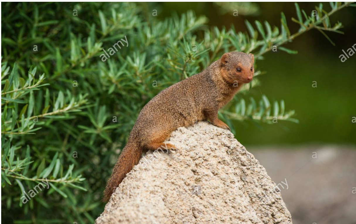
Slika 6. Mungos u izvdnici

Mungosi u skupini komuniciraju trljanjem dlanova, ispuštanjem glasova ili hrvanjem. Na popodnevним vrućinama cijela skupina mungosa se sunča na leđima oko svog brloga.