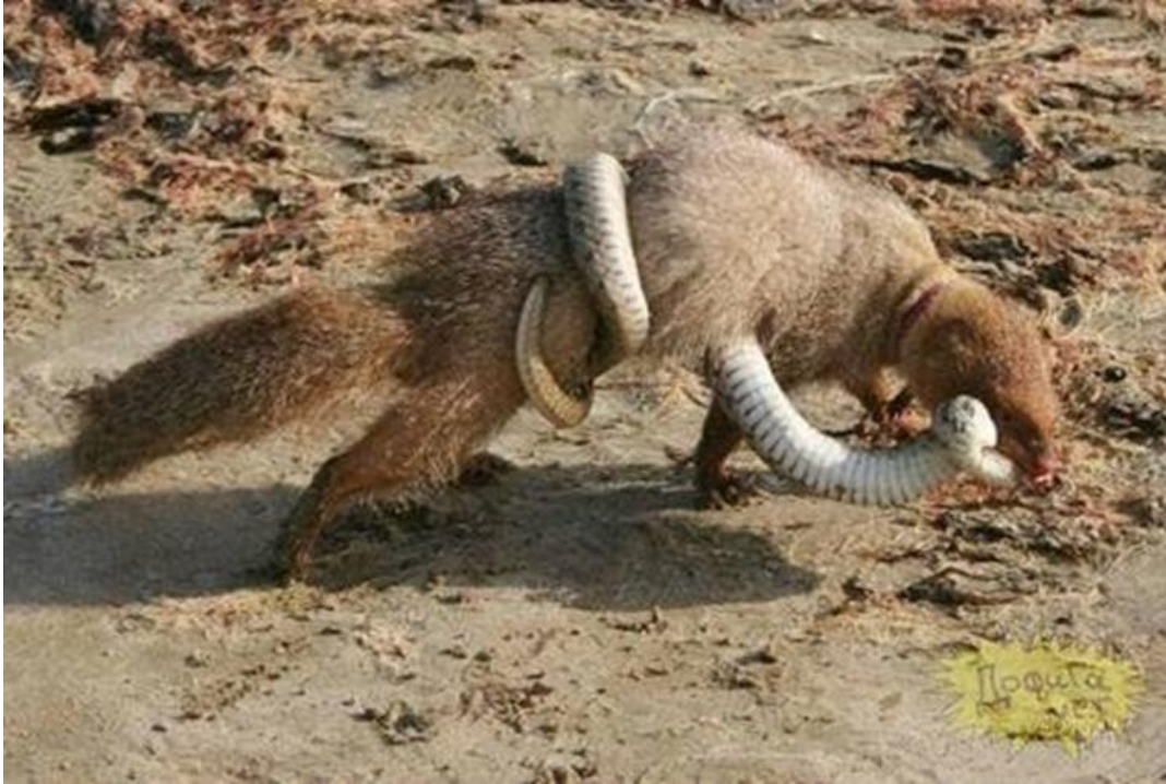
Slika 7. Mungos u borbi sa zmijom

Kada mungosi idu u potragu za hranom, najčešće to rade pojedinačno. Čak i ako nekoliko mungosa traži hranu blizu jedan drugome, ostaju pri samostalnom lovu. Mungosi love u čoporu samo ako moraju nadvladati veći plijen.