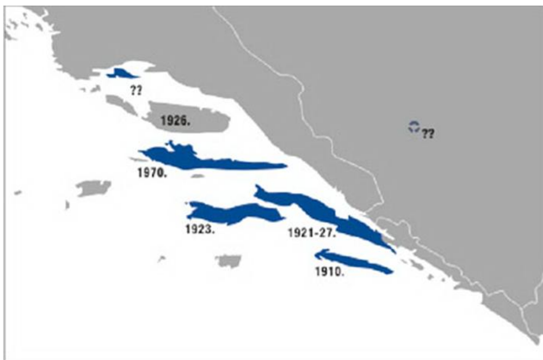
Slika 4. Širenje mungosa na jadranskim otocima