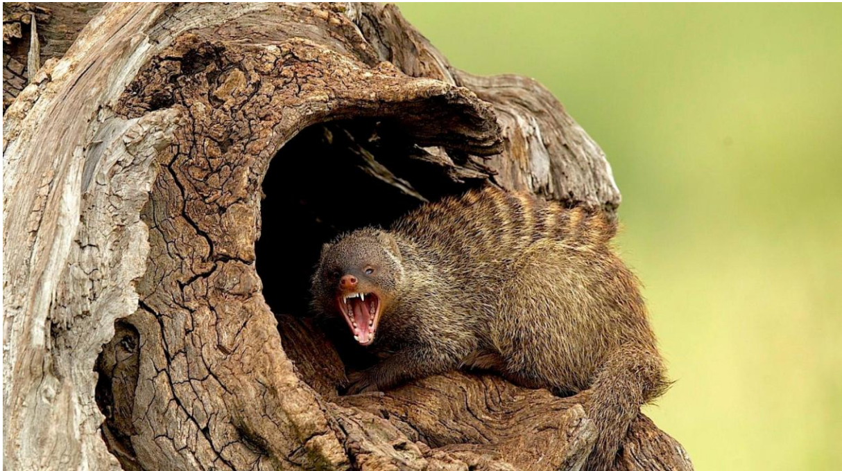
Slika 8. Nakostriješeni mungos

Glavni način obrane mungosa je prikrivanje i skrivanje. Boja njihove dlake stapa se s okolišem te su tako manje izloženi opasnosti. No, kada dođe do situacije kada se mora suočiti s određenim neprijateljem, mungos ima isti obrambeni stav kao i mačke. Leđa im se izvinu, podignu repove i nakostriješe dlaku te ih to čini duplo većim od njihove normalne veličine. Kako bi otjerali protivnika proizvode razne zvukove kao što su režanje i lavež, a ako im se neprijatelj previše približi, mungosi napadaju jakim ugrizima. Uz to, za vrijeme borbe, iz analnih žlijezda izlučuju sekret koji miriši kao mošus.