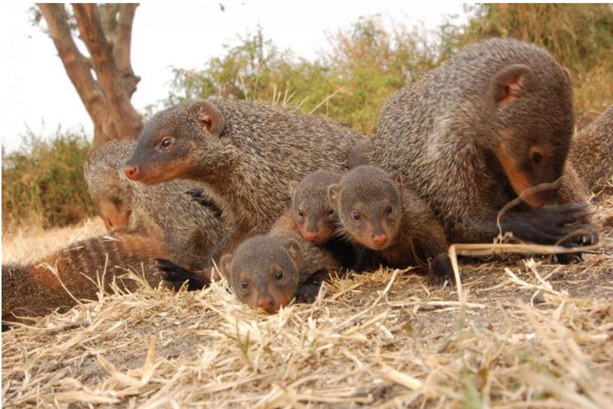
Slika 9. Obitelj mungosa

Životni vijek mungosa traje oko 5 do 7 godina.