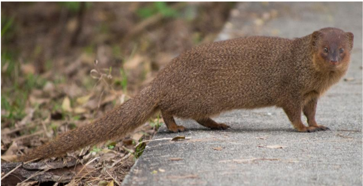
Slika 5. Mali indijski mungos

Mungose karakterizira izduženo tijelo, dužine 40 do 50 cm. Mali indijski mungos je najmanji te je njegovo tijelo dugačko od 25 do 41 cm. Na tijelo se nadovezuje rep dužine 15 cm. On završava čupavim dakama u obliku kista. Rep im je kitnjast. Mungosi se kreću na kratkim nogama jer njihova visina doseže tek do 20 cm. Na stopalima imaju četiri ili pet prstiju, a na svakom se nalaze duge kandže koje im pomažu pri kopanju. Tijelo mungosa prekriveno je dlakom dugom do 7 cm. Boja krzna varira od smeđe do sive. Područje oko očiju, njuška i prsti na nogama slabije je dlakavo, to jest dlaka je kraća u odnosu na ostatak tijela. Noge i glava djeluju tamnije jer nemaju srebrnkastih dlaka, odnosno srebrnog odsjaja. Ispod brade i na obrazima ima crvenkastu dlaku što mungosima daje prepoznatljiv izgled. Njuška mungosa je izdužena, šiljasta. Na glavi se nalaze male, zaobljene uši iza očiju. Oči su kod odraslih jedinki smeđe boje, a kod mladunaca plavozelene. Na očima imaju opnu koja sprječava ulazak prašine. Mungosi nemaju mirisne žlijezde.