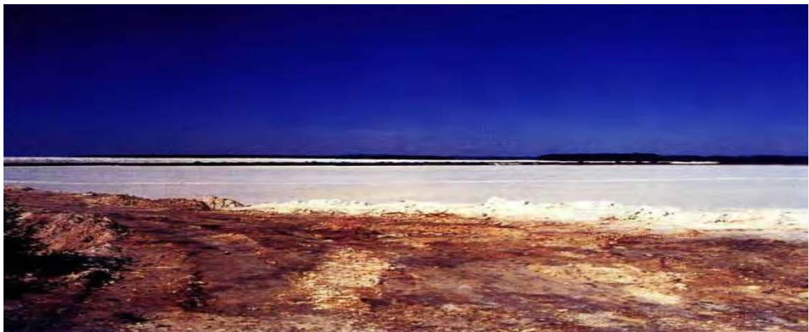
Slika 5. Izgled kazeta u koje se odlaže fosfogipsa

U neposrednoj blizini odlagališta fosfogipsa na području Kutinskog bazena primijećeno je sušenje i propadanje hrasta lužnjaka. Provedeno je istraživanje o tom problemu, sluteći da je do odumiranja lužnjaka došlo zbog utjecaja fosfogipsa, nusprodukta koji nastaje kod proizvodnje umjetnih gnojiva. Hrast lužnjak u blizini tog odlagališta sa 60-70% oštećenosti krošnje pripada kategoriji jako oštećenih stabala. Provedenim istraživanjem utvrđeno je da postoji poveznica između odlaganja fosfogipsa i propadanja stabala hrasta (Roša, 1998).