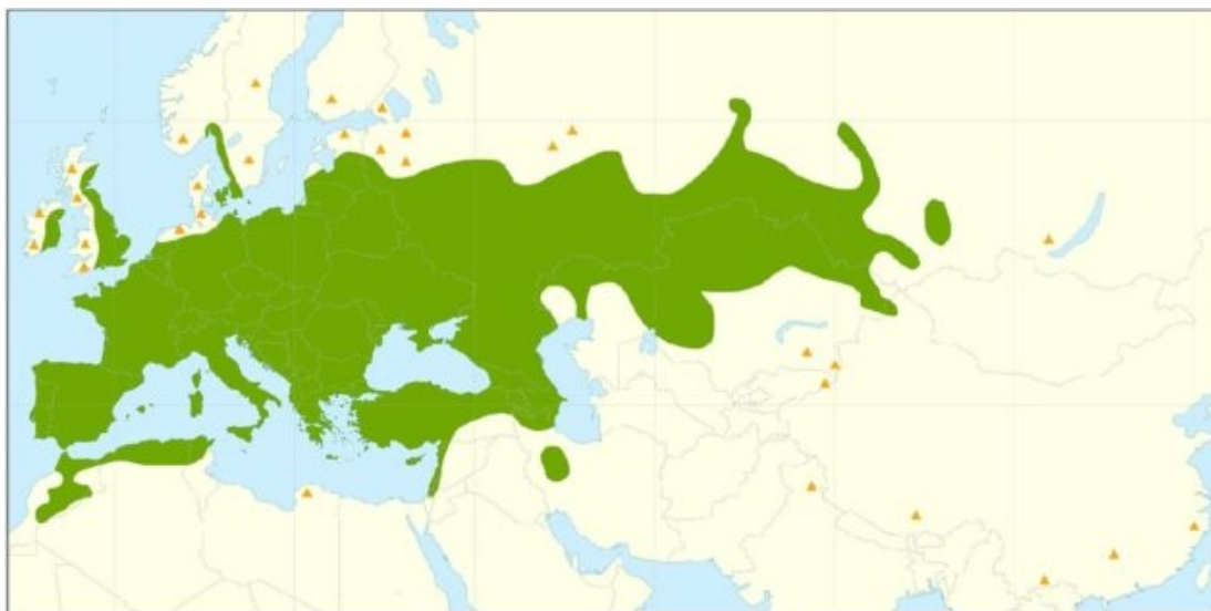
Slika 1. Prirodna rasprostranjenost bijele vrbe ( Salix alba L.), Rungis i sur. 2017.

Populetum nigrae Tx. 1931) i u šumama bijele i crne topole ( Populetum nigro-albae Slavnić 1952) (Vukelić i Rauš 1998; Vukelić 2012).