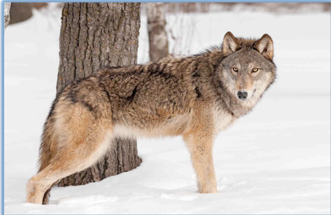
Slika 1. Vuk ( Canis lupus L.)