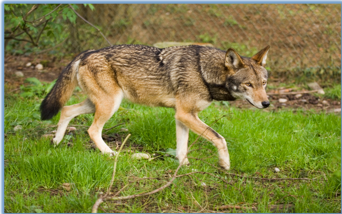
Slika 2. Crveni vuk ( Canis rufus Audubon & Bachman, 1851.)