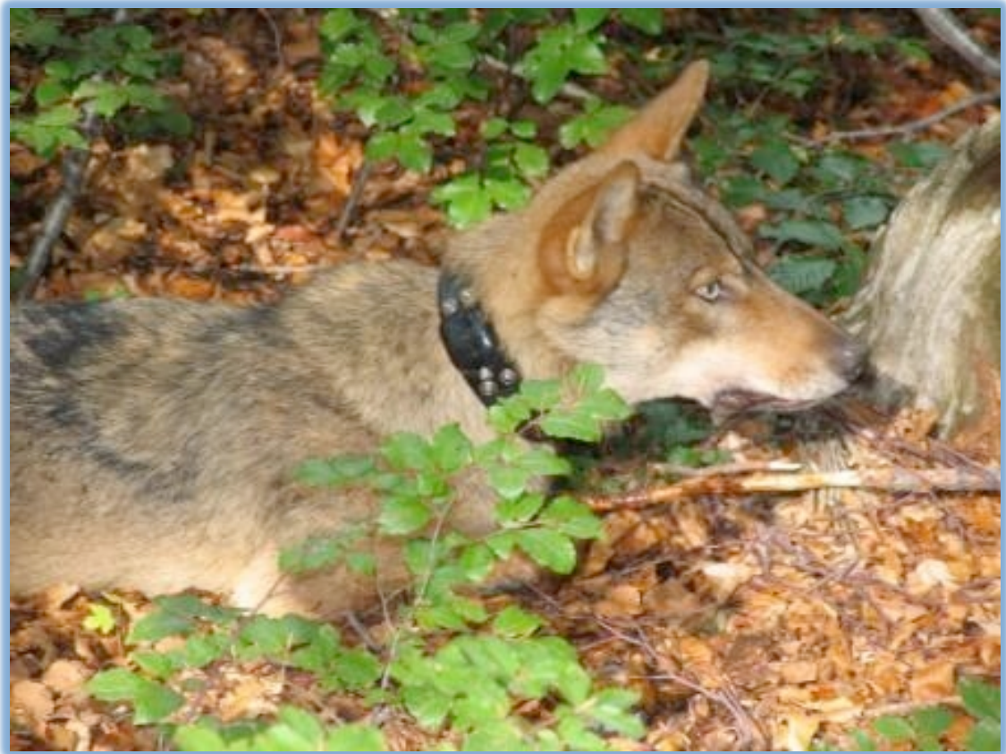
Slika 11. Stavljanje GPS ogrlice je početak telemetrijskog praćenja