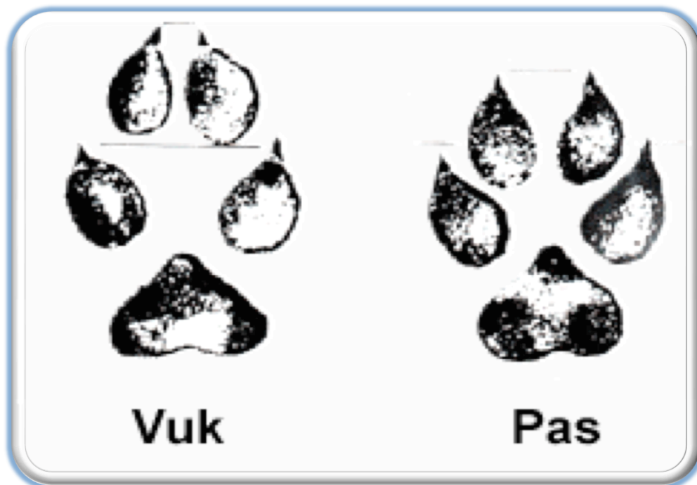
Slika 7. Prepoznatljivi otisak šape vuka i psa

prstiju. Kod pasa je oblik šape više okrugao, a nokti postraničnih prstiju dopiru do pola jagodica srednjih prstiju (Gulin, 2017). Stražnje noge vuka kreću se u istoj ravnini s prednjima, dok većina pasa stavlja stražnje noge unutar tragova prednjih. Znakovi na plijenu vuka su specifični. Vukovi plijen hvataju za vrat snažnim ugrizom i trzajima, otkidaju tkivo i vratne žile, te plijen brzo ugiba od iskrvarenja ili gušenja. Kod napada na veći plijen, vuk ga grize za stražnji dio (butovi) i tada ne mora biti ugriza na vratu. Ukoliko ih se ne uznemirava, svoj plijen pojedu u potpunosti, ostaje samo koža, kralježnica i krajnji dijelovi nogu. Također, prisutnost vukova se može odrediti na osnovu njihova zavijanja, boji i mirisu izmeta (potrebno više iskustva) te izmjerom lubanje na temelju orbitalnoga kuta (kut koji zatvaraju linija koja ide preko gornjeg i donjeg ruba očne šupljine te poprečna linija preko vrha lubanje). Kod vukova je taj orbitalni kut 40 do 45°, a kod pasa 53 do 60° (Kusak, 2004).