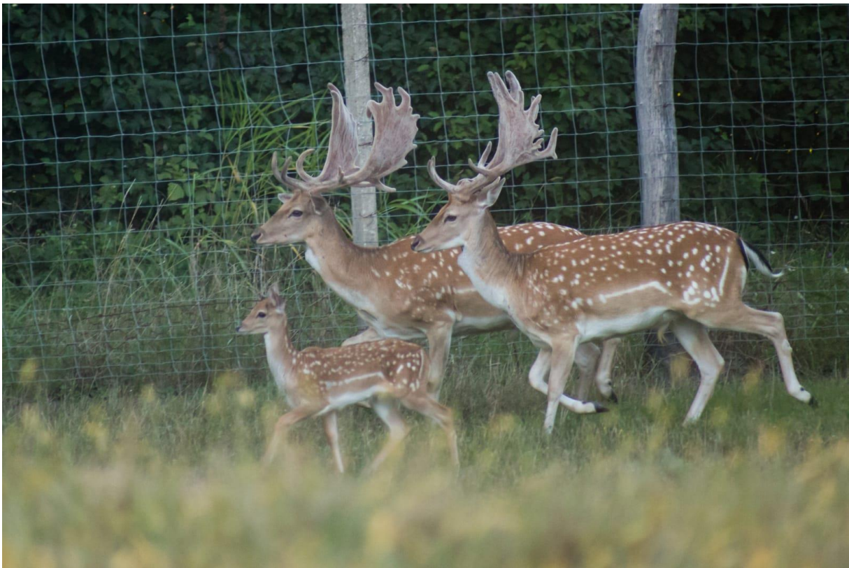
Slika 10. Primjer ograde koja ima betonske stupove te stupove od bagrema, donji dio s malim oknima te je ukopana u zemlju.

Podizanje ograde jedan je od prvih poslova pri osnivanju uzgoja jelena lopatara. Ona je najvažniji i najskuplji dio svakog uzgajališta. Vanjska oграда mora biti dovoljno visoka kako ju divljač ne bi mogla preskočiti, najmanja visina ograde je 2 metra. Ona mora biti ukopana u tlo kako ju divljač iznutra ili grabežljivci izvana ne bi mogli iskopati. Isto tako potrebno je u donjim dijelovima postaviti ogradu sa malim oknima kako bi spriječili mogućnost izlaska teladi kroz ogradu. Na svaka 3 metra ograde potrebno je postaviti stupove visine 2.5 metara koje može biti betonsko, ali zbog visoke cijene može poslužiti i bagremovo kolje. Osim ograde potrebno je osigurati i neke ostale objekte kao što su hranilište, pojilište te mjesto za zaklon (Konjević, 2007.). Za ove objekte nema propisanih pravila već ih svaki uzgajivač radi prema svojim mogućnostima i potrebama (slika 10.) .