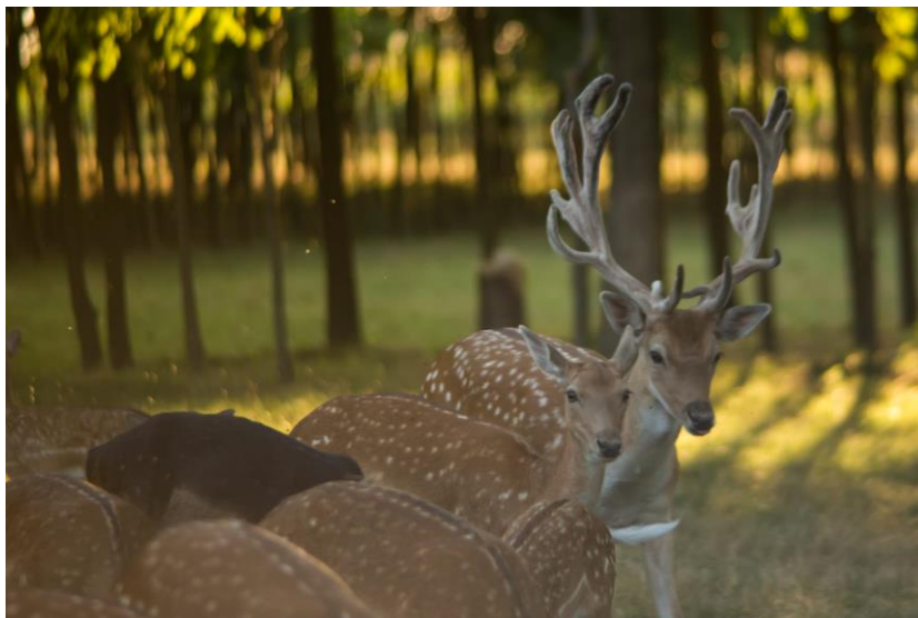
Slika 1. Ljetno krzno jelena lopatara i vidljivo odstupanje jedne jedinke tamnijeg krzna

Prema tjelesnom pokrovu jelen lopatar spada u dlakavu divljač, što znači da je prekriven dlakama. Zimska dlaka je jednolično sivo smeđa, po hrptu tamnija, a prema trbuhu svjetlija. Unutrašnja strana nogu, rep odozdo i zadnjica su bijeli. Ljetna dlaka je crvenkasto smeđa s tamnom prugom po leđima, a po tijelu se nalaze jasno vidljive bijele točke poredane duž hrpta i po rebrima. Unutarnja strana nogu, trbuh i zadnjica s unutrašnjom stranom repa su bijeli. Unutar krda postoje tamnije ili svjetlije jedinke, dok čak postoje i sasvim bijele jedinke ili sasvim smeđe jedinke. Uz to nerijetka pojava su i albino jedinke. Duž repa imaju crnu prugu koja je okružena svjetlijom dlakom. Zbog svojega krzna u prirodi je veoma neprimjetan (slika 1.).