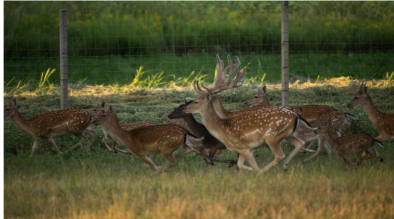
Slika 5. Kretanje jelena kasom

Kreću se hodom, skokom i kasom. Kao i druga jelenska divljač u povoljnim okolnostima može postići starost do 17 godina, što je rijedak slučaj. Pretežito obolijevaju od parazitskih bolesti, kod nas su to kožni štrk, metiljavost te helmintoze, a od prirodnih neprijatelja tu su vuk ( Canis lupus ), medvjed ( Ursidae ) i ris ( Lynx lynx ) koji su najuspješniji za zimskih dana kad je veliki snijeg čime je otežana pokretljivost jelenima (slika 5.)