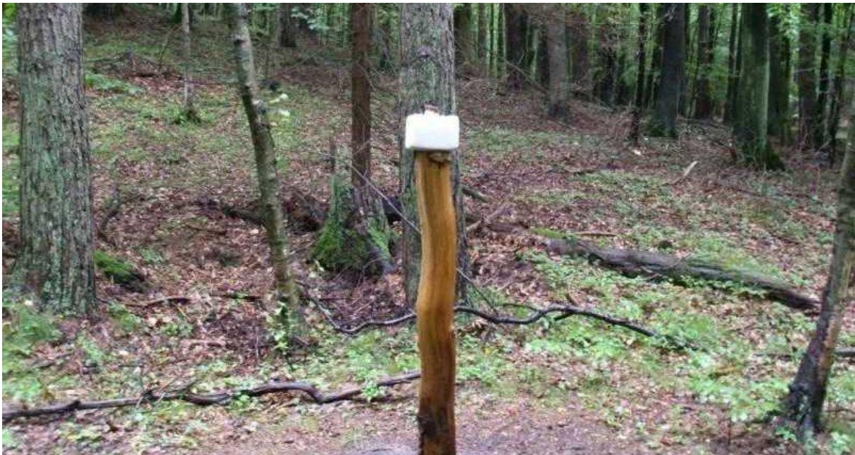
Slika 4. Postavljena kamena sol

Jelen lopatar hrani se raznovrsnim biljkama i usjevima, a može nanijeti i velike štete na šumskim nasadima. Pitku vodu lopatari nalaze u malim vodotocima, a dio žeđi utaže preko hrane. Uglavnom se hrane ispašom na pašnjacima na kojima borave, brste izbojke i pupoljke na drveću, šikari i grmlju, mladice iznikle iz zemlje ili izbojke i izdanke s panjeva. Uz to hrani se i šumskim plodovima kao što su žir, bukvice, kesten, šumsko voće te gljive. Na ispašu izlaze uglavnom u zoru ili sumrak, a preko dana se povuku u šumu. Na mjestima gdje nema ljudske opasnosti hrane se tijekom cijeloga dana. U slučaju kad opaze opasnost cijelo krdo počne bježati u skokovima koji mogu postići visinu i preko 1m. Nakon što opasnost prođe vraćaju se hrani. U uzgajalištima jelenima se često osim osiguranog brsta kao prihranu posebice u mjesecima prije bacanja rogovlja i razvijanja novih daju vitaminski čepići te voće kako bi mužjaci skupili dovoljno vitamina za razvitak što ljepšeg rogovlja. Uz to kao i sva ostala divljač, i jeleni lopatari zahtijevaju kamenu sol (slika 4.) (Janicki i sur., 2007.).