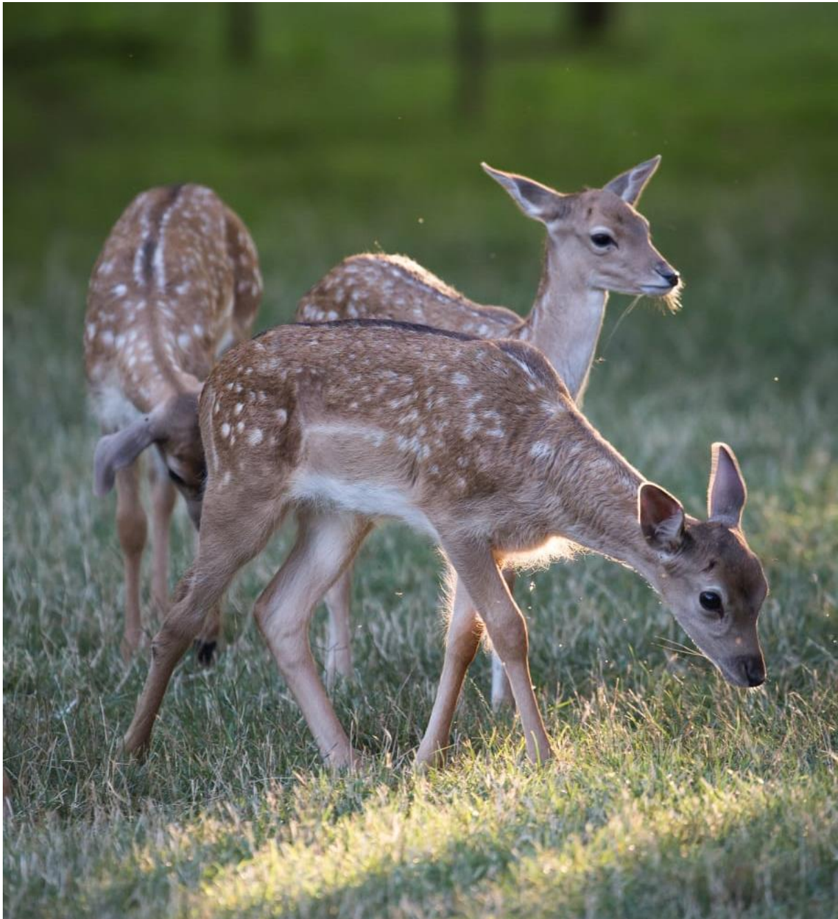
Slika 7. Telad stara dva mjeseca

Gravidnost traje 33 tjedna što je oko 7 i pol mjeseci pa je teljenje negdje krajem svibnja i početkom lipnja. Košute otele jedno tele, dok su blizanci jako rijetki (svega 11%). Masa teladi je oko 15 kg, a može biti i veća. U prva dva tjedna života tele ne može pratiti košutu pa ona ostavlja telad u logi. Najčešći problem kao i kod srna ( Capreolus capreolus ) je kada ljudi nađu tele pa ga diraju ili premještaju i na taj način na njima zaostaje ljudski miris pa ga košuta može odbaciti. Lopatari spolno sazriju sa dvije godine starosti (slika 7.) (Janicki i sur., 2007.).