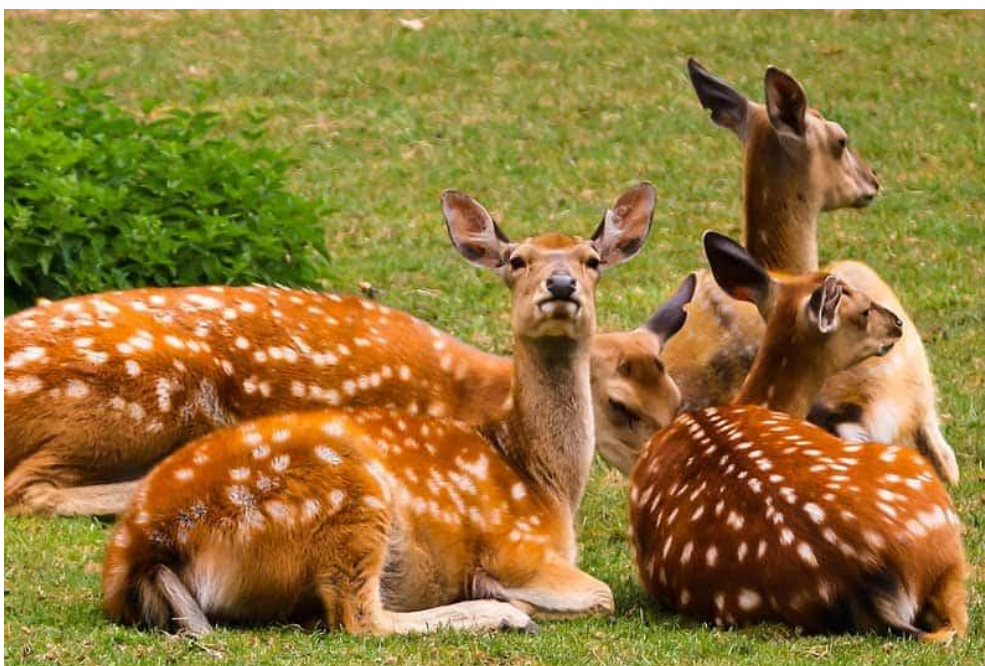
Slika 12. Košute na OPG-u Zvonko

Uzgajalište OPG-a Zvonko nalazi se u Golobradacu, osnovan je 2006. godine kada su na kupljenu parcelu ispušteno nekoliko jelena i srna. S vremenom se farma širila i posao je postao profitan. Danas ovo uzgajalište broji oko 60-ak grla jelena lopatara, uz to 30-ak jelena običnog i 10-ak muflona. Vlasnik ističe da potražnja i dalje premašuje uzgoj tako da nema problema s pronalaženjem kupaca. Divljač se prodaje živa za one koji ju žele držati u zatvorenim prostorima, pod odstrelom ili kao meso po restoranima ili proizvođačima suhomesnatih proizvoda. Uglavnom su kupci ljubitelji visokih trofeja koji divljač otkupljuju za trofeje, što je kako ističe najisplativije, dok su i Hrvatske šume kupci, a oni otkupljuju muflone i lopatare (slika 12.) (Bencaric, 2021.).