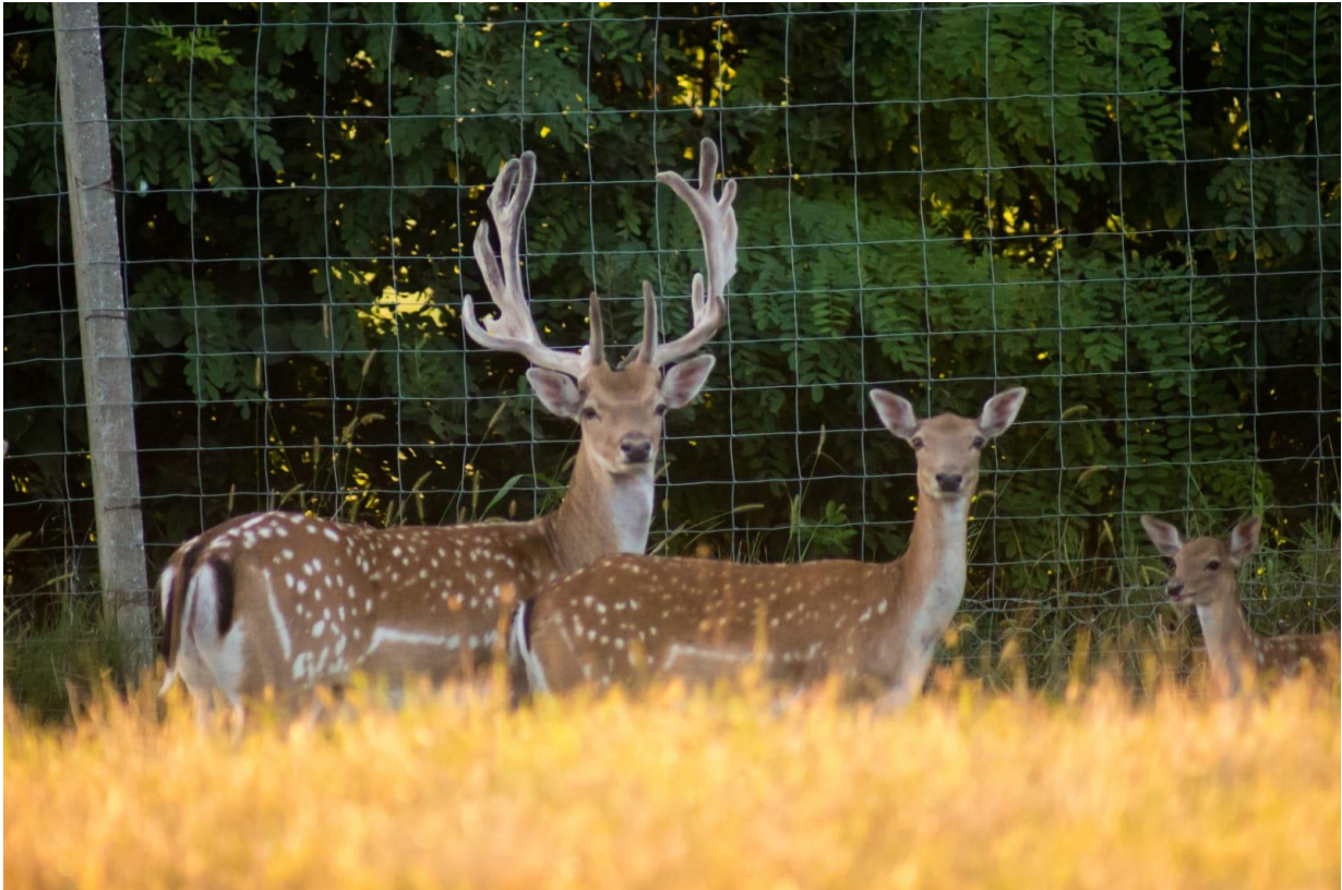
Slika 3. Mužjak, ženka i tele začuli su šum i provjeravaju moguću opasnost

Od osjetila najbolje im je razvijen njuh koji igra veliku ulogu u komunikaciji te u prikupljanju informacija iz prirode. Oči su smještene postrano na lubanji pa omogućavaju jelenu široko vidno polje, no one su astigmatične pa samim time lopatari dobro vide samo objekte u pokretu. Uši su im postavljene visoko na glavi skoro u vertikalnom položaju. Veličinom su gotovo dvostruko duže nego šire, a uške se mogu pomicati skupa ili neovisno za 180 stupnjeva naprijed ili nazad što omogućava jelenima da dobro čuju iz svih smjerova bez da se miču i na taj način privuku pažnju na sebe (slika 3.) (Janicki i sur., 2007.).