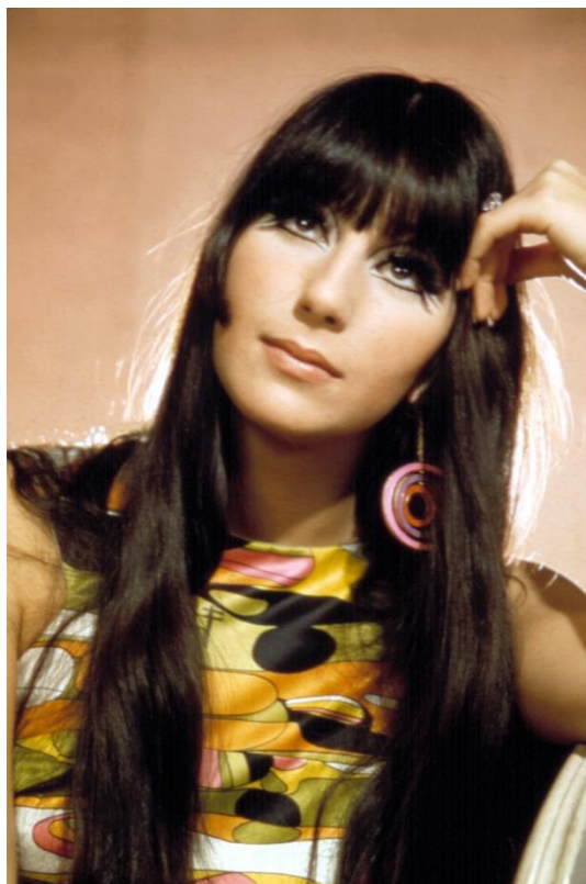
Slika 25. Pjevačica Cher u hipi odjeći geometrijskih uzoraka