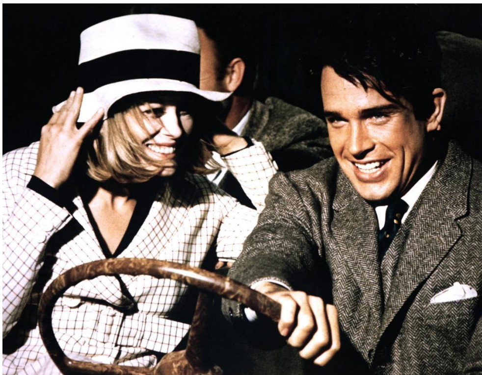
Slika 20. Isječak iz filma Bonnie i Clyde iz 1967. godine