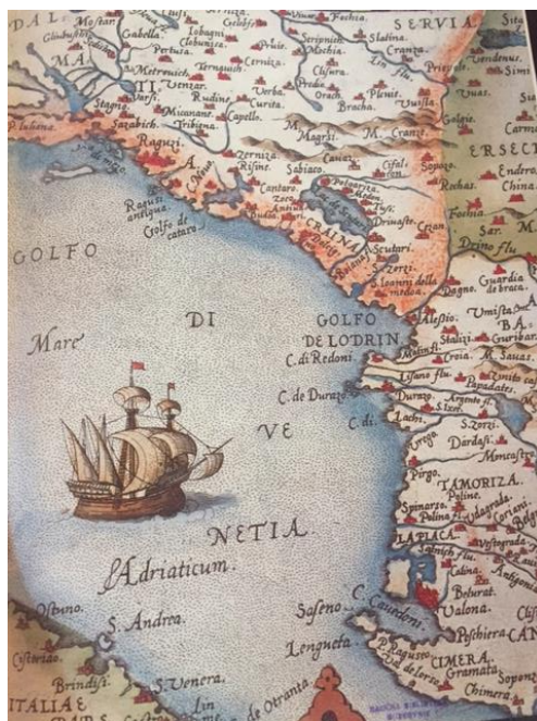
SLIKA 1 Karta južnog Jadrana, detalj

Poslije zadarskog mira 1358. zatvorili su sva vrata i otvore s morske strane. Već u 11. stoljeću podignuta je tvrđava Lovrijenac koja je kasnije dobila današnji oblik.