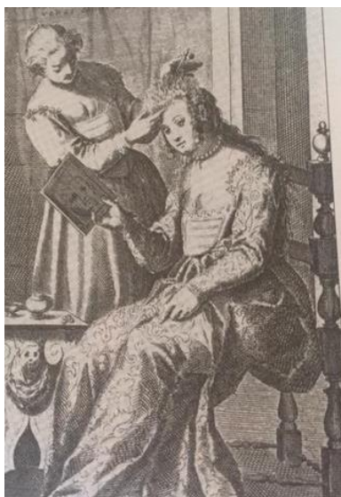
SLIKA 6 Prikaz iz dnevnog života grada