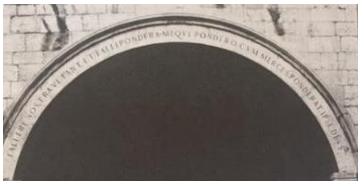
SLIKA 3 Natpis na zidu palače Sponza- Falleme nostra vetant et falli pondera meque pondero dum marces ponderat ipse Deus – Naši uetzi ne dopuštaju da varamo, niti da budeo prevareni, i dok ja važem robu, sam Bog važe mene

Trgovinom i pomorstvom sticali su Dubrovčani sredstva za svoj život i opstanak: politika Dubrovnika prema mnogim državama nužno je morala biti oportunistička, jer je malo koja država onoliko ovisila o stranom svijetu koliko Dubrovačka Republika. More je razvijalo u njima smijelost, ustrajnost i dalekovidnost, te su bili odvažni pomorci, dobro trgovci i spretni državnici. U borbi s orirodom i sa stranim svijetom Dubrovčani su ulagali sve svoje energije i pokazivali nevjerovatne društvene sposobnosti. U Republici je vladao red i javna sigurnost bila je zagantirana. Dubrovački arhiv nam pokazuje da nitko od Slovena, osim Čeha, nije imao toliko smisla za administraciju kao Dubrovnik. 2