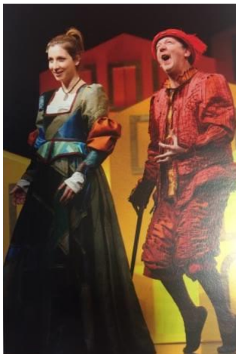
SLIKA 7: Marin Držić: Skup Hrvatsko Narodno Kazalište, Split 28.03.2008.