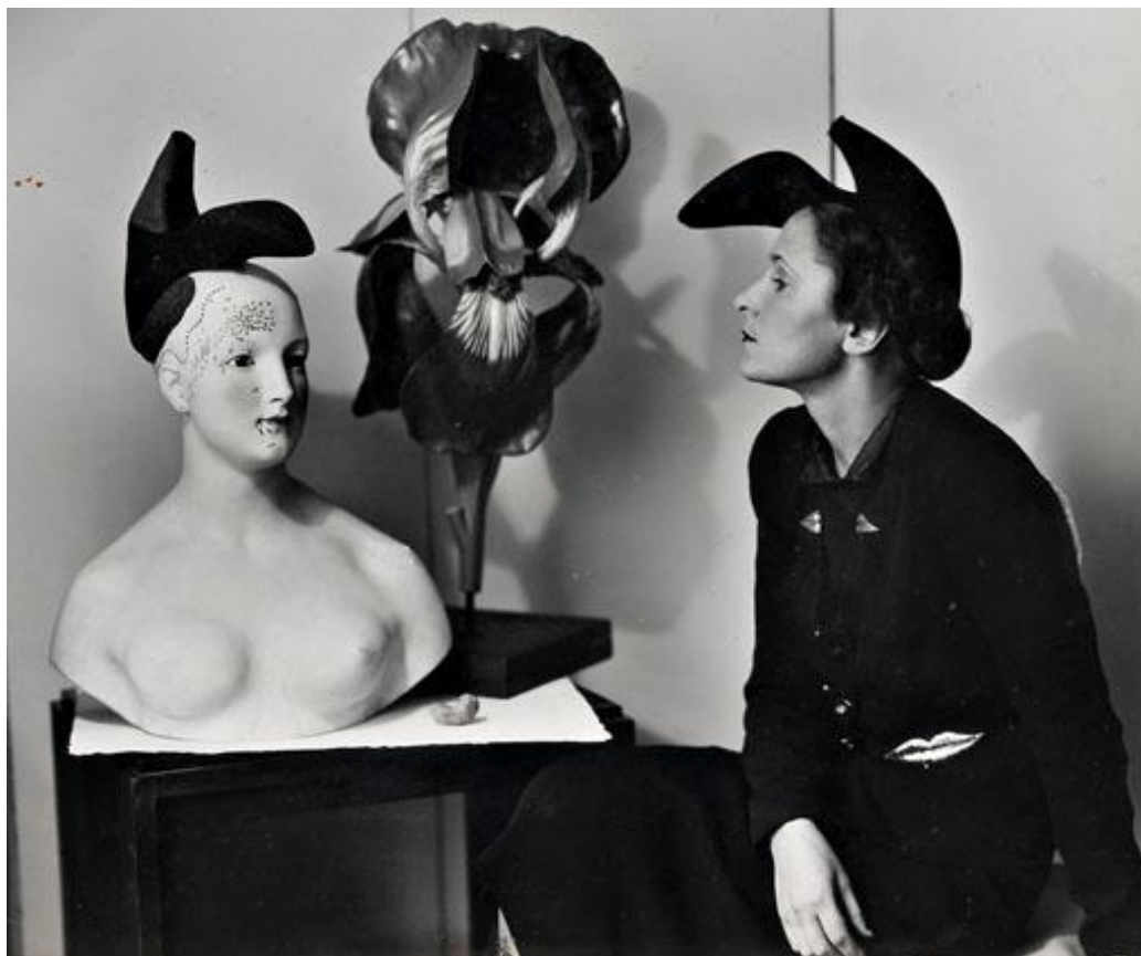
Slika 9. Elsa Schiaparelli i njen Shoe Hat

Nadrealistički utjecaj očitava se na još mnogo 'šokantnih' predmeta poput Shoe Hat-a ( Šešira cipele ) koji je proizašao iz suradnje s Dalijem. Postoje dvije verzije tog šešira: crni s crnom potpeticom i crni sa 'šokantno' ružičastom potpeticom – njenom bojom, koja postaje zaštitni simbol modne kuće Schiaparelli. (Slika 9) Ostali predmeti koji njen rad vežu s nadrealističkim utjecajem su: crne antilop rukavice s apliciranim crvenim zmijskim noktima (inspirirana Man Rayjom), torba u obliku telefona (inspirirana Dalijem), kapa u obliku mozga izrađena od valovitog ružičastog baršuna, gumbi u obliku kikirikija, lokota i papirnatih isječaka, raznobojne perike koordinirane s haljinama te tkanina dizajnirana tako da oponaša novinski print koji ispisuje Schiaparellinu vlastitu recenziju na nekoliko jezika. 77 Man Ray je u to vrijeme fotografirao za časopise Vogue i Harper's Bazaar pa su se tamo mogle pronaći i fotografije Schiaparellinih 'neobičnih' šešira. 78