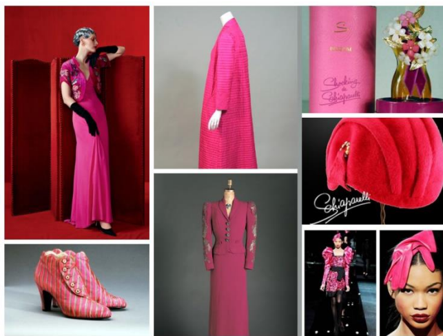
Slika 8. Shocking pink