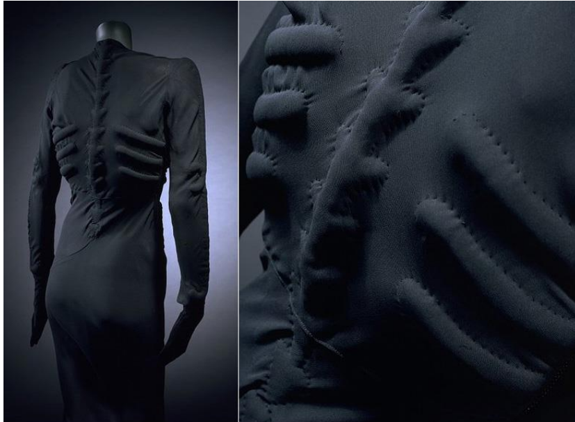
Slika 6. Skeleton haljina iz kolekcije Cirkus

Elsa je preminula 13. studenog 1973. u Parizu. Do danas je ostala cijenjena u modnim krugovima. Metropolitanski muzej u New York-u 2012. godine predstavio je njen rad zajedno s dizajnericom Miuccia-om Pradom.