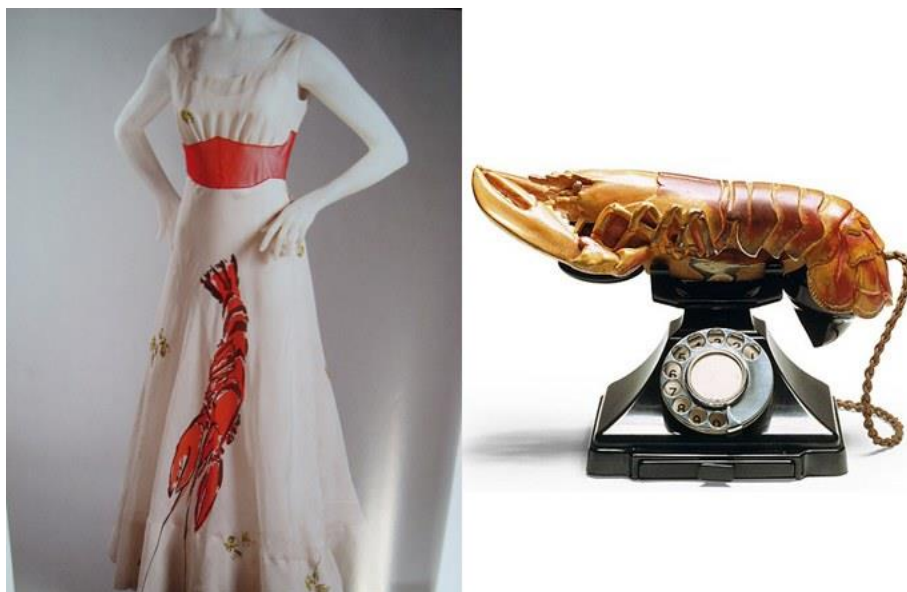
Slika 10. Jastog haljina i Dalijev Jastog telefon

U to vrijeme, pariškom visokom modom vladala je Coco Chanel koja je Elsu opisala kao talijansku umjetnicu koja izrađuje odjeću. Iako je nije smatrala prijetnjom jer je za nju Elsin odjeća isijavala nemoralnim i nekonvencionalnim stilom, nije mogla prekriti trag zavisti. Njihovi stilovi i dizajn u potpunosti su se razlikovali. Chanelin jednostavni, funkcionalni i elegantni stil naspram Elsinog kaotičnog i šokantnog bio je teže prepoznatljiv te je plijenio manje pažnje. Elsa nije nastojala ženi dati stil, glamur, eleganciju i ženstvenost jer je smatrala da ona to već posjeduje. Upravo zato svojim dizajnom želi privući pažnju, a veza s nadrealizmom joj u tome uvelike pomaže.