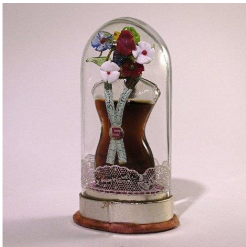
Slika 7. Parfem Shocking

uspjeh na američkom tržištu usprkos teškom poslijeratnom razdoblju. Pod utjecajem avangardnih pokreta, posebice nadrealizma, Elsa unosi veliku inovaciju u upotrebi materijala, iako njezin dizajn nikad nije bio pretjerano tehnološki napredan. Odlučivši se otvoriti svoj atelje u Place Vendôme u Parizu 1935. godine, u pomoć je pozvala svog prijatelja Salvadora Dalija koji joj je dizajnirao interijer. 75 Iste godine počinje s tematskim kolekcijama pod nazivom Stani, gledaj i slušaj ( Stop, Look and Listen ). Ubrzo nakon slijede: Glazbena kolekcija ( Music Collection ) iz 1937. godine, kolekcija Cirkus ( Circus Collection ) iz 1938., Pagan kolekcija iz iste godine te kolekcije Zodijak ili Sretne zvijezde ( Lucky Stars ) 1938/39. i kolekcija Moderna komedija ( Commedia dell'Arte ) za proljeće 1939. godine. Njezine revije nisu nalikovale klasičnom predstavljanju odjeće na modelima. Više su nalikovale nekakvom show-u ili predstavi. U svoje kreacije ugrađuje akrobacije, trikove, šale, glazbu i svjetlosne efekte koji cjelokupni dojam čine življim i dramatičnijim. Njezina odjeća i revije vrtjeli su se centrom visoke mode Pariza. (Slika 6.) To je ujedno i početak ozbiljne suradnje između mode i umjetnosti. Godine 1937. Elsa lansira parfem pod nazivom Shocking (Slika 7) u dizajnerskoj bočici u obliku staklenog torza s mjernom trakom oko vrata na koju je apliciran gumb sa slovom “S”. 76