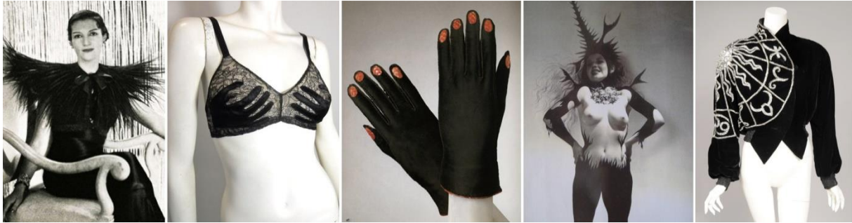
Slika 11. Kolaž Elsinih kreacija

Petersburgu, Floridi. 85 Sadržavala je poznate haljine visoke mode, nakit, slike, crteže predmeta, fotografije te nove dizajnovne Bertrada Guyona za Maison Schiaparelli. To je bila prva izložba posvećena kreativnom stvaralaštvu Else i Dalija koji su utjecali na Pariz i cijeli svijet svojim revolucionarnim vizijama.