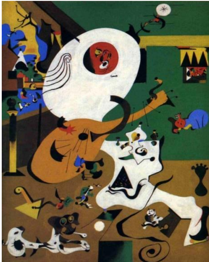
Slika 2. Joan Miro Dutch Interior

lika naslikana su slično čime je Miro namjerno pokazivao da su to živi likovi u njegovom slikarstvu. Interijer je obogaćen slikama. Na jednoj od slika je i prikaz vraga. Muškarac je postavljen leđima prema prozoru usredotočen na sadašnjost, na sviranje gitare, izdvajajući se od svijeta oko sebe. 27