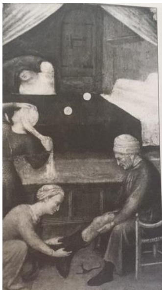
SLIKA 4 Iz dnevnog života grada

1664. dozvoljeno je plamkinjama čiji muževi nose plašt da mogu nositi na glavi vrpcu od svile, u ušima naušnice od zlata s dragim kamenjem i biserom, na vratu ogrlicu od zlata, biresa ili koralja. 10