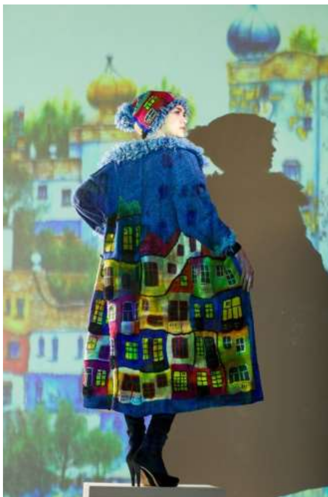
Slika 12. , Plavi Hundertwasserov štrikani mantil

Osobno smatram da bez obzira na pažnju i poštovanje koje uživa Hundertwasser to nije dovoljno. On zaslužuje puno više. Za primjer moramo spomenuti njegovu samostalnu izradu odjeće. Njegov stil je jedinstven i kao takav teško ga je kopirati bez da smo spremni prihvatiti kritike koje on sa sobom donosi. Te kritike bi trebale biti pokretač za mlade dizajnere kao što sam ja, jer on je bio zadovoljan svojim ja i nije mario toliko što drugi misle o njemu. Imao je sam svoj stil i znao ga je nositi. Na primjer njegove zgužvane košulje. Tko bi danas nosio zgužvanu košulju? Nitko, iako su svi svjesni da se košulja zgužva u sekundi. Tu opet pronalazim inspiraciju za kolekciju. Malo povećana košulja, dužih rukava, duboko plave boje, zgužvana. Zašto ne? Moda je tu da bi se njome poigrali, baš kao djeca koju u nama budi Hundertwasser svojim likovima.