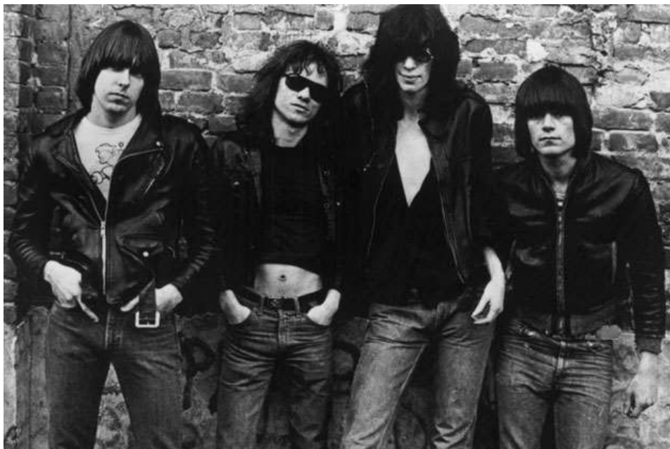
Slika 8.: Ramones, 1976.

Ni ne čudi što je upravo taj stil već desetljećima popularan kod ljubitelja rocka (pa i šire) s obzirom da su pored pomalo kostimiranog heavy metal stila i razuzdanog punk stila odabrali skromnost i jednostavnost ukazujući na kosu kao najveći ukras.