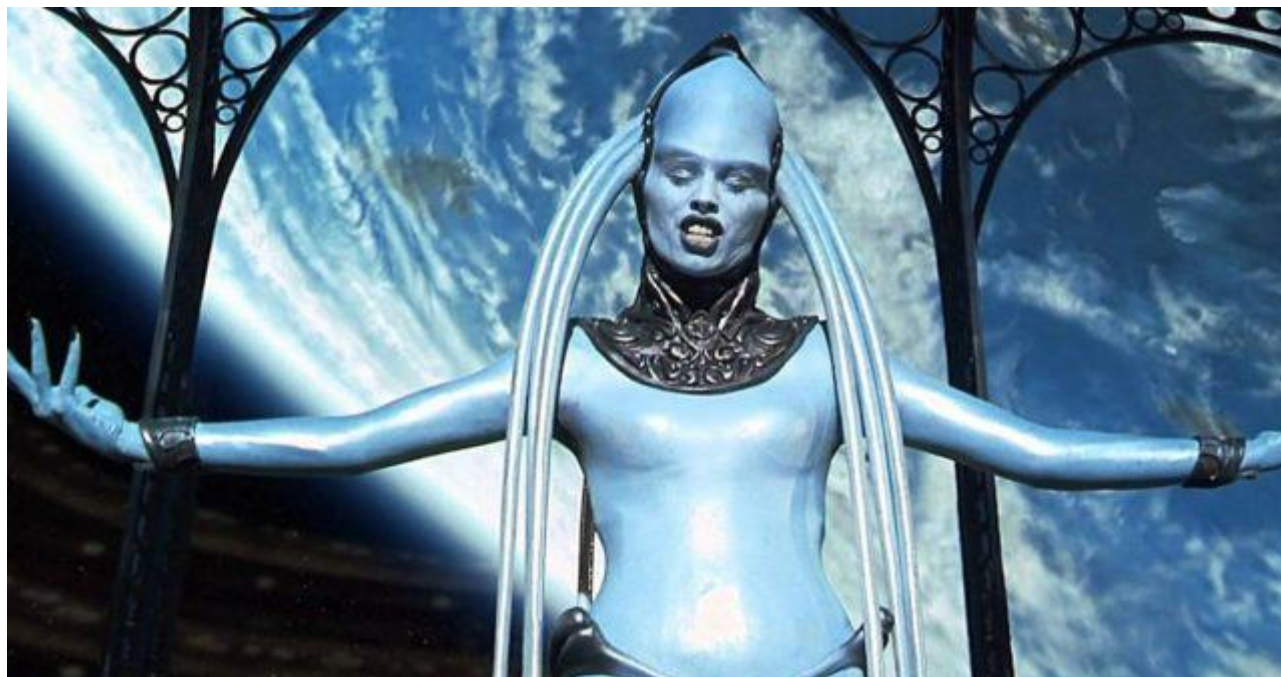
Slika 10. Plava laguna, izvedba opere

Diva Plava Laguna je poznata i cijenjena operna pjevačica u svemiru u 23. stoljeću. Ujedno ima presudnu ulogu glavnog kontakta Leeloo i skriva tajnu gdje se nalaze toliko traženi elementi. Nakon što je smještena u luksuznom hotelu u filmu je još jednom prisutna i to onda kada na kazališnoj sceni izvodi jedan od najtežih opernih izvedbi. Prema takvoj divi svi iskazuju veliko strahopoštovanje, a samim time što može izvesti neizvedive tonove zavrjeđuje još više poštovanja. Vrlo je povučen lik i ekspresivnost joj je vrlo niska, ali upravo u tom skrivenom iskazivanju svojih karakternih obilježja leži njena tajanstvenost. Nakon što ju rane Zorgovi plaćenici odlučuje samo Korbenu povjeriti elemente koje čuva u svojoj utrobi 36 . Maiwenn koja glumi divu utjelovila je njen lik no sam glas u opernoj ariji pripada Invi Mula, albanskoj pjevačici i ono što je karakteristično je činjenica da nitko nije vjerovao da će ona uspjeti otpjevati taj dio. Do danas je ostala poznata sopranistica kojoj je pjevanje za glazbeni dio u filmu donijelo veliku slavu i priznanje 37 . Što se tiče