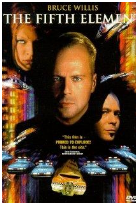
Slika 1. Poster za film „Peti element“, 1997. godina

nadrealnog i do tada nepoznatog. Pri tome se stvara fikcijski svijet koji je prilagođeniji spektaklu nego samoj činjenici da postoji i mora postojati radnja koja se prenosi publici. Pri tome se osmišljaju fiktivni likovi koji u svojoj prirodnoj okolini predstavljaju junaka radnje, ali upotpunjuje ih segment spektakularnosti kroz vizualni identitet što predstavljaju kostimografija i scenografija. Kinematografija od samih početaka nastoji se što više približiti spektaklu kao epskom sustavu prihvaćanja sedme umjetnosti koja je uslijed razvoja tehnologije dobila na izražaju upravo segment spektakularnog. Tijekom 50 - ih godina prošlog stoljeća kada se film razvija kao nova industrijska i umjetnička grana svoj uspon dobiva tijekom stvaranja hollywoodske scene koja ne ostavlja izbor da li je potreban spektakl da bi zaokupio publiku jer film je sam po sebi već postao spektakl i kao takav se razvijao 4 .