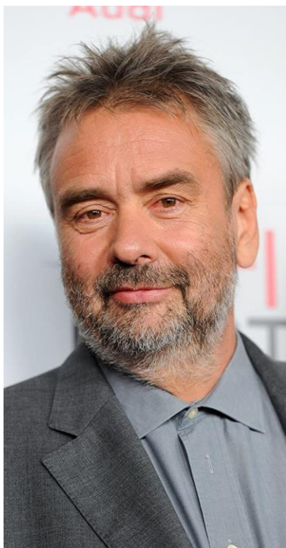
Slika 2. Luc Besson, francuski redatelj

Luc Besson je francuski redatelj, producent i scenarist rođen 1959. godine u Parizu. Uz roditelje koji su bili instruktori ronjenja zaljubio se u more i u mladosti je htio postati marinac no nakon nesreće u sedamnaestoj godini odlazi s Mediterana i vraća se u Pariz gdje razvija zainteresiranost za kinematografiju i film. Nakon što je odslužio vojsku s devetnaest godina odlazi u Hollywood gdje radi kao ispomoć u filmskim studijima. Povratkom u Francusku odlučuje se baviti filmskim stvaralaštvom pri čemu je u početku radio kao asistent na mnogobrojnim manje poznatim filmovima surađujući s Patrickom Grandperretom, Claudeom Faraldom, Mauricom Pialatom i drugima 7 . Godine 1980. napravio je svoj prvi film u crno bijeloj verziji „L'avant - dernier“ kao postapokaliptični film s elementima znanstvenofantastične drame te osvojio mnogobrojna priznanja i nagrade. To ga je potaknulo na daljnje filmsko stvaralaštvo. U naredne tri godine napravio je još dva filma i do 1983. godine se intenzivno počeo baviti filmom. Te godine izlazi njegov prvi veći film „Le Deriner Combat“, a dvije godine poslije „Subway“ crna komedija koja