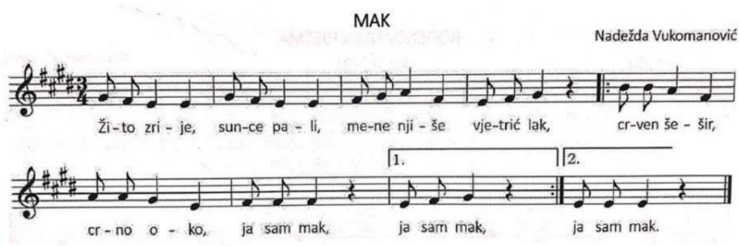
Slika 7: Pjesma "Mak" (Kraljić, 2017.)

Odgojitelj okupi djecu da stanu u krug te on počne pjevati pjesmu prvi puta. Kako djeca slušaju, tako spontano prikazuju ono što čuju. Mogu prikazivati žito zrije, sunce pali, vjetar kako njiše mak, gdje se nalazi šešir, kakvo je oko, i u konačnici mak.