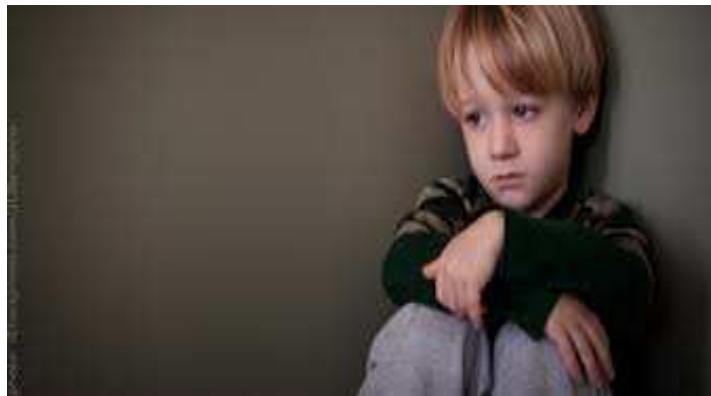
Slika 1. Depresivno dijete

Ukoliko se ovakva situacija ponavlja, dijete može imati osjećaj da je u potpunosti izgubilo kontrolu, te počinje očekivati samo negativne ishode, što uzrokuje pojavu depresivnosti i gubitka samopoštovanja. (Vulić-Prtorić i Cifrek-Kolarić, 2011, str. 132).