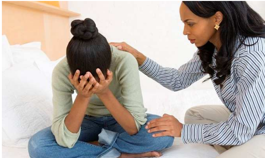
Slika 6. Roditeljska podrška depresivnom djetetu školske dobi

Djeci školske dobi škola predstavlja veći izazov od kuće. U školi se od djeteta očekuje da dnevno više sati sjedi mirno, usmjerava pažnju na nešto što mu je nametnuto, uči nove i ponekad teške lekcije i bude poslušno. U školi su postavljena jasna pravila i više ih je nego kod kuće. Kod neke djece takve okolnosti stvaraju tjeskobu u problemima s učenjem ili slijeđenjem pravila, tako npr. dijete koje je rado učilo, odjednom prestaje učiti ili dijete koje se ponašalo prilično disciplinirano postaje neposlušno. (Greenspan, 2002). Loš uspjeh u školi je još jedan simptom koji prati depresivnost djece i mladih. „Depresija ometa pamćenje i koncentraciju zbog čega je teže obraćati pozornost na nastavu i zapamtiti naučeno“ (Lebedina Mazoni, 2007, str. 64).