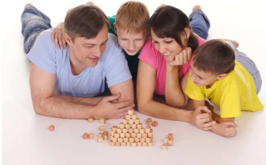
Slika 4. Zajednička igra roditelja i djece