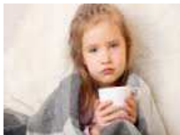
Slika 3. Depresija kod djece

Emocionalni simptomi koji ukazuju na depresivno ponašanje su: tužno, utučeno raspoloženje bez razloga, ljutnja, srdžba, razdražljivost, izljevi bijesa, osjećaj ispraznosti, nagle promjene raspoloženja, raspoloženje najgore ujutro, dosada, gubitak spontanosti, osjećaj beznađa, anksioznost i očekivanje negativnih ishoda, osjećaj krivnje i sl. simptomi.