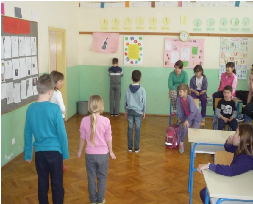
Slika 8. Igra Care, care gospodare