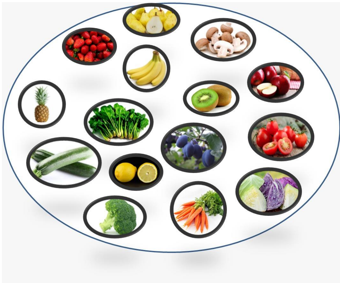
Slika 2. Zdrave namirnice

dječji rast i razvoj. Ona djeca koja prestaju jesti kada osjećaju da su siti, imaju veće šanse da jednog dana neće biti pretili. Znamo da nije lako dijete predškolske dobi maknuti od sokova i ostalih nezdravih tekućina, pa ako već dijete konzumira takve proizvode, dobro bi bilo znati koliko dnevno smije unijeti u svoj organizam, a da se pridržava nekih osnovnih nutrijenata. Dnevni unos voćnog soka u organizam trebao bi količinski obuhvatiti jednu šalicu, čaj, juha i sok od povrća jedna i pol šalica na dan, mlijeka bi trebali unijeti od dvije do tri šalice na dan isto kao i vode. Često se zapitamo je li naše dijete doista gladno ili jede zato jer se javljaju neki drugi osjećaji kao što su tuga, osjećaj usamljenosti, dosada. Ako povežemo osjećaj tuge sa glađu, ta će se veza teško prekinuti, i svaki puta kada će dijete biti tužno, ono će posezati za hranom. Djetetova tjelesna masa znatno će se povećavati, a osjećaj tuge i dalje će biti prisutan, a da se ustvari neće znati pravi razlog zbog kojeg dolazi do toga. Predškolsko dijete na dan jede tri obroka i dvije užine, pa će tako roditelj pokušati te obroke obogatiti sa što više hranjivih tvari.