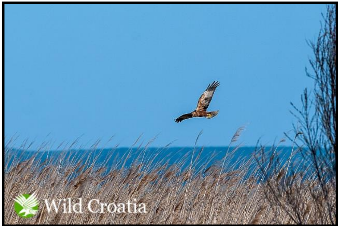
Slika 16. Eja močvarica u potrazi za hranom

Gnijezdi se u močvarama i šašu, na mjestima gdje ima hrane u blizini.