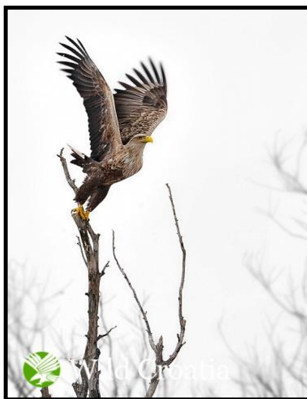
Slika 9. Orao štekavac