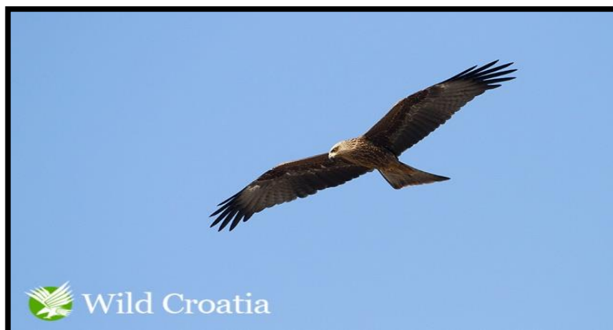
Slika 13. Crna lunja

Kod mladunaca boje nisu toliko izražene. Raznolikost hrane koju crna lunja konzumira ovisi o mjestu na kojem obitava i o godišnjem dobu. Najvažniji udio u prehrani čini strvina no hrane se i cijelim nizom živih organizama, kao što su kukci gmazovi, ptice i mali sisavci. U urbanim sredinama poznato je da crne lunje konzumiraju ostatke ljudske hrane i otpada. ( www.wildcroatia.net )