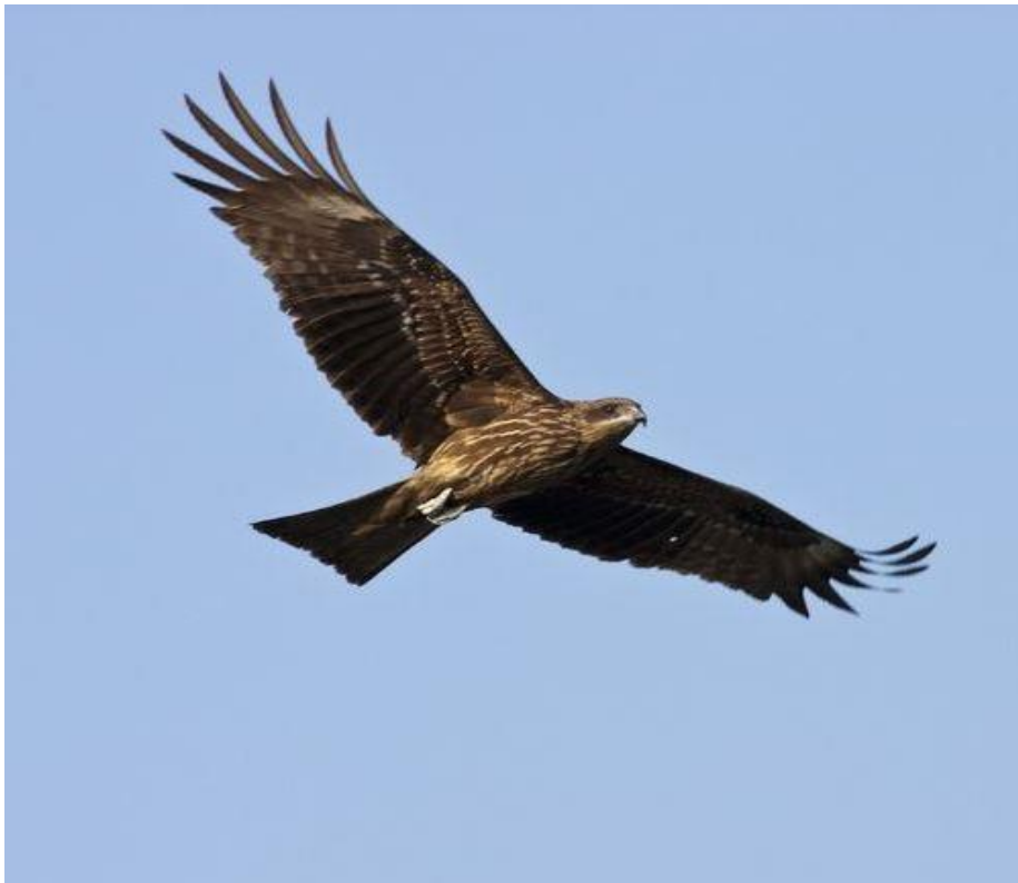
Slika 14. Crna lunja u letu

Crne lunje su vrlo socijalna vrsta ptica, posebice prilikom hranjenja. Poznato je da se hrane u jatima. Kao i prilikom parenja, hranjenje se može odvijati u parovima, no najčešće se formiraju u manje grupe. Kada se gnijezde u gradovima ili urbanim sredinama, gnijezda postavljaju blizu jedni drugima, na udaljenosti oko dva metra. Prilikom sezone parenja mužjaci se udvaraju ženkama na način da kruže prilikom letenja te lepršaju krilima. Najčešće gnijezda grade na granama drveća, vrhovima manjih gora i planina, te na ulazima napuštenih zgrada. Za izradu koriste lagane materijale kao što su grančice i krpe, nerijetko i plastiku. Najčešće legu dva do tri jaja na kojima ženka leži oko mjesec dana. Ptići su čučavci, ovisni o roditeljima. Perje dobivaju tek nakon 42- 56 dana, a neovisni postanu nakon 90-ak dana. (Radović i sur. 2003.)