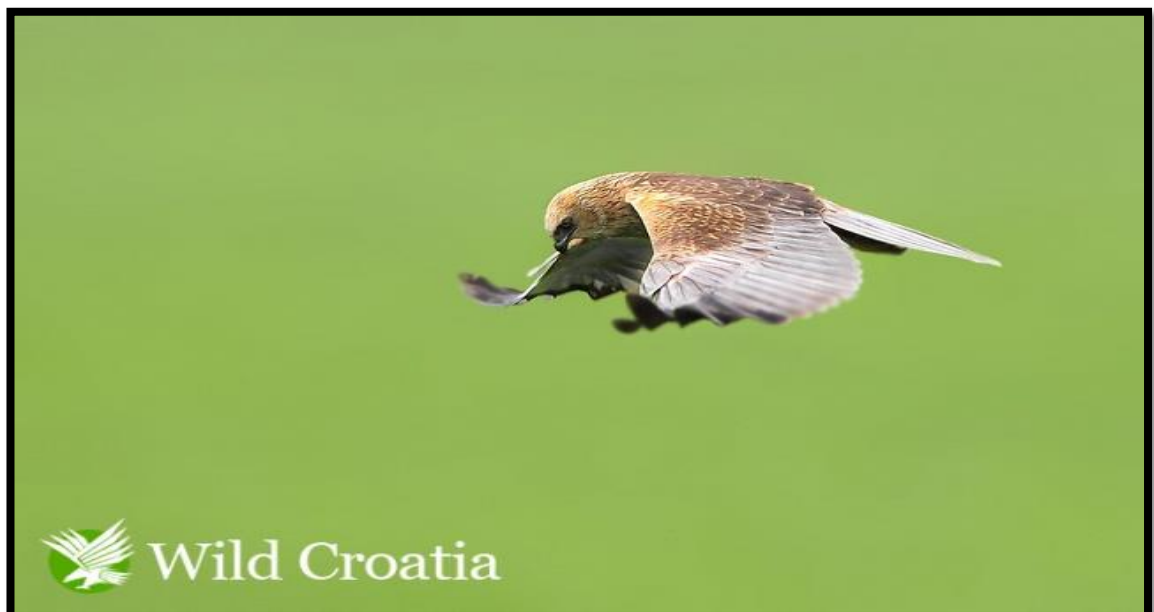
Slika 17. Eja močvarica lovi