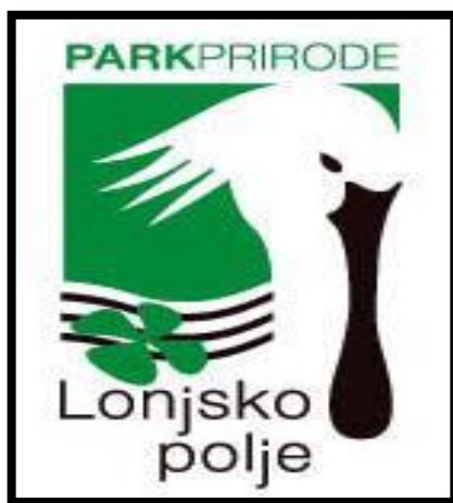
Slika 3. Logo Lonjskog polja

Posebice zaštićeni dijelovi prirode unutar Parka prirode Lonjsko polje su dva specijalna ornitološka rezervata: Krapje Đol i Rakita. Zahvaljujući njihovoj vrijednosti te značajnosti kao stanište brojnih populacija ptica, oba rezervata su stavljena pod zakonsku zaštitu čak i prije proglašenja Lonjskog polja Parkom prirode.