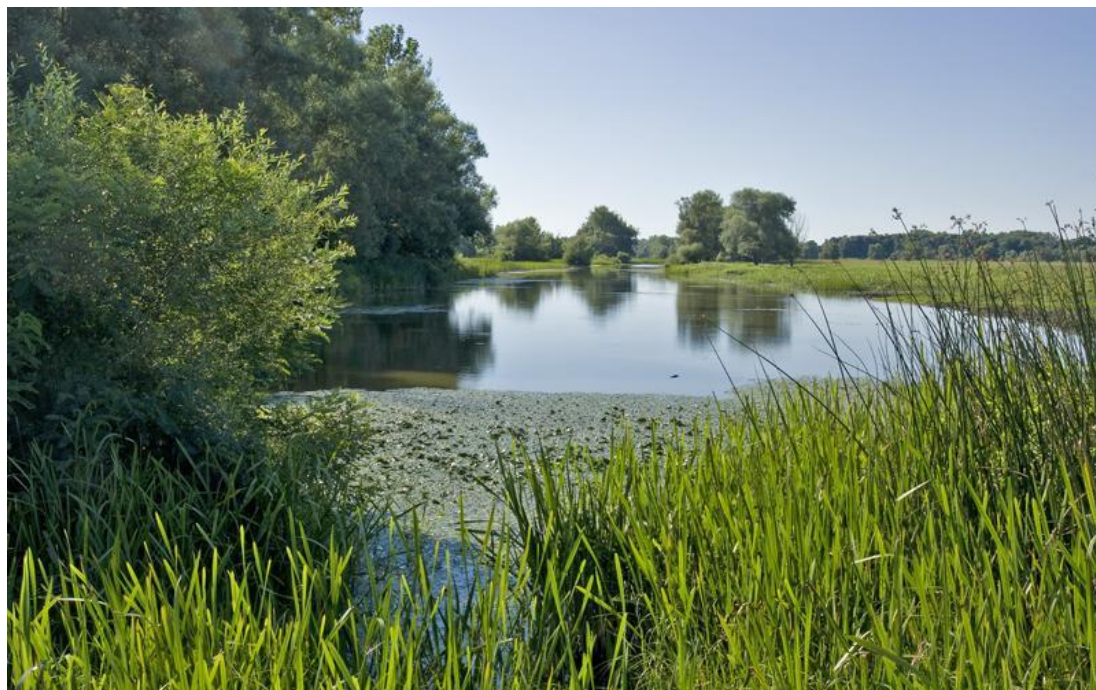
Slika 5. Močvarno područje ornitološkog rezervata Rakita

Prije velike zimske seobe ptica, na području rezervata okuplja se veliki broj divljih pataka. (Park prirode Lonjsko polje http://www.pp-lonjsko-polje.hr/ ).