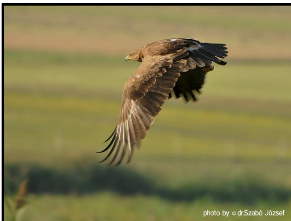
Slika 12. Orač Kliktaš u lovu