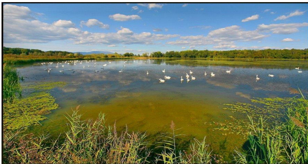
Slika 1. Ornitološki rezervat

Zavod za ornitologiju je znanstvena ustanova osnovana 1901. godine a bavi se sustavnim ekološkim, faunističkim i taksonomskim ornitološkim istraživanjima. Najveća je i najpotpunija ornitološka biblioteka u Hrvatskoj i okolici. Sadrži više od 3000 knjiga i 400 časopisa. Časopis Larus , koji izlazi jednom godišnje još od 1947. godine, objavljuje znanstvene radove, stručne članke, obavijesti i dr. Od velike je važnosti i zbirka ptičjih svlakova 1 i jaja. Zavod provodi i koordinira znanstveno prstenovanje u Hrvatskoj. Zaštita ptica, zaštita prirode općenito, znanstvena ornitološka edukacija, popularizacija ptica važne su djelatnosti koje provodi zavod. Hrvatsko ornitološko društvo utemeljeno 1993. godine, djeluje kao dobrovoljna, nezavisna, strukovna organizacija. Raznim projektima i akcijama, društvo održava i unapređuje raznolikost, rasprostranjenost i brojnost populacija ptičjih vrsta u Republici Hrvatskoj. Njihova zadaća je i unapređivanje zaštite ptica, njihovih staništa i općenito zaštite prirode. (Ornitologija hr http://www.ulika.net/1/ornitologija/ )