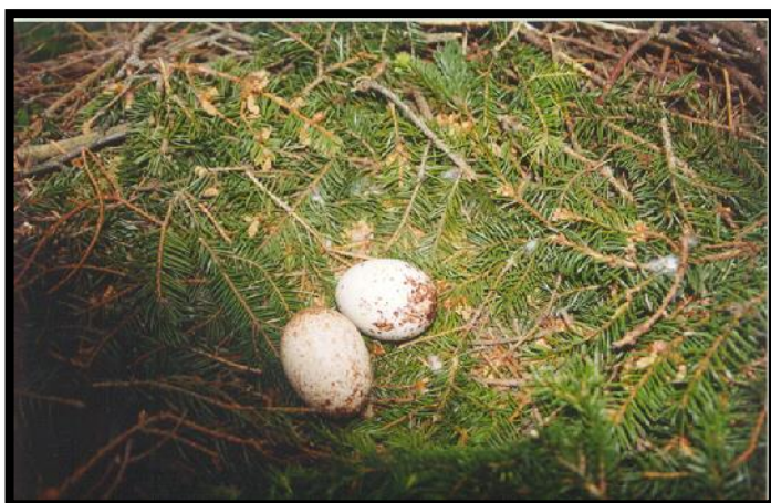
Slika 11. Gnijezdo Orla Kliktaša