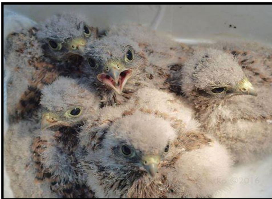
Slika 19. Ptići vjetruše