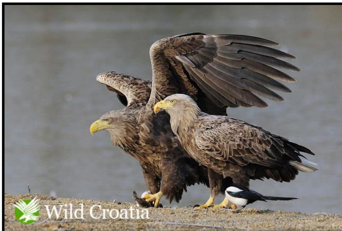
Slika 8. Skupljanje hrane za ptiće (Preuzeto iz: www.wildcroatia.net )