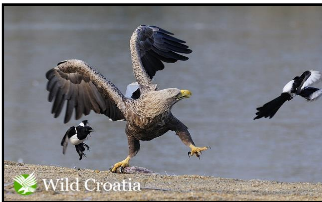
Slika 6. Orao štekavac brani uhvaćeni plijen

Orao štekavac ( Haliaeetus albicilla Linnaeus, 1758) ili bjelorepan spada u red jastrebovki ( Accipitriformes Newton 1979), u porodicu orlova. Optimalni životni vijek im je oko 36 godina. Rasponom krila od 2-2.5 metra i dužinom tijela od kljuna do repa između 70 i 90 cm najveći je orao grabežljivac u Europi. Ženke su obično nešto veće od mužjaka. Težak je u prosjeku 6 kg, no s obzirom na svoju veličinu, orao štekavac je zapravo vrlo lagan. Obično se zadržava uz jezera, rijeke i obalna područja, gdje se uglavnom hrani ribama, pticama močvaricama kao što su patke, gnjurci i čaplje te manjim sisavcima, kornjačama i zmijama. Njegovo najubojitije oružje nije kljun, već oštre kandže na nogama. Oštrim kandžama lako može uhvatiti plijen i odnijeti ga u gnijezdo. Zbog isušivanja vlažnih i vodenih područja, sječe šuma i krivolova, orao štekavac je ugrožena vrsta ptica u Hrvatskoj i cijeloj Europi, gdje je doveden gotovo do ruba istrebljenja. Zbog toga je i zakonom zaštićena vrsta u RH. Strogo je zaštićena zavičajna divlja svojta, kategorije ugroženosti: EN - ugrožena gnijezdeća populacija. Stručnjaci procjenjuju da u Hrvatskoj živi oko 150 parova, od čega u Lonjskom polju obitava oko 30 parova.