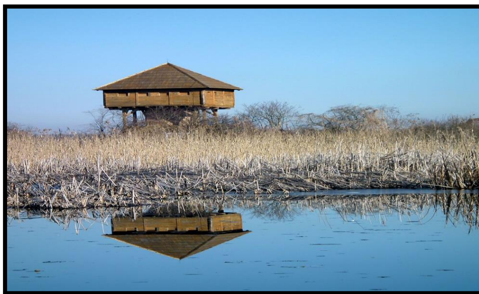
Slika 4. Promatračnica ptica - Krapje Đol, Lonjsko polje

Prema Zakonu o zaštiti prirode definicija posebnog rezervata prirode je sljedeća: “Posebni rezervat je područje u kojem je posebno izražen jedan ili više neizmijenjenih sastojaka prirode, a osobitog je znanstvenog značenja i namjene“. Ovo močvarno stanište okarakterizirano je gustom i raznolikom vegetacijom. Presudno je to za gniježđenje brojnih ptičjih vrsta, dok je za hranjenje istih presudna retencija Lonjsko polje. 2 (Ornitologija hr http://www.ulika.net/1/ornitologija/ )