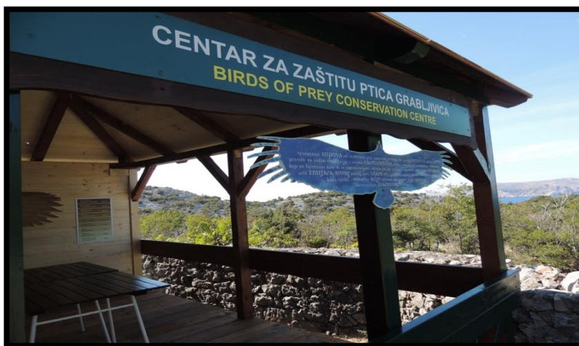
Slika 21. Centar za zaštitu ptica grabljivica

Ptice su danas jedna od najugroženijih skupina životinja. Zbog svoje izuzetne osjetljivosti na promjene okolišnih uvjeta, vrlo su dobar indikator 3 promjena koje se događaju u njihovim staništima. U Hrvatskoj je do danas zabilježeno 375 vrsta ptica, od toga 231 vrsta gnjezdarica, što je za europski prosjek veliki broj. Na području Lonjskog polja obitava 236 vrsta ptica, od čega su 134 vrste ptice gnjezdarice. Za europske i svjetske razmjere ovako velika zastupljenost ptica na relativno malom prostoru od 506 km 2 daje sliku vrlo bogate ornitofaune. Lonjsko polje je važno gnjezdilište (za neke vrste u Europi i posljednje), prezimljavalište i obitavalište brojnih ptičjih vrsta. Od vrsta koje obitavaju na području Parka, 113 vrsta ptica su ugrožene na nacionalnom nivou, 79 vrsta je ugroženo na Europskom nivou, 227 vrsta je zaštićeno Zakonom o zaštiti prirode Republike Hrvatske, dok su 133 vrste zaštićene međunarodnim konvencijama (Bernska, Bonska, Wild Birds Directive) (Radović i sur. 2003.).