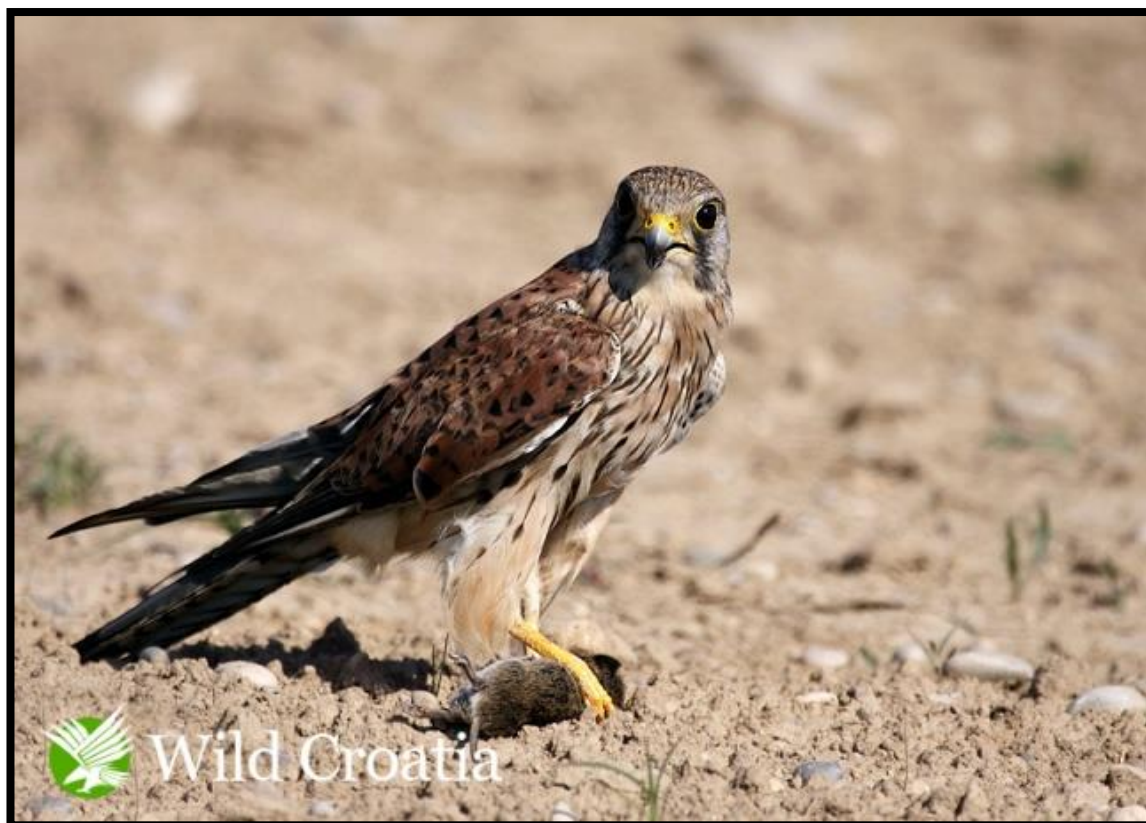
Slika 18. Vjetruša

Vjetruša ( Falco tinnunculus Linnaeus 1758) grabljivica crvenosmeđe boje s crnim pjegama pripada porodici sokolova. Mužjak je sive glave i crvenosmeđih leđa s nešto tamnih mrlja na truhu, dok ženka ima tamnija leđa. Jedna je od najrasprostranjenih vrsta ptica u Hrvatskoj. (Park prirode Lonjsko polje http://www.pp-lonjsko-polje.hr/ )