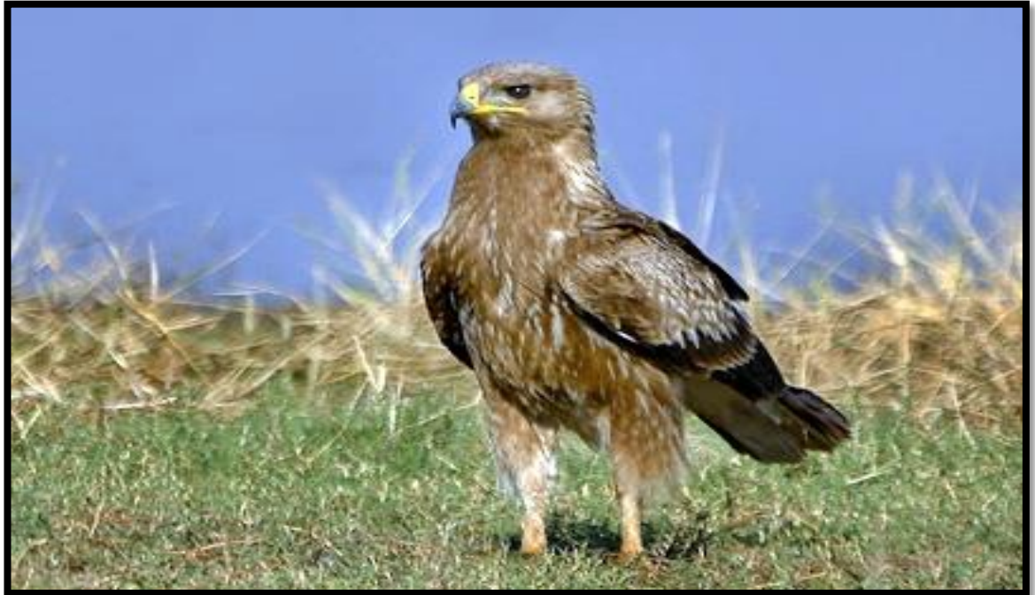
Slika 10. Orao kliktaš

Orao kliktaš ( Aquila pomarina Sibley and Monroe 1990), grabljivica je dužine od 55 do 66 cm, raspona krila od 135 do 155 cm, a tjelesne mase oko 1,5 kilogram. Ženke su uvijek nešto krupnije od mužjaka.