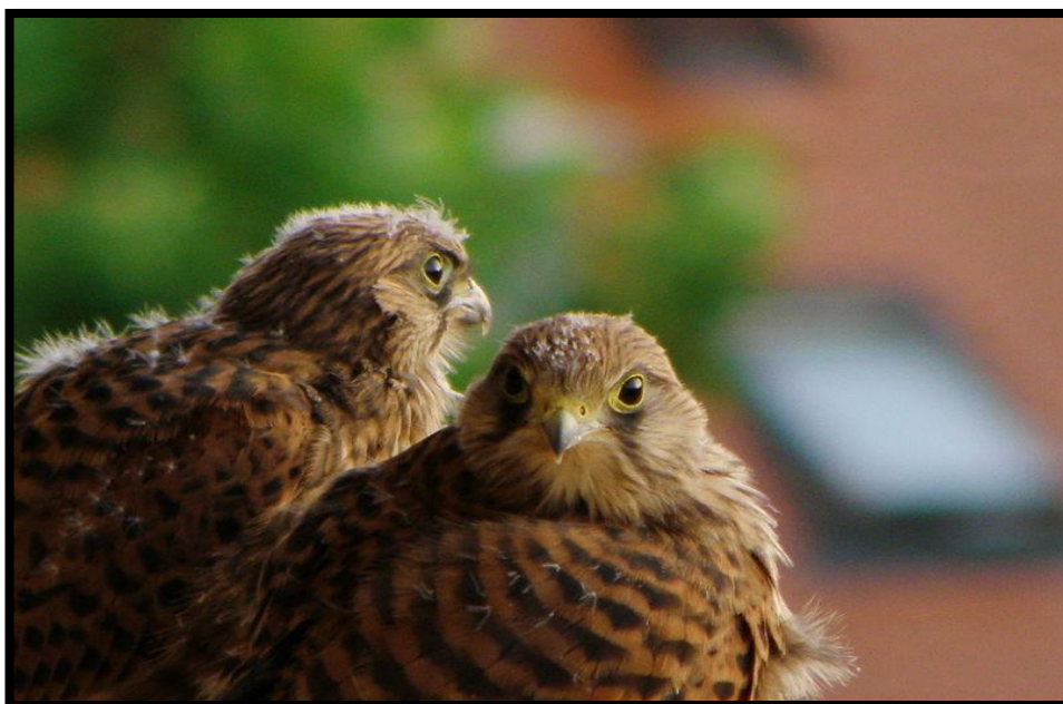
Slika 20. Mlade vjetruše