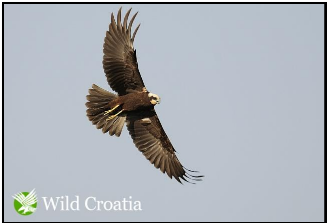
Slika 15. Eja močvarica

Eja močvarica ( Circus aeruginosus Linnaeus, 1758) je jedna od većih ptica grabljivica, zbog čega se i hrani čitavim nizom ranih organizama: manjim pticama, ribama, patkama, miševima, krticama, štakorima pa čak i manjim lisicama. Tijekom sezone razmnožavanja područje lova ove vrste je smanjeno te je njena prehrana usmjerena na močvarne ptice i male sisavce koje je lako uhvatiti. Eja močvarica lovi iz zasjede i ne oslanja se na brzinu.