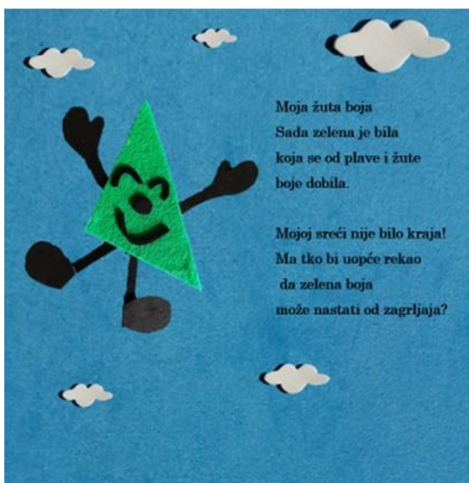
Slika 15. Trinaesta stranica autorske slikovnice „Mali trokut velikih prijatelja“

Moja žuta boja Sada zelena je bila koja se od plave i žute boje dobila.