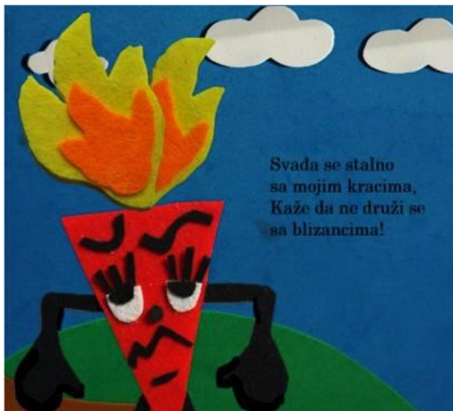
Slika 8. Šesta stranica autorske slikovnice „Mali trokut velikih prijatelja“