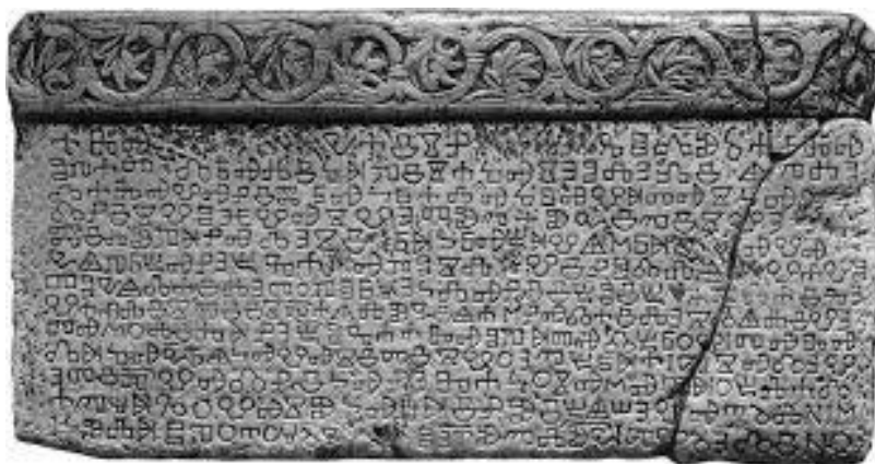
slika 1. Baščanska ploča