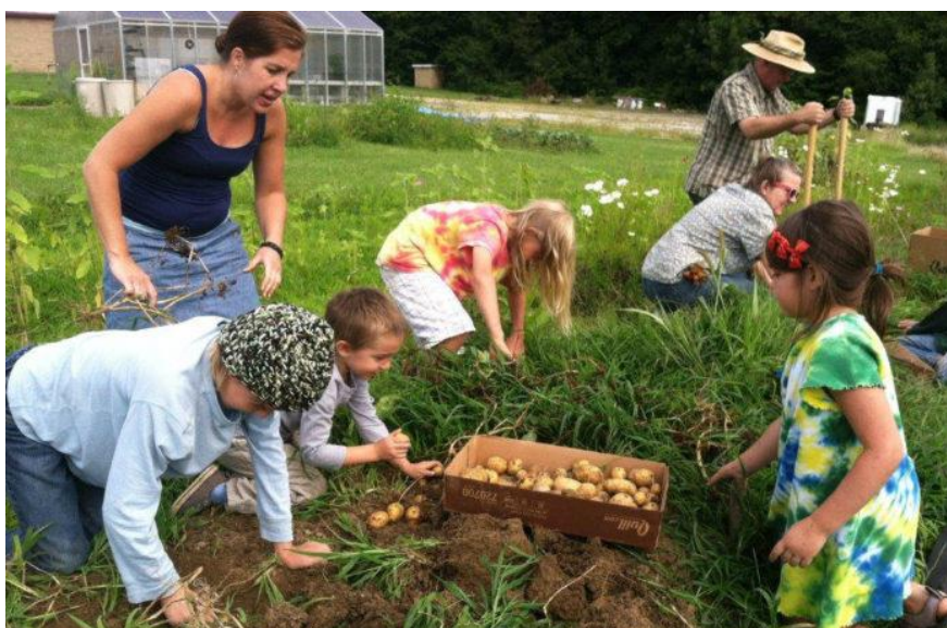
Slika 7. Rad u vrtu 10

Životno-praktične aktivnosti nazivamo još i radnim aktivnostima. U waldorfskim vrtićima one su za dijete od velike vrijednosti i zauzimaju bitno mjesto u svakodnevici i dnevnim ritmovima. Djeca uče po modelu odraslih i na taj način po uzoru odgojiteljice uključuju se u razne životne, svakodnevne aktivnosti. Radne aktivnosti kod djeteta razvijaju empatiju, samopouzdanje i dijete izrasta u odgovornu osobu. U životno-praktične, radne aktivnosti spadaju aktivnosti poput pospremanja i izrade igračaka, pranja lutkine odjeće, vješanje i sušenje iste, održavanja osobne higijene, priprema zimnice, priprema kolača, kruha i obavljanja ostalih kućanskih poslova u koje uvrštavamo peglanje, kuhanje, rezanje, šivanje. Razvoj zdravih i pozitivnih navika kod djeteta od najranije dobi rezultira kasnije većom samostalnošću i odgovornošću prilikom obavljanja određenih aktivnosti. Životno-praktične aktivnosti javljaju se i izvan prostorija odgojne skupine. Rad u vrtu iziskuje poseban trud i napor kako bi plodovi kasnije bili ukusni. Tako djeca sudjeluju u prekopavanju vrta, sadenju novih biljaka, brizi o biljkama, a i životinjama koje se nalaze u vrtu. Briga o živim bićima kod djece budi svijest o uvažavanju i zadovoljavanju potreba drugih, o odgovornosti koja se preuzima kako bi ono moglo preživjeti. Sve nabrojene aktivnosti u konačnici pridonose razvitku emocionalno zdrave i intelektualne djece.