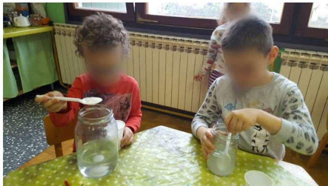
Slika 4. Miješanje soli i vode

Obzirom da je kontinent Antarktika zemlja leda i snijega, provedeni su pokusi u skladu s tim spoznajama. Promatrana su stanja vode u prirodi; tekuće, kruto i plinovito. U krutom stanju voda se može naći u obliku snijega i leda. Promatrano je koliki volumen posude zauzme voda kada je u tekućem stanju ili krutom. Potom je proveden pokus u kojem se promatrao proces kristalizacije. U suradnji s roditeljima, djeca su donijela staklenke. Svako je dijete napunilo svoju staklenku toplom vodom i dodavalo sol sve dok nije napravljena “zasićena otopina”. Djeci je bio posebno zanimljiv pojam, roditeljima su objašnjavali što je to i kako ona nastaje. Miješanjem i promatranjem postupka otapanja soli u vodi, djeca su postigla veliki stupanj koncentracije.