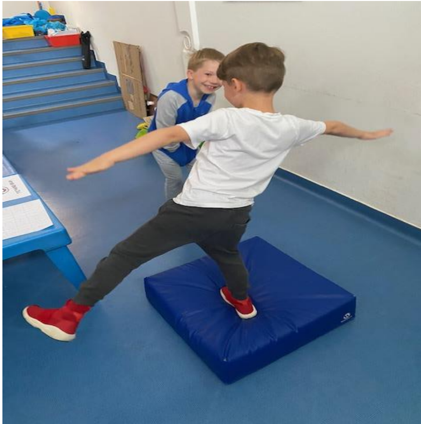
Slika 5. – Stajanje na kocki na jednoj nozi

drugu nogu na podlogu ili kada protekne vrijeme od 30 sekundi. Test se ponavlja 3 puta. Ispitanik stoji pored i mjeri vrijeme u desetinkama te upisuje sva tri rezultata.