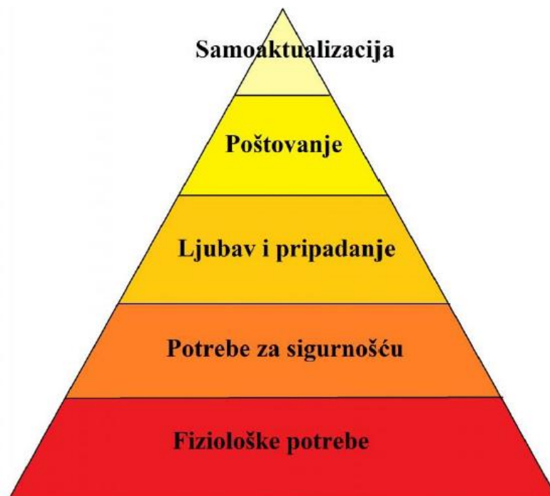
Slika 3. Maslowljeva hijerarhija motiva (Bosnar, Balent,2009; prema Busija, 2019: 17).

Naime taj proces uvelike omogućava pojedincu mogućnost velikog uspjeha u sportu. Primjerice čest slučaj je da djeca posjeduju potrebna znanja, vještine i sposobnosti, no iz nekog razloga nisu dovoljno motivirana te ne uspijevaju dostići određeni mogući uspjeh (Busija, 2019). Dakle, važan zaključak jest da bez motivacije vrlo često nema ni daljnjeg bavljenja sportom ili nema nikakvih sportskih uspjeha iako su ona moguća. Naime motivacija je vrlo složen proces te postoji mnogo teorija o njoj. Busija (2019) navodi Maslowljevu hijerarhijsku teoriju motivacije. Prema toj teoriji svaki pojedinac ima određene ciljeve koje želi postići, a ostvarenje tih ciljeva pojedinac doživljava kao nagradu, dok nemogućnost ostvarenja kao frustraciju i kaznu. Naime motivi su hijerarhijski organizirani, od nižih (primarnih, bioloških) ka višima (psihološkim i socijalnim) (Bosnar, Balent, 2009; prema Busija, 2019). Prema istim autorima postoji 5 motiva pojedinac treba redom zadovoljavati kako bi uspio ostvariti motiv iznad.