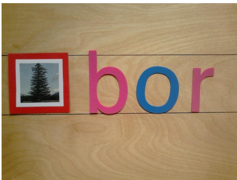
Slika 8. Pisanje pomoću pomične abecede i kartice sa slikama