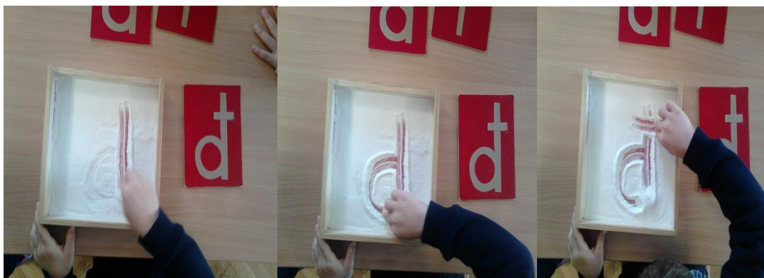
Slika 7. Nakon hrapavih slova dječak upisuje slovo đ u pijesku