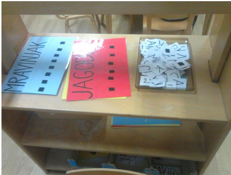
Slika 2. Metodički artefakti za razvoj početne pismenosti