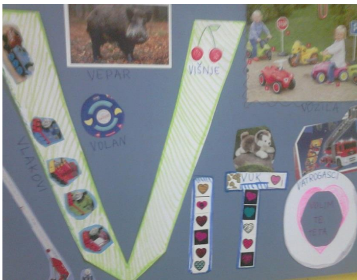
Slika 3. Ime dječaka koje je sam ukrasio