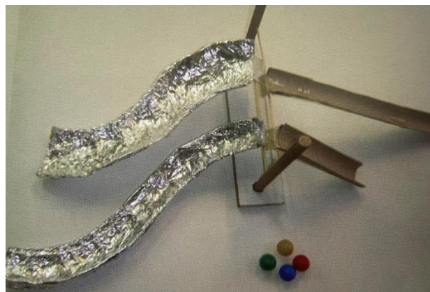
Slika 4. Dvostruki tobogan (Slunjski 2006)

Spoznajni razvoj: razvoj taktilne i vizualne percepcije; razvoj prostorne percepcije (pokreti loptice u prostoru); stjecanje iskustva i spoznaja u predmetnoj sredini (vođenje zapažanja, nova iskustva); stjecanje iskustva istraživanjem odnosa i veza među predmetima; stjecanje iskustva o uzročno – posljedičnim vezama; razvoj pozornosti.