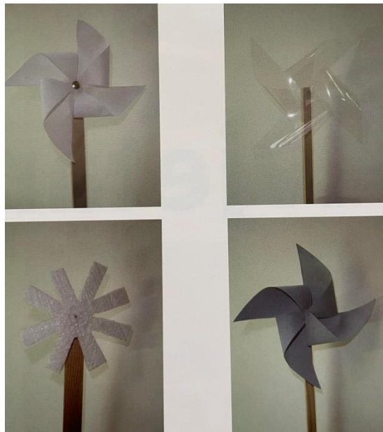
Slika 6. Vjetrenjače (Slunjski, 2006)

Spoznajni razvoj: razvoj taktilne, vizualne i prostorne percepcije; stjecanje iskustava o prirodnoj sredini (vjetar); stjecanje iskustava o uzročno – posljedičnim vezama; razvoj pozornosti; razvoj operativnog mišljenja, razvoj sposobnosti rješavanja problema