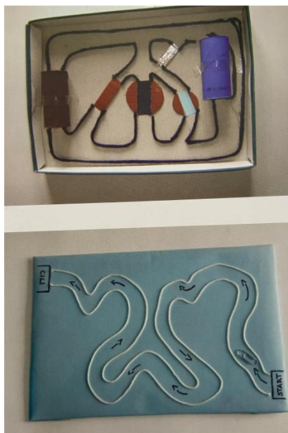
Slika 7. Magnetni labirint (Slunjski, 2006)

Stalna dodavanja novih predmeta i samoinicijativno donošenje novih predmeta čiju mogućnost privlačenja djeca žele provjeriti te poticajnim odgojno – obrazovnim aktivnostima, potaknut će istraživanje te će omogućiti sređivanje, grupiranje i verbalizaciju iskustava o tome koje materijale magnet privlači, koji od njih sami stječu magnetizam, a koji to ne mogu (Došen Dobud, 2018).