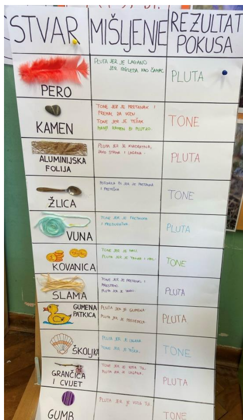
Slika 1. Aktivnost pluta - tone, DV Zvončić

Na sljedećoj je slici prikazan rezultat provedene aktivnosti pluta – tone, u DV Zvončić, u mješovitoj skupini. Djeca su prije provedenog eksperimenta iskazivala svoja mišljenja o tome hoće li što plutati ili tonuti.