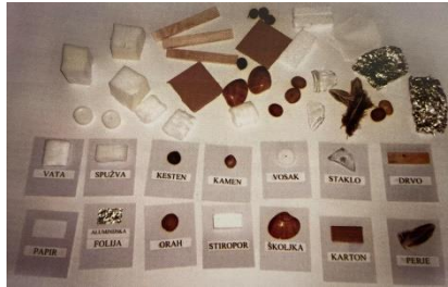
Slika 2. Primjer materijala (Slunjski, 2006)

Spoznajni razvoj: razvoj sposobnosti uočavanja veza i odnosa među stvarima i pojavama – shvaćanje prirodnih pojava (promjena u prirodi); razvoj sposobnosti rješavanja problema – uočavanje problema, kombiniranje različitih iskustava, stvaranje pretpostavki, traženje rješenja, otkrivanje zakonitosti (razmišljanje o tome hoće li nešto plutati ili tonuti u vodi, zašto će plutati, odnosno tonuti...)