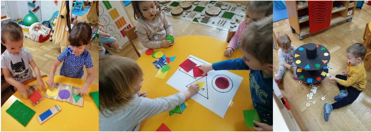
Slika 15. Aktivnosti poticanja fine motorike