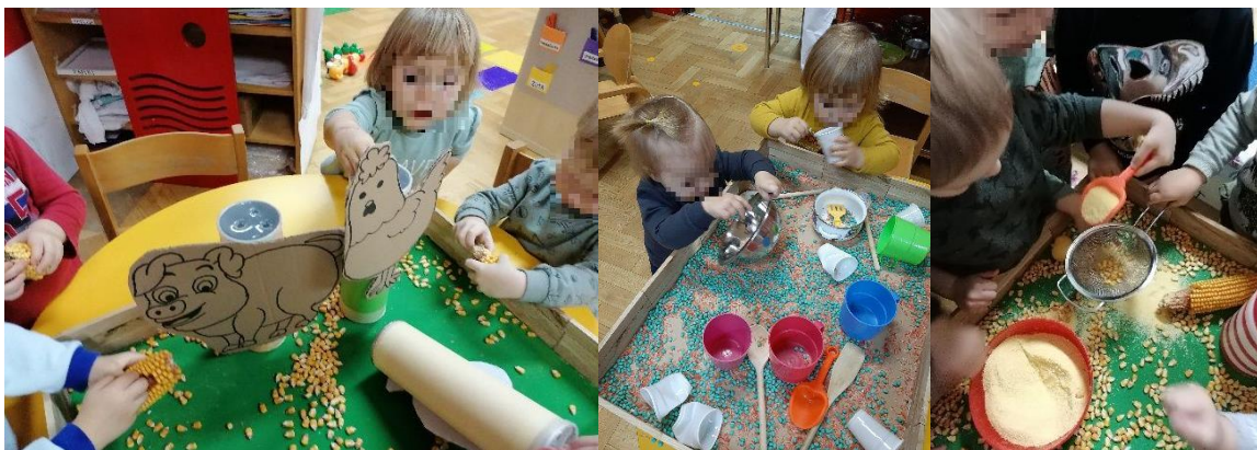
Slika 7. Igra istraživanja rastresitog materijala

Svoja prva iskustva istraživanja i opažanja svijeta dijete dobiva putem osjetilnih podražaja stoga je igra i učenje putem istraživanja rastresitih materijala od velike važnosti. Osim taktilnog iskustva, dijete korištenjem raznih alata pokušajima punjenja i pražnjenja posuda rješava probleme poput, na koji način i kojim alatom napuniti posudu, koliko je količine potrebno da bi se pojedina posuda napunila kao i radost promatranja materijala koji klizi niz kosinu. U skupini Cipelići rastresiti materijali ponuđeni su u sklopu teme farma te je velikim dječjim interesom postao svakodnevni materijal u skupini, a praćenjem dječjeg interes postepeno se centar i nadograđivalo (Slika 7).