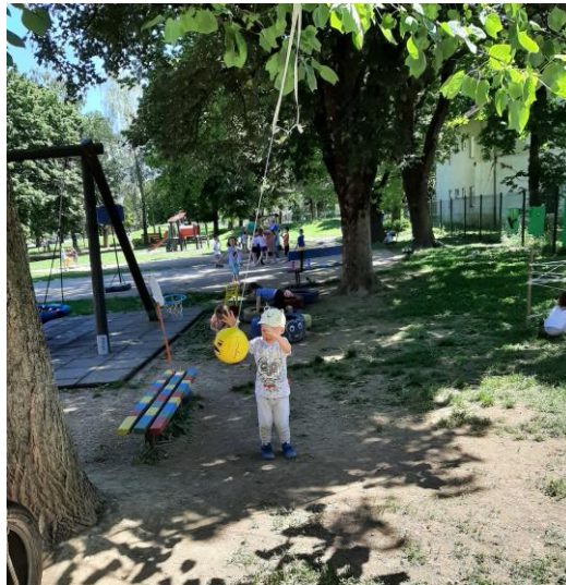
Slika 19. Igra fiksiranom loptom

Neki od poželjnih centara, koje navode Hansen i suradnici (2001), svakako je prostor za igru pijeskom kojeg su odgojitelji osmislili u suradnji s roditeljima koji su doprinijeli nabavom gume i pijeska te prostor za vožnju (Slika 20).