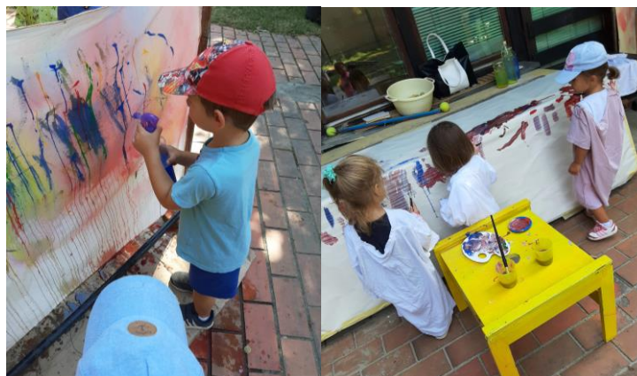
Slika 22. Likovne aktivnosti u mirnom prostoru

Upravo prostor za mirne aktivnosti Hansen i suradnici (2001), osim za odmor, predviđaju i za aktivnosti koje se mogu spojiti s aktivnostima iz SDB. Promatrajući dječji interes i vodeći se spomenutim smjericama, odgojiteljice nadograđuju postojeće stanje poticajima za istraživanje transparentnosti, geometrijskih oblika te boja (Slika 23), poštujući interese djece iz susjedne skupine s kojima dijele vanjski prostor. Spomenuti prostor, s obzirom na blizinu sanitarnog čvora, odgojiteljice koriste i za organiziranje raznih likovnih aktivnosti (Slika 22).