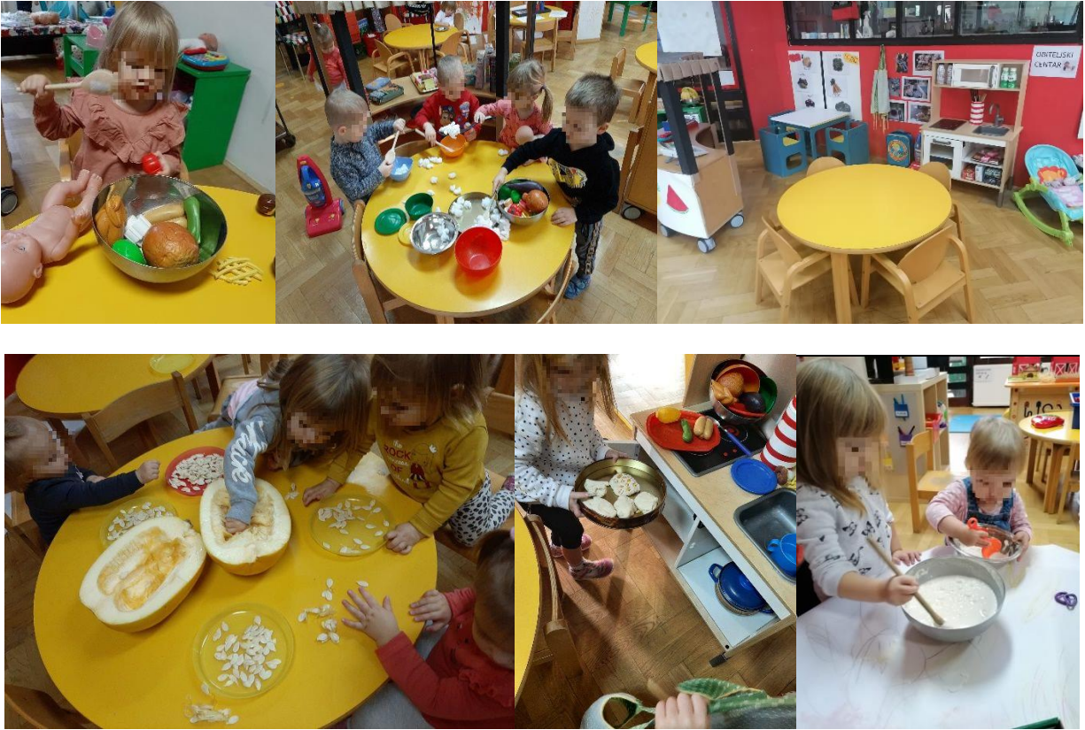
Slika 12. Igra u obiteljskom centru

U priručniku za samovrednovanje (NCVVO, 2012) navedeno je kako didaktička sredstva i pomagala moraju zadovoljiti sve zadaće koje se ostvaruju u odgojno-obrazovnoj ustanovi. Trebaju biti razvojno primjerena, pedagoški promišljena, funkcionalna, privlačna i raznovrsna.