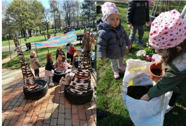
Slika 21. Prostor za mirne aktivnosti

Upravo prostor za mirne aktivnosti Hansen i suradnici (2001), osim za odmor, predviđaju i za aktivnosti koje se mogu spojiti s aktivnostima iz SDB. Promatrajući dječji interes i vodeći se spomenutim smjericama, odgojiteljice nadograđuju postojeće stanje poticajima za istraživanje transparentnosti, geometrijskih oblika te boja (Slika 23), poštujući interese djece iz susjedne skupine s kojima dijele vanjski prostor. Spomenuti prostor, s obzirom na blizinu sanitarnog čvora, odgojiteljice koriste i za organiziranje raznih likovnih aktivnosti (Slika 22).