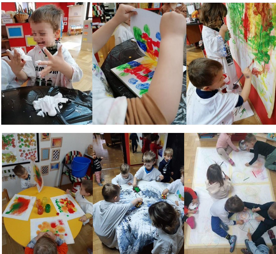
Slika 6. Likovno izražavanje i istraživanje

U blizini sanitarnog čvora smješten je likovni centar. Aktivnosti nuđene u likovnom centru svoj djeci, a naročito jasličkoj koja tek započinju s otkrivanjem mogućnosti likovnog izražavanja, pruža radost, uzbuđenje i zadovoljstvo. Glavna mu je svrha poticanje kreativnosti, radoznalosti, inicijative i mašte ( Hansen i sur., 2004). U ovom centru djeca intenzivno istražuju kroz čitav niz materijala stoga je važno da odgojitelji vode računa o mnoštvu materijala i njihovoj dostupnosti. Kroz grafičko otiskivanje raznih oblika djeca su pokazala interes za geometrijske oblike te je interes produbljen unošenjem poticaja u druge centre.