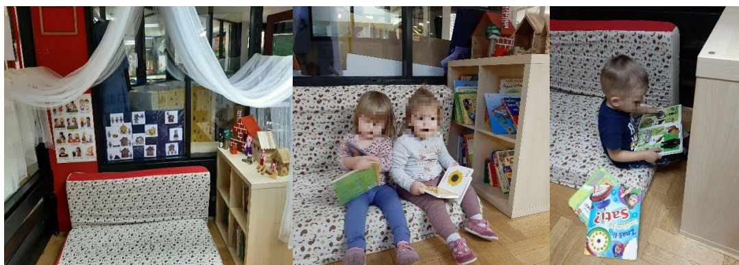
Slika 1. Aktivnosti listanja slikovnica

U odgojnoj skupini Cipelići takav centar naziva se mirni centar u kojem su djeci ponuđene mekane spužve za odmor, slikovnice i rekviziti za pričanje priča (Slika1). Taj se prostor ujedno koristi i za dramatizacije djece i odgojiteljica (Slika 2).