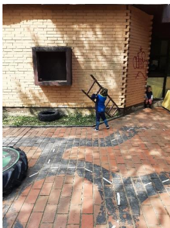
Slika 17. Samoorganizirana igra ljestvama

Koristeći dijelove poligona djeca samoorganiziraju igru prema vlastitom interesu. Dječak uzima ljestve i kao vatrogasac postavlja ih na zid, pri čemu izmjenjuje njihovu veličinu i kosinu postavljanja te dolazi do vlastitih zaključaka i konačnog cilja, postavljanje ljestava i penjanje po njima (Slika 17).