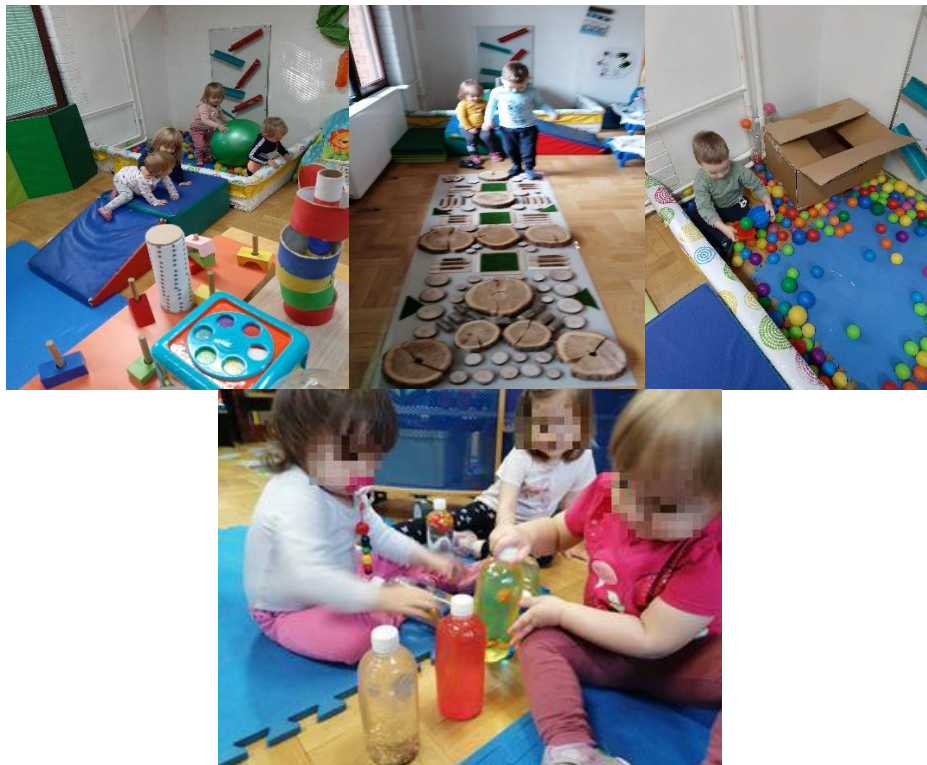
Slika 8. Senzomotoričke aktivnosti

U nastavku senzomotornog centra redovito se izmjenjuj različiti materijali i podloge (Slika 8) koje osim djelovanja na osnovne receptore djeluju i na razvoj ravnoteže. Na tu je sposobnost moguće djelovati od najranije dobi stoga je važno da i u unutarnjim prostorima odgojitelji vode računa o tome.