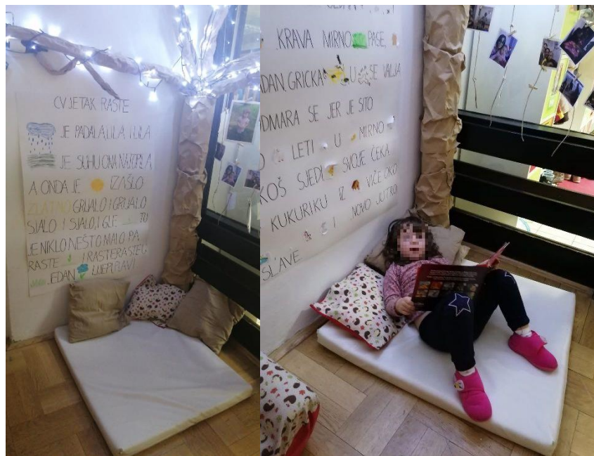
Slika 3. Slikovni prikazi gestovne pjesme i priče

U nastavku predprostora mirnog centra smješten je svjetlosni stol s rekvizitima za istraživanje transparentnosti materijala (Slika 4) te manipuliranje i nizanje na linije raznih oblika (Slika 5). Slika 5 prikazuje dječaka kako otkriva transparentnost kamena gledajući kroz njega.