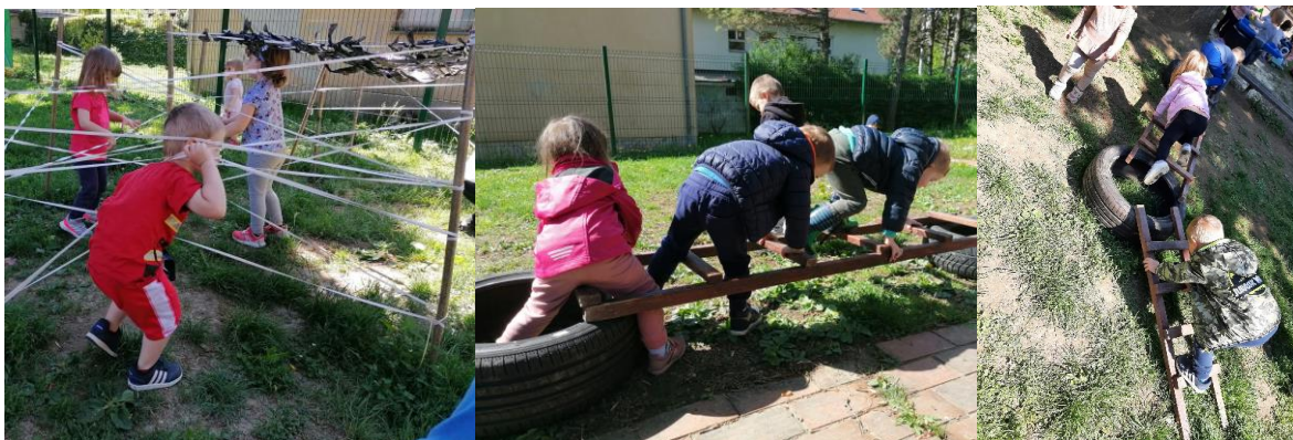
Slika 16. Igra na motoričkom poligonu

Koristeći dijelove poligona djeca samoorganiziraju igru prema vlastitom interesu. Dječak uzima ljestve i kao vatrogasac postavlja ih na zid, pri čemu izmjenjuje njihovu veličinu i kosinu postavljanja te dolazi do vlastitih zaključaka i konačnog cilja, postavljanje ljestava i penjanje po njima (Slika 17).