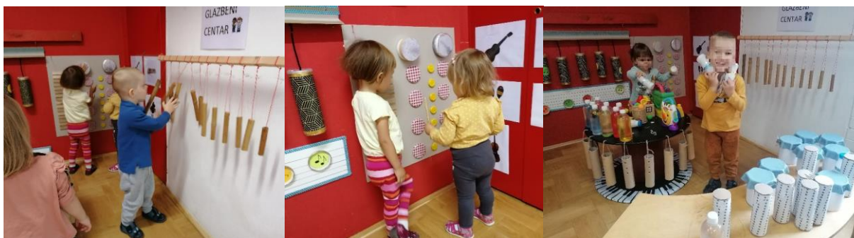
Slika 9. Igra i istraživanje u glazbenom centru

Centar građenja osim same manipulacije različitim kockama pruža djeci mogućnost rješavanja problema (Stokes Szanton, 2005). Poput, kako nataknuti kocku na kocku, kako izgraditi visoki toranj, garažu. Kako napraviti cestu ili farmu (Slika 10). U centru građenja djeca kao i u ostalim centrima razvijaju socijalne i komunikacijske vještine, znanje o prirodi, matematici te razvijaju motoričke vještine. Uče što je visina, oblik, koordiniraju pokrete oko ruka te uče sortirati i pospremati stvari po završetku igre (Hansen i sur. 2004). Iako je to centar u kojem odgojitelji najmanje interveniraju, praćenjem dječjih interesa moguće ga je unaprijediti unošenjem prirodnih materijala, izradom kosina, kućica. U svakodnevnoj igri djeca navedene jasličke skupine pokazala su interes za domaće životinje stoga su odgojiteljice podržale dječji interes dodajući prirodne materijale kojima su životinje okružene te zajedničkom izradom farme (Slika 11.)