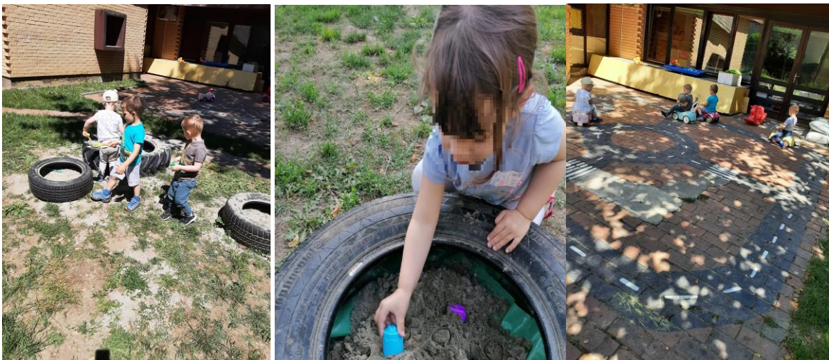
Slika 20. Prostor za igru pijeskom i vožnju

Također sugeriraju i prostor s malim vrtom u kojem će djeca saditi i promatrati rast biljaka tijekom dužeg perioda. U skupini Cipelići djeca sade biljke koje su smještene na pokretnom stalku kako bi se cjelokupan prostor mogao reorganizirati prema potrebama i