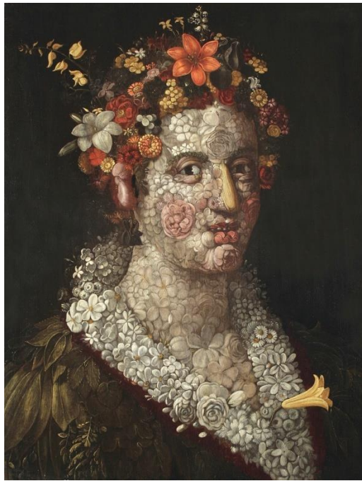
Slika 11. Giuseppe Arcimboldo "Flora" (1591.)