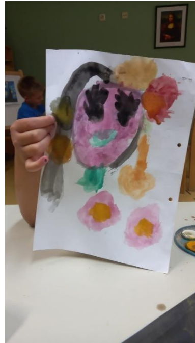
Slika 33. L.Š. (6 god. i 4 mj.)