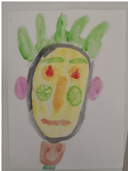
Slika 34. H.B. (6 god. i 5 mj.)