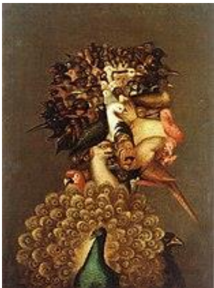
Slika 16. Giuseppe Arcimboldo "Zrak" (1566.)