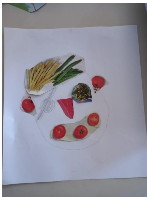
Slika 27. M.K. (5 god. i 2 mj.)