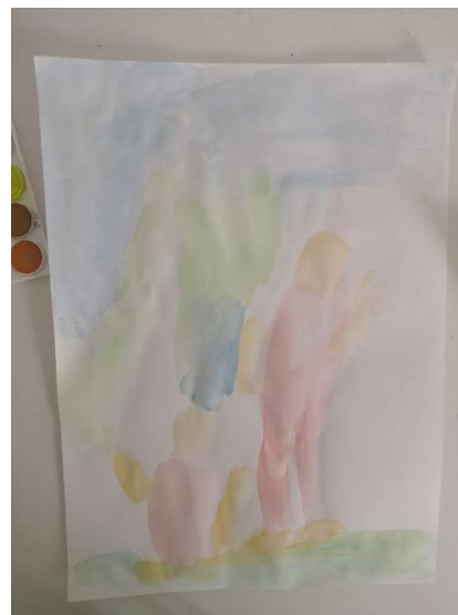
Slika 40. M.K. (5 god. i 2 mj.)