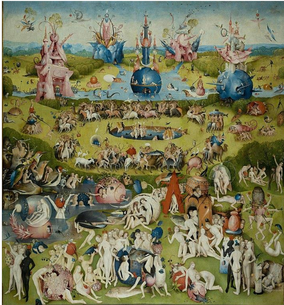
Slika 1. Hieronymus Bosch "Vrt naslade" (1503.-1515.)