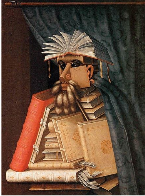
Slika 8. Giuseppe Arcimboldo "Knjižničar" (1566.)