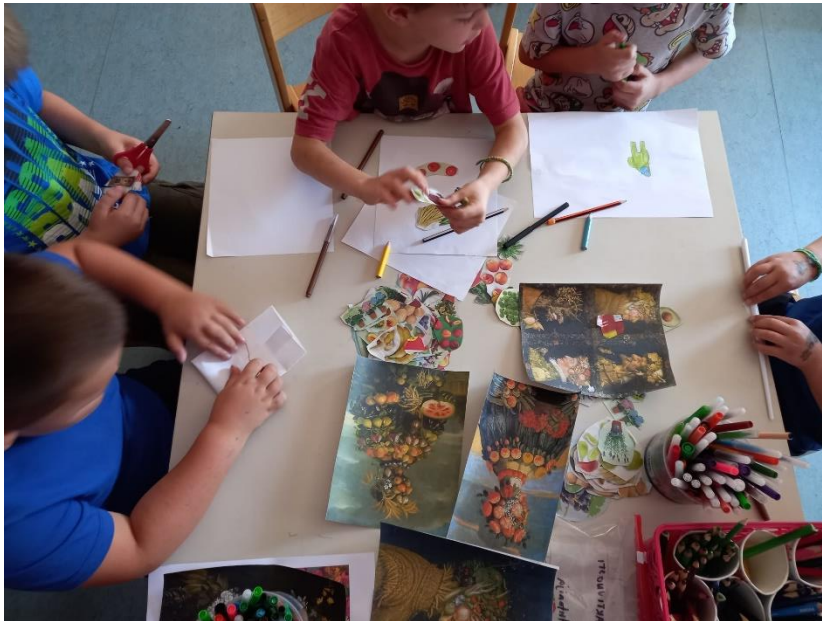
Slika 25. Proces izrade (Arcimboldo)

Drugi slikar koji je predstavljen djeci i koji je izazvao najviše oduševljenja je bio Giuseppe Arcimboldo. Pokazani su im alegorijski portreti po kojima je Arcimboldo bio poznat. Oni su im bili vrlo smiješni i komentirali su različite aspekte slike, te dijelove tijela i lica subjekata na portretima. U prvom dijelu aktivnosti je djeci ponuđen kolaž raznog voća, povrća i cvijeća izrezanih iz časopisa. Od tih materijala su izrađivali svoje verzije Arcimboldovih portreta. U drugom dijelu aktivnosti im je ponuđena tehnika vodenih boja i tempera, te su slikali neobične portrete kako god su htjeli i kako god su doživjeli inspiraciju pred sobom što je dovelo do vrlo kreativnih „povrtnih i voćnih“ lica.