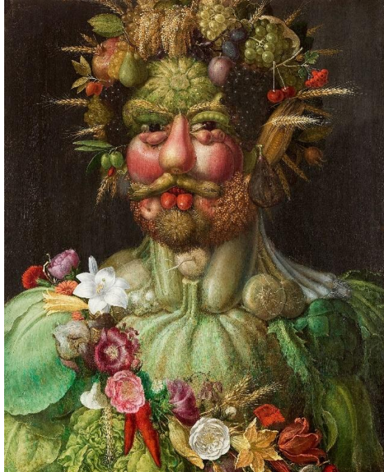
Slika 10. Giuseppe Arcimboldo "Vertumnus" (1591.)