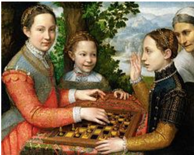
Slika 7. Sofonisba Anguissola "Partija šaha" (1555.)