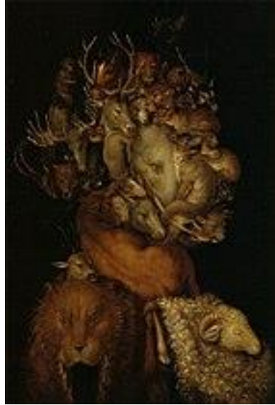
Slika 18. Giuseppe Arcimboldo "Zemlja" (1566.)