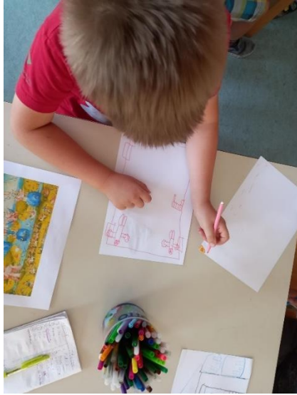
Slika 21. M.K. (5 god. i 2 mj.)