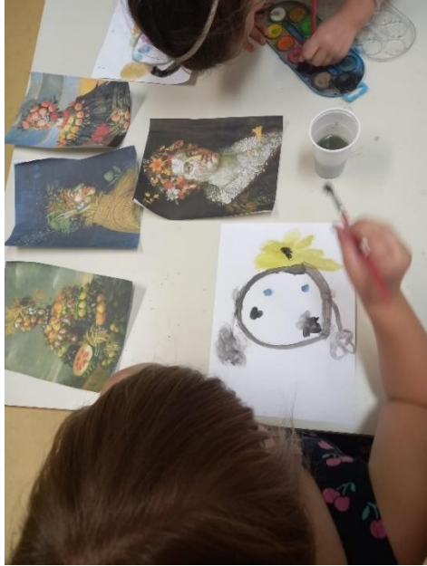
Slika 30. Proces izrade (Arcimboldo)