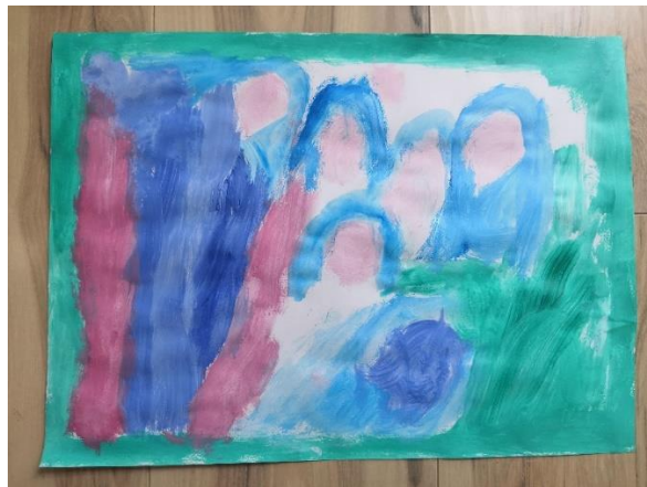
Slika 38. I.Č. (6 god. i 6 mj.)

Sljedeća aktivnost je u središte stavljala manirističkog slikara Jacopa de Pontorma i senzibilnost u njegovim umjetničkim djelima. On je bio poznat po tome da je koristio izrazito nježne i svijetle tonove pa je djeci bio zadatak da slikaju samo sa svijetlim bojama. Tehnika kojima su slikali je bila vodena boja da se dodatno ukaže na senzibilnost njegova pristupa umjetnosti.