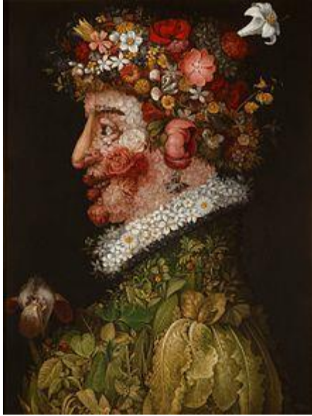
Slika 12. Giuseppe Arcimboldo "Proljeće" (1563.)