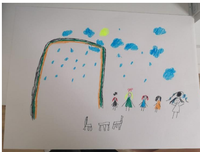
Slika 42. L.Š. (6 god. i 4 mj.)