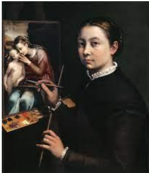
Slika 6. Sofonisba Anguissola "Autoportret" (1556.)

virtuoznost slikarice postavljajući svoje figure u različite poze. Pogledi subjekata vode oko gledatelja po platnu i na kraju se vraćaju na samu umjetnicu, koja zauzima poziciju izvan platna. Sofonisba također pokazuje svoje vještine i talentiranost slikajući različite teksture na odjeći svojih sestara i na tepihu ispod šahovske ploče. (L. Kilroy-Ewbank, 2016)