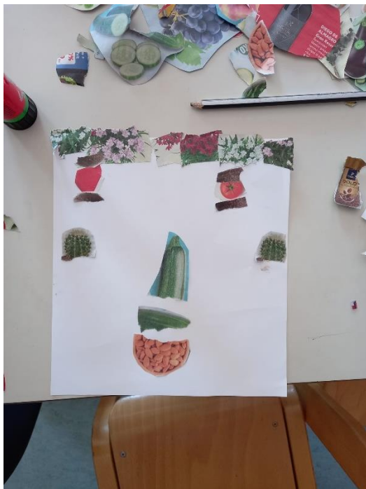
Slika 26. D.T. (5 god. i 9 mj.)