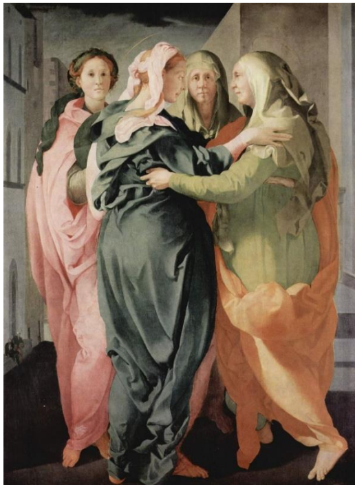
Slika 5. Jacopo de Pontormo "Vizitacija" (1528.-1529.)