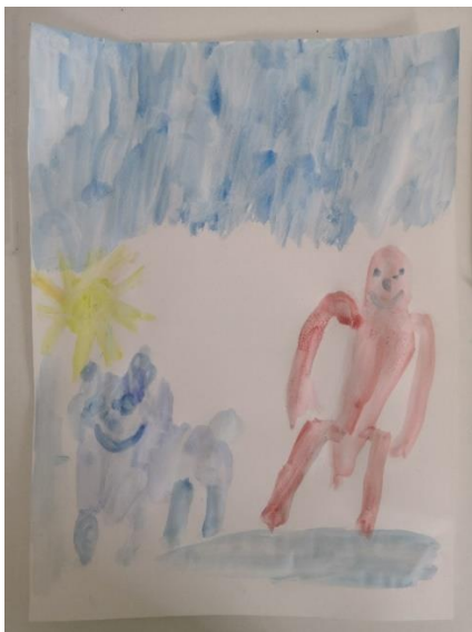
Slika 39. M.K. (5 god. i 2 mj.)