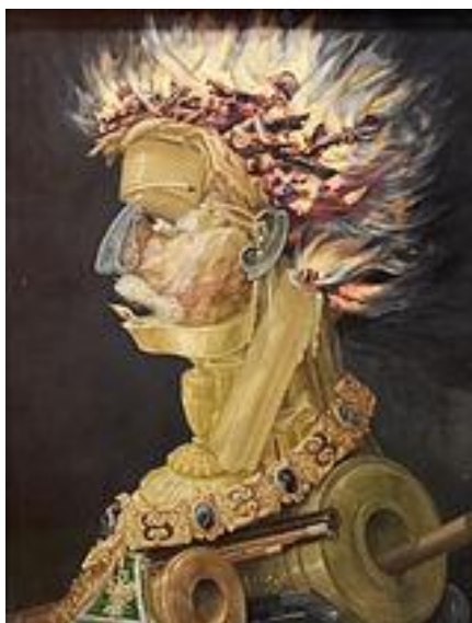
Slika 17. Giuseppe Arcimboldo "Vatra" (1566.)