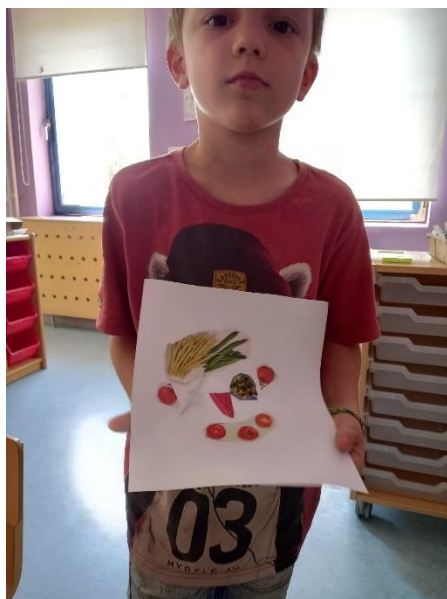
Slika 28. M.K. (5 god. i 2 mj.)