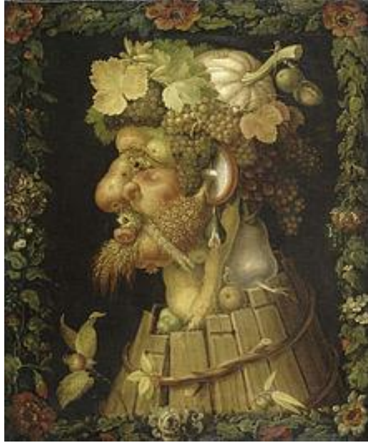
Slika 14. Giuseppe Arcimboldo "Jesen" (1573.)