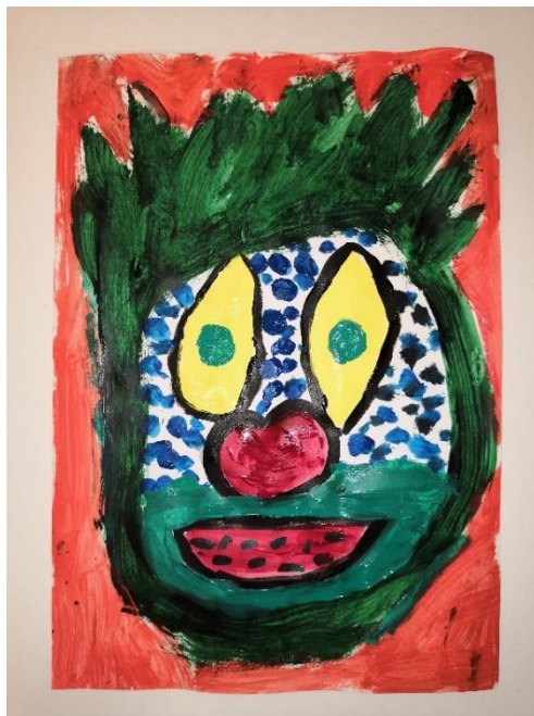
Slika 37. I.Č. (6 god i 6 mj.)

“Meni se najviše sviđa što su ove cure od cvijeća. Cijela faca joj je od cvijeća i koža i sve.”