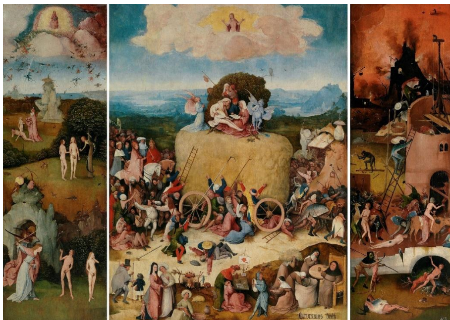
Slika 3. Hieronymus Bosch "Triptih Haywain" (1516.)