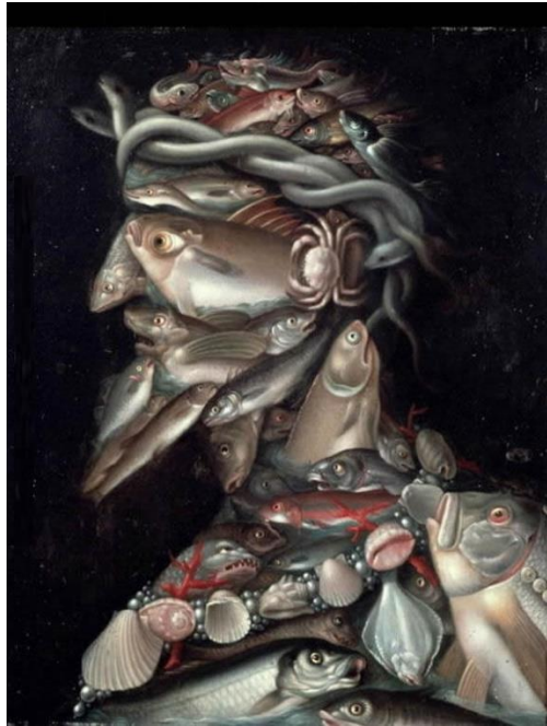
Slika 9. Giuseppe Arcimboldo "Admiral" (1560.)