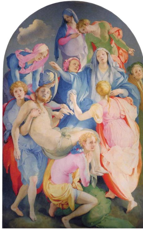
Slika 4. Jacopo de Pontormo "Prenošenje Krista" (1525.-1528.)