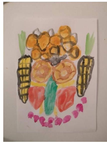
Slika 35. M.K. (5 god. i 2 mj.)