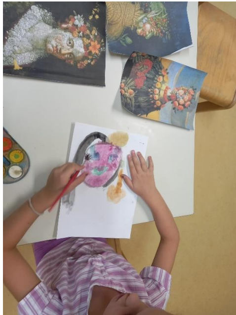
Slika 31. Proces izrade (Arcimboldo)