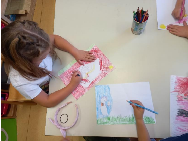
Slika 23. Proces izrade (Bosch)