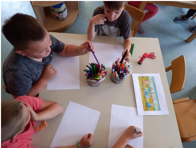
Slika 20. Proces izrade (Bosch)

Prvi slikar kojega su djeca upoznala je bio Hieronymus Bosch, prikazana im je polovica djela „Vrta naslade“ te „Triptih Haywain“. Ukazano im je na to da je ovaj umjetnik ispunio svaki dio prostora koji je mogao na slici stvarivši tako pojam koji se zove „horor vacui“ što znači strah od praznog prostora. Djeca su komentirala različite aspekte na slikama i često zapitkiivala trebaju li popuniti baš svaki prazni dio na papiru. Tehnike koje su sami izabrali su bile drvene bojice i flomasteri. Tematika koju su crtali je bila slobodna, po želji, iako je jedna djevojčica nacrtala svoju verziju „Vrta naslade“, onako kako ga je ona doživjela. Mnogima je bilo naporno popuniti sve pa su odustajali od pokušaja, ali sve u svemu je aktivnost protekla glatko, u međusobnoj priči i komentiranju Bochove slike.