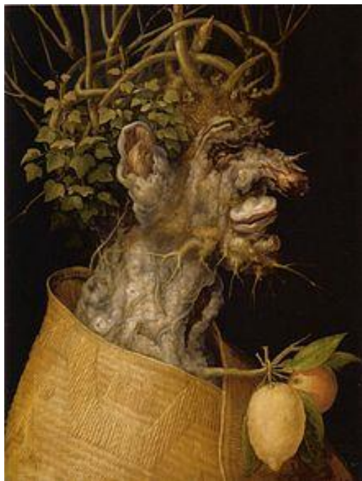
Slika 15. Giuseppe Arcimboldo "Zima" (1573.)