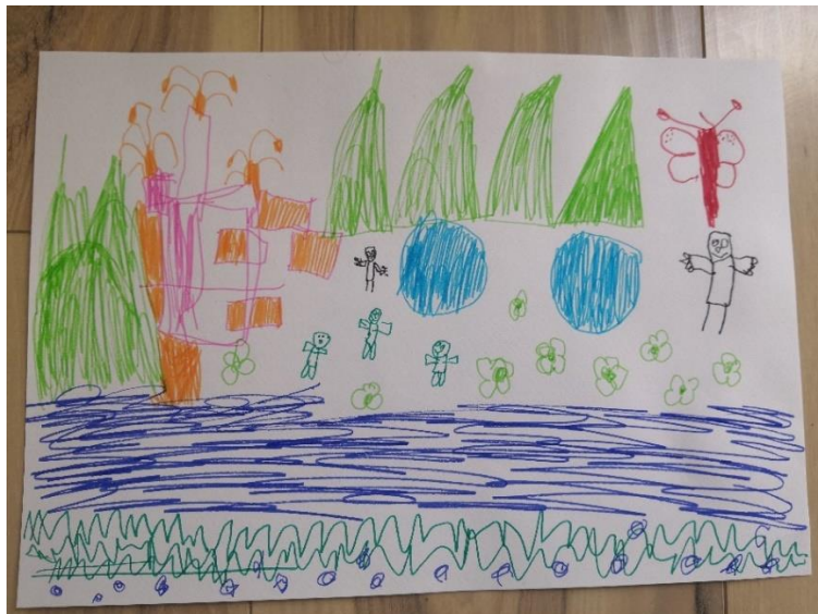
Slika 24. M.M. (4 god. i 8 mj.)

“A zaš' se zove horor kad nije ništa strašno na slici?”