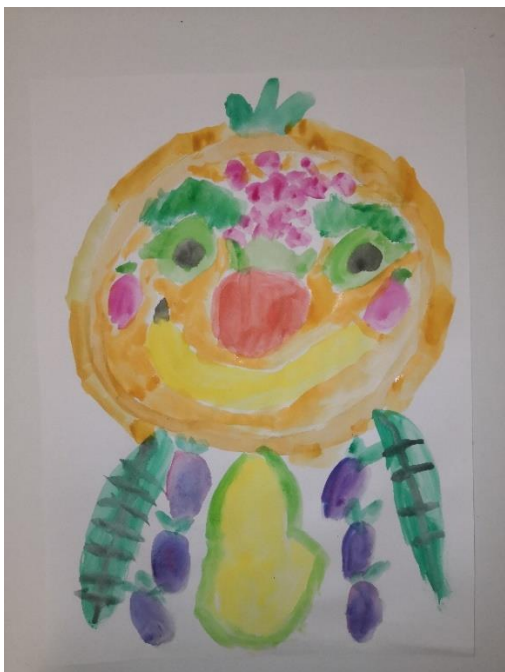
Slika 36. V.A. (6 god. i 6 mj.)