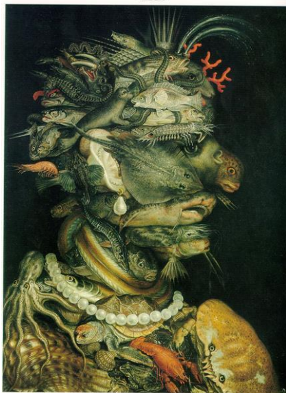
Slika 19. Giuseppe Arcimboldo "Voda" (1566.)