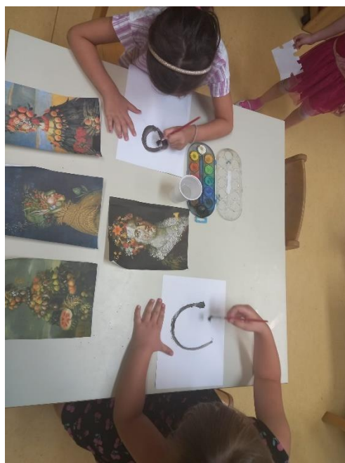
Slika 29. Proces izrade (Arcimboldo)