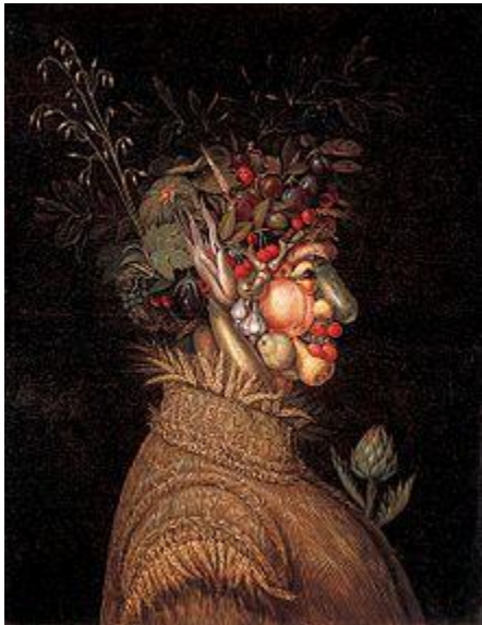
Slika 13. Giuseppe Arcimboldo "Ljeto" (1573.)