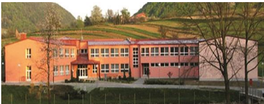
Slika 2. Osnovna škola Izidora Poljaka Višnjica

Vrata nove osnovne škole koja djeluje i danas otvorena su 18. svibnja 2001. godine, a s dodatnim učeničkim prostorima i sportskom dvoranom dograđena je 2007. godine. Od tada se nastava u njoj odvija u jednoj (jutarnjoj) smjeni.