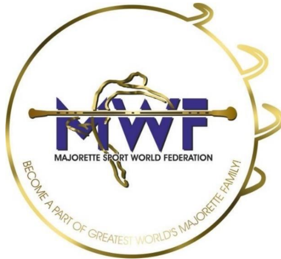
Slika 4. Grb MWF-a

Ostale velike svjetske mažoret asocijacije su International Federation od Majorette Sport (IFMS), World Baton Twirling Federation (WBTF) i United States Twirling Association (USTA) (SMPH, 2016).