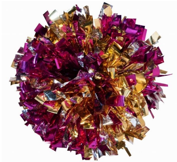
Slika 7. Pom-pon

Dobro razvijene motoričke sposobnosti su iznimno važna osobina sportaša u svim sportovima pa tako i u mažoretu. „Motoričke sposobnosti. Uvjetovano se definiraju kao latentne motoričke strukture koje su odgovorne za beskonačan broj manifestnih motoričkih reakcija i mogu se izmjeriti i opisati.“ (Findak, 2003, str. 218). Bez dobro razvijenih motoričkih sposobnosti, nemoguće je doći do uspjeha u bilo kojoj kategoriji ili rekvizitu. Rekvizit u kojem motoričke sposobnosti najčešće i najviše dolaze do izražaja je pom-pon. Pom-pon je kategorija ispunjena gimnastičkim i akrobatskim elementima, elementima skokova te elementima fleksibilnosti, a sve to u kombinaciji rada s rekvizitom koji kroz godine postaje sve složeniji, a čiji su elementi po težini podijeljeni u četiri stupnja.