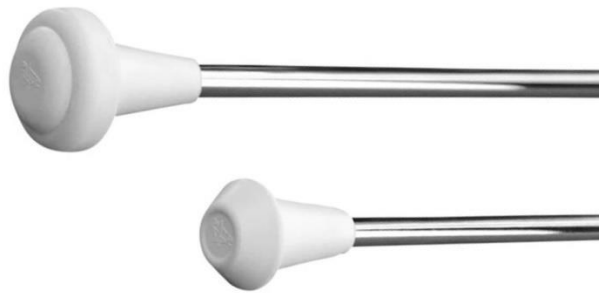
Slika 8. Štap

spajanja dva ili više rola (layout, lakat-dlan-dlan-lakat), kontinuirano ponavljanje jednog rola („fish“) te rad s dva štapa izvodeći s oba štapa najmanje elemente trećeg stupnja istovremeno. Od bacanja tu spadaju visoka bacanja s teškim izbacivanjem (varijacije flipa) i teškim prihvaćanjima (back hand catch, blind catch i prihvaćanje u daljnju rotaciju), te visoka izbacivanja s kretanjima (stupovni korak, chasse), pozama, spinom (okret od 360° sa stopalom podignutim od poda), višestrukim okretima ili kombinacije više elemenata (SMPTH, 2024).