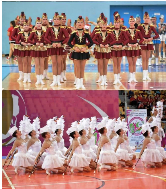
Slika 3. Primjer klasične i moderne mažoret uniforme s istaknutim predvodnicama (Novoborske Mažoretke, Žilinske mažoretke Diana)

Kostim je u prošlosti morao krajem podsjećati na vojničku uniformu što je sada također izmijenjeno. Kostimi su danas prilagođeni stilu glazbe svake pojedine koreografije, a kroj je mnogo slobodniji. Bitno je naglasiti uniformiranost skupine te mogućnost postojanja „predvodnice“ koja može biti istaknuta drugačijom odore ili elementima odore ili istom odore u drugačijoj boji. U nekim kategorijama i dalje vrijedi pravilo klasičnog kroja (npr. classic štap, classic pom-pon, mace), no u ostalima kostim ne mora sadržati niti jedan element klasične mažoret odore odnosno suknje, kape ili čizama (npr. twirling acrobatic, pom-pon, mix). U štapu kao rekvizitu, odora mora sadržavati barem dva od tri elementa klasične mažoret uniforme u svim dobnim skupinama (Savez Mažoretkinja i Pom-pon Timova Hrvatske, 2024).