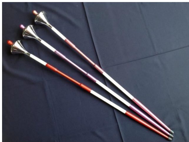
Slika 2. Mace

Uzeći u obzir nešto mlađi rekvizit baton flag odnosno štap sa zastavom, teorija o evoluciji od švicarskih bacača zastava pod nazivom bandieratori također je jedna od mogućnosti (Božić, Ilić i Mercandel, 2012). Hadji Cheriff bio je žongler i drum-major koji je svoja znanja spojio u jedno te se 1893. godine u Chicagu predstavio nastupom vrtnje puškom izvodeći elemente poznate u današnjem mažoret plesu i twirlingu. Kasnije je i drum-major Johnnie Reilly izvodio točke vrteći štap, a u svoje točke ubacivao je i izbacivanja štapa. 1938. godine Maxine Turner je kao drum-majorette imala veliku podršku svoje majke koja joj je za nastup s orkestrom izradila uniformu sličnu karakterističnoj mažoret uniformi, a od tada na dalje, mažoret ples se sve više razvijao te je 1940. godine Don Starell osnovao prvu organizaciju mažoretkinja i twirlera pod nazivom National Baton Twirling Association, skraćeno NBTA (SMPH, 2016).