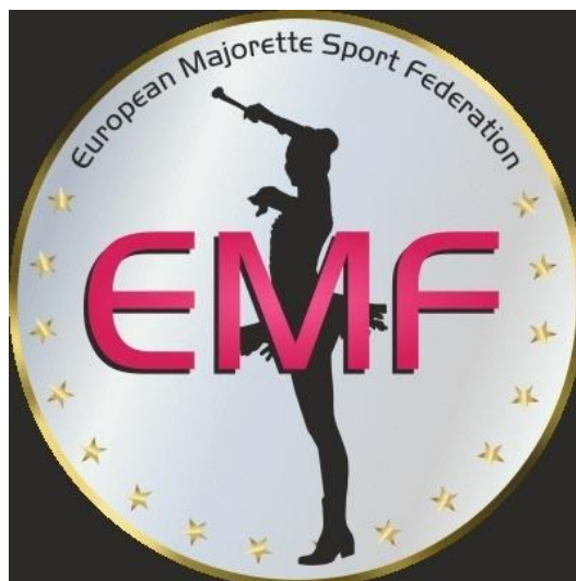
Slika 5. Grb EMF-a

U Hrvatskoj je prvi savez bio Hrvatski Savez Amaterskih Mažoret Timova (HRSAM) osnovan 1996. godine koji još uvijek djeluje. 1999. godine se dio timova nezadovoljan HRSAM-om odvojio u Hrvatski Mažoret Savez (HMS) koji je ujedno bio i suosnivač EMA-e. 2003. godine je u Sisku osnovan Savez Mažoretkinja i Pom-pon Timova Hrvatske kojeg je osnovalo pet timova nezadovoljnih HMS-om (SMPH, 2016). Od 2003. godine, SMPH krenuo je prema brzom napretku mažoret plesa i razvoju specifičnog stila pod okriljem MWF-a. U međuvremenu su osnovani i Hrvatska Udruga Mažoret Timova (HUMT) i Alliance Majorette Adriatica (AMA).