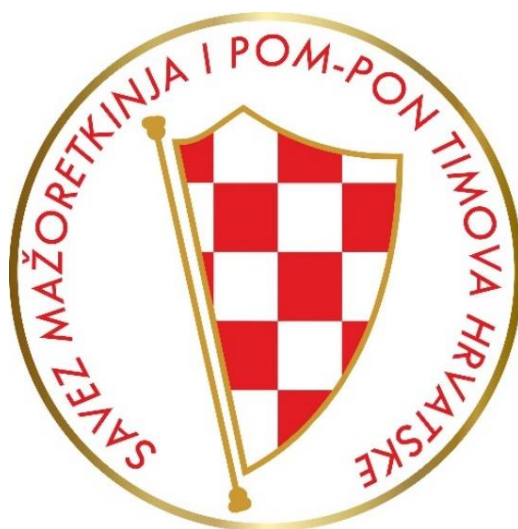
Slika 6. Grb SMPH-a

U Hrvatskoj je prvi savez bio Hrvatski Savez Amaterskih Mažoret Timova (HRSAM) osnovan 1996. godine koji još uvijek djeluje. 1999. godine se dio timova nezadovoljan HRSAM-om odvojio u Hrvatski Mažoret Savez (HMS) koji je ujedno bio i suosnivač EMA-e. 2003. godine je u Sisku osnovan Savez Mažoretkinja i Pom-pon Timova Hrvatske kojeg je osnovalo pet timova nezadovoljnih HMS-om (SMPH, 2016). Od 2003. godine, SMPH krenuo je prema brzom napretku mažoret plesa i razvoju specifičnog stila pod okriljem MWF-a. U međuvremenu su osnovani i Hrvatska Udruga Mažoret Timova (HUMT) i Alliance Majorette Adriatica (AMA).