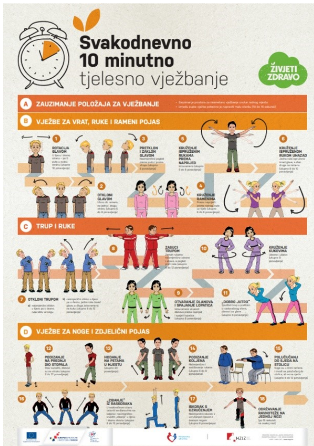
Slika 3. Plakat vježbanje za djecu (Hrvatski zavod za javno zdravstvo, 2018)

Djeca u dobi od treće do šeste godine razvijaju pozitivne navike koje se kasnije prenose na odraslu dob. Omogućavanjem ranog sudjelovanja u tjelesnim aktivnostima prilagođeno njihovom razvoju, djeca stječu temelje za zdrav način života i razvoj složenih motoričkih vještina potrebnih za svakodnevni život, koristeći se igrama i sportskim aktivnostima. Poučavanjem djece o važnosti kretanja, pružaju im se brojne životne mogućnosti te potiče uživanje u tjelesnim aktivnostima, što doprinosi njihovom fizičkom, mentalnom i društvenom razvoju. Djeca ponavljanjem vježbi i različitih aktivnosti razvijaju skladnost pokreta, preciznije upravljaju svojim pokretima, ali i predmetima u njihovoj blizini. Tjelesna aktivnost u predškolskoj dobi ključna je za razvoj posture tijela, motoričkih vještina te uspostavljanje odnosa s okolinom kroz različite faze kretanja, od pokreta glave do samostalnog hodanja (Rečić, 2006).