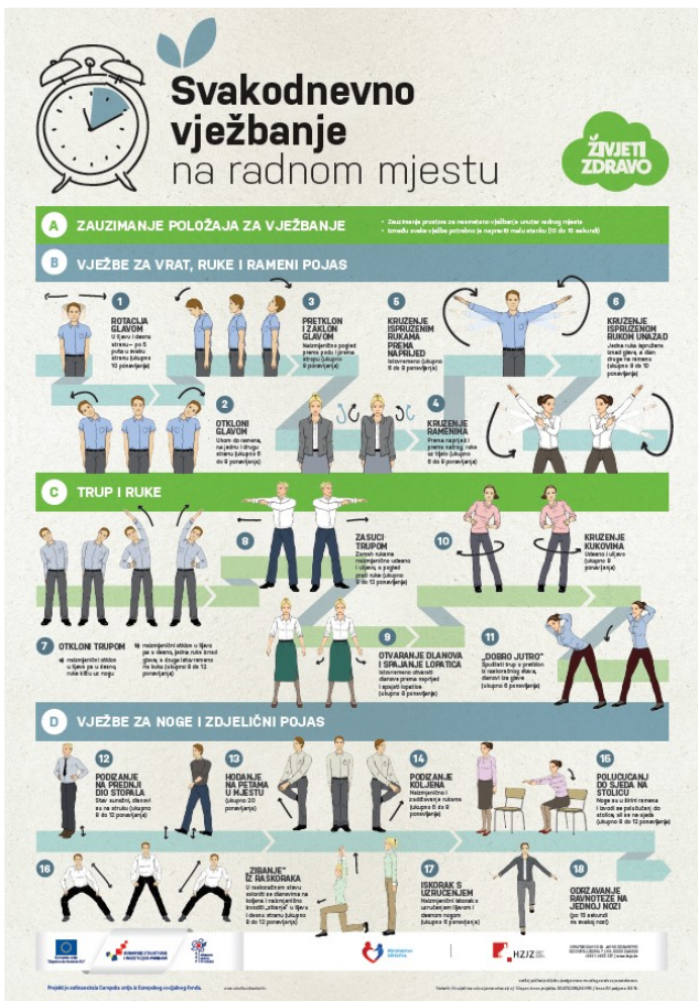
Slika 2. Plakat vježbanje za odrasle (Hrvatski zavod za javno zdravstvo, 2018)