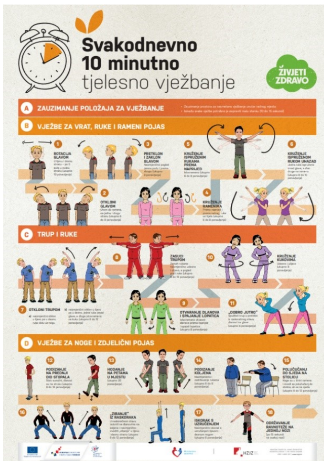
Slika 3. Plakat vježbanje za djecu (Hrvatski zavod za javno zdravstvo, 2018)

Djeca u dobi od treće do šeste godine razvijaju pozitivne navike koje se kasnije prenose na odraslu dob. Omogućavanjem ranog sudjelovanja u tjelesnim aktivnostima prilagođeno njihovom razvoju, djeca stječu temelje za zdrav način života i razvoj složenih motoričkih vještina potrebnih za svakodnevni život, koristeći se igrama i sportskim aktivnostima. Poučavanjem djece o važnosti kretanja, pružaju im se brojne životne mogućnosti te potiče uživanje u tjelesnim aktivnostima, što doprinosi njihovom fizičkom, mentalnom i društvenom razvoju. Djeca ponavljanjem vježbi i različitih aktivnosti razvijaju skladnost pokreta, preciznije upravljaju svojim pokretima, ali i predmetima u njihovoj blizini. Tjelesna aktivnost u predškolskoj dobi ključna je za razvoj posture tijela, motoričkih vještina te uspostavljanje odnosa s okolinom kroz različite faze kretanja, od pokreta glave do samostalnog hodanja (Rečić, 2006).