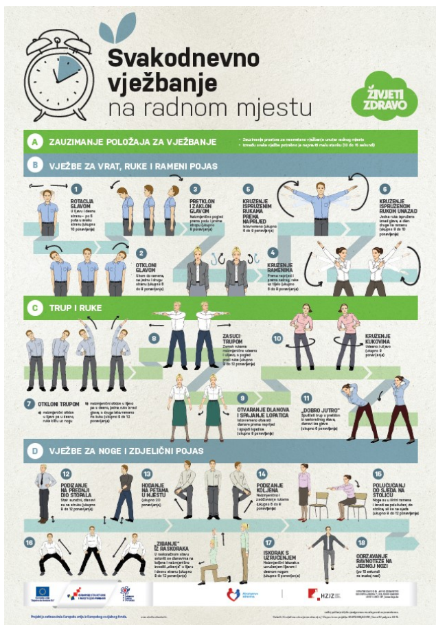
Slika 2. Plakat vježbanje za odrasle (Hrvatski zavod za javno zdravstvo, 2018)