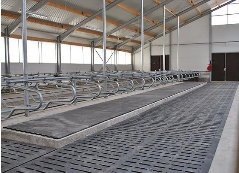
Slika 4. Ležišta za krave obložena gumenim oblogama.