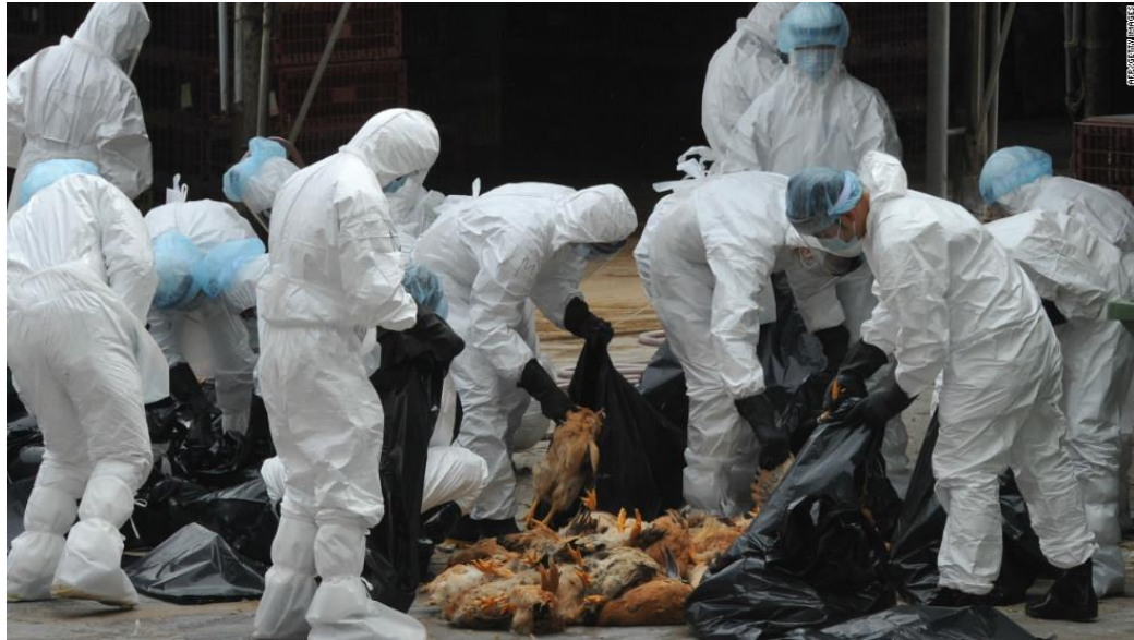
Slika 7. Uklanjanje lešina preventivno zaklane peradi.

provodi zakapanjem ili odvozom u kafilerije (slika 7). U područjima gdje se zakapanje smatra prigodnim, iskopana rupa mora biti barem 2 metra duboka i široka što omogućuje zakapanje cca. 300 jedinki s prosječnom težinom od 1,8 kg. Lešine se potom prekriva slojem kalcijevog hidroksida i slojem zemlje od minimalno 40 cm debljine. Pri prijevozu u kafileriju, vozilo mora osigurati nemogućnost istjecanja sadržaja u okoliš (IZSVe, s.a.).