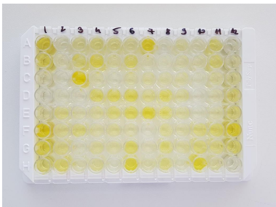
Slika 5. Mikrotitracijska pločica nakon očitavanja rezultata ELISA testiranja

Ukupno je pretražen 91 uzorak mesnog soka domaćih svinja od kojih 54 uzorka potječu s 18 velikih svinjogojskih farmi na kojima je prosječno tovljeno 3793 svinje godišnje, te 37 uzoraka koji potječu s 18 seoskih domaćinstava koja prosječno drže 8 svinja na gospodarstvu. Svinja se smatra seropozitivnom ukoliko je S/P omjer uzorka bio veći ili jednak 0.3, dok se farma smatra pozitivnom ukoliko je barem jedan uzorak na farmi bio seropozitivan. Rezultati serološke pretrage prikazani su u tablici 1 i tablici 2 sukladno tipu farme podrijetla i kategoriji biosigurnosti.