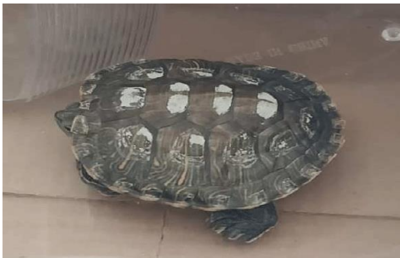
Slika 7. Ulcerativna bolest oklopa u vidu bijelih mrlja po sredini karapaksa crvenouhe kornjače prije liječenja