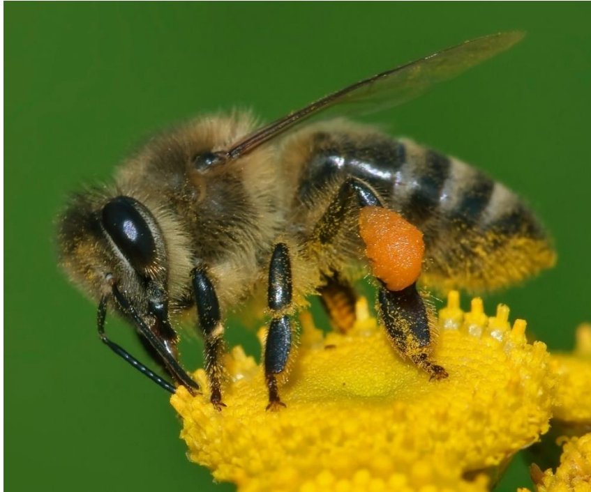
Slika 1. Pelud u peludnoj košarici na 3. paru nogu pčele radilice.

Povećani poticaj pčelama za skupljanje peludi je povećanje površine saća s položenim leglom. Otkriven je dnevni ritam skupljanja peludi, odnosno biljke se prilagođavaju svojim oprašivačima i čine pelud dostupnu kada su oprašivači najviše aktivni (HERRERA, 1990.). Prije nego što može biti skupljen, cvjetni prašnici moraju otpustiti zrela peludna zrnca i to se događa u određeno doba dana, a razlikuje se od biljke do biljke (PERCIVAL, 1950.).