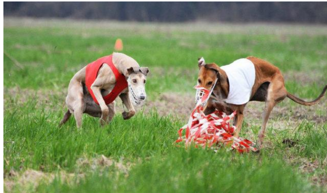
Slika 13 Lov hrtova na umjetni mamac

U ovoj disciplini nema žrtava ni lovine jer se lovi umjetni mamac (Slika 13) koji je građen od skupa plastičnih traka pričvršćenih za užu koje skreće preko kolotura postavljenih na travnatoj površini. Staza treba biti dinamično postavljena da kretnja mamca, koja simulira trk divljači, oponaša pravi lov. Duljina staze je 600 m. Psi na taj način zadovolje svoj lovni nagon, istrčavanjem se riješe velike količine energije, ali i jačaju agilnost, inteligenciju i snalažljivost. Na natjecanju psi trče dvije različite utrke (vožnje) u paru gdje uče međusobno surađivati. Svaka vožnja ima drugačiju putanju mamca što zahtijeva inteligenciju i timsku suradnju pasa. Sudac boduje svaku vožnju, te se na kraju određuje konačan poredak pasa. Ukoliko pas tijekom lova izgubi mamac iz vidnog polja, promatra se na koji način se ponovno vraća u lov te sudac boduje njegovu težnju za nastavkom utrke. Ujedno se tijekom utrke stavlja naglasak na međusobnu komunikaciju pasa. Psi ne smiju ometati jedan drugoga niti pokazivati agresivnost. Na natjecanju se ne mjeri vrijeme već se prate karakteristike poput agilnosti, izdržljivosti, praćenje mamca, želja za lovom i brzina jednog psa prema drugom (GREGL, 2018.).