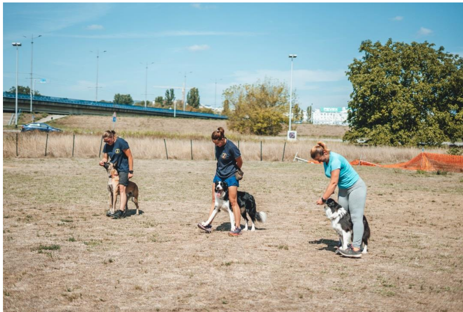
Slika 12 Vježba „hodanje na stopalima vodiča“

U ovoj disciplini, naglasak je na izgrađivanju boljeg odnosa sa psom, poboljšavanju fokusa psa na vodiča, razvitku međusobnog povjerenja te na mentalnoj stimulaciji psa. Trikovi služe kao dobra priprema psa za daljnje discipline kao što je rally obedience , dog dancing i freestyle frisbee što je kombinacija frizbija i trikova. Na početku, psi se upoznaju s osnovama rada s klikerom, a nakon toga se kreće u izradu baza za trikove. Kliker dresura potiče pozitivno ponašanje. Kliker je plastična kutija koja ima ugrađen komad metala, koji kada se pritisne proizvodi zvuk „klik“. Prvo treba pronaći motivaciju za psa, kao što je igračka ili hrana. Kada pas učini određenu radnju koju vlasnik traži, slijedi zvuk klikera. Nagrada uvijek mora slijediti zvuk klikera. Postepeno, pas će nastavljati raditi tu radnju te mu vlasnik više neće morati dati nagradu. Na tečaju trikova se uči 20 – ak trikova. Neki od trikova koji se uče u ovoj disciplini su „daj šapu“, „slalom kroz noge“, „puzi“, „hodanje na stopalima vodiča“ (Slika 12), „hodanje unatrag“, „okret“, „roll“ te „slalom kroz noge na mjestu“. Postoje dva stupnja trikova. Na prvom stupnju uče se osnovni trikovi, dok se na drugom stupnju radi nadogradnja sa težim i zahtjevnijim trikovima (KOSSP, 2022.).