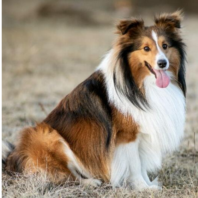
Slika 4 Šetlandski ovčar