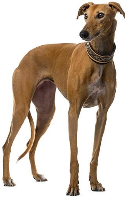
Slika 14 Veliki engleski hrt (eng. Greyhound )

Kretanje je niskog koraka. Veliku brzinu hrtu omogućava slobodan iskorak. Dlaka je polegnuta i tanka, a može biti raznih boja, od bijele, crvene, plave, crne, jelenje žute i tigraste. Svaka od boja može biti i prošarana s bijelim mrljama (HKS, 2022.d; FCI, 2011.).