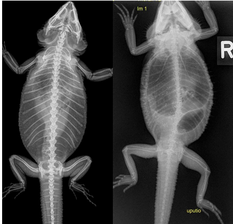
Slika 2. Usporedan rendgenski prikaz kostura zdrave bradate agame (lijevo) i pacijenta s nalazom generaliziranog prorijeđenja kostura, tzv. metaboličke bolesti kostiju (desno)

proliferacijom, stanjeni koštani korteks te patološke frakture i povijanja dugih cjevastih kostiju (HOLMES i DIVERS, 1996.B). Trauma rezultira ozlijedom mekog tkiva, subluksacijom ili luksacijom zgloba i prijelomima kostiju.